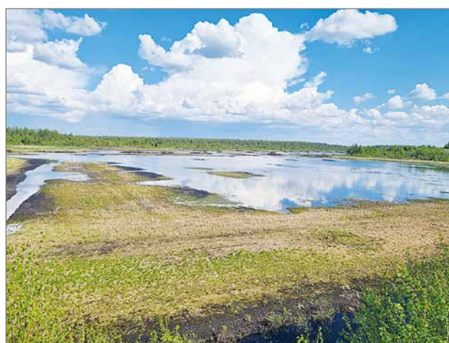
Kuva entisestä turvetuotantoalueesta, johon tulossa kosteikko.

Entisiä turvetuotantoalueita voidaan ennallistaa,