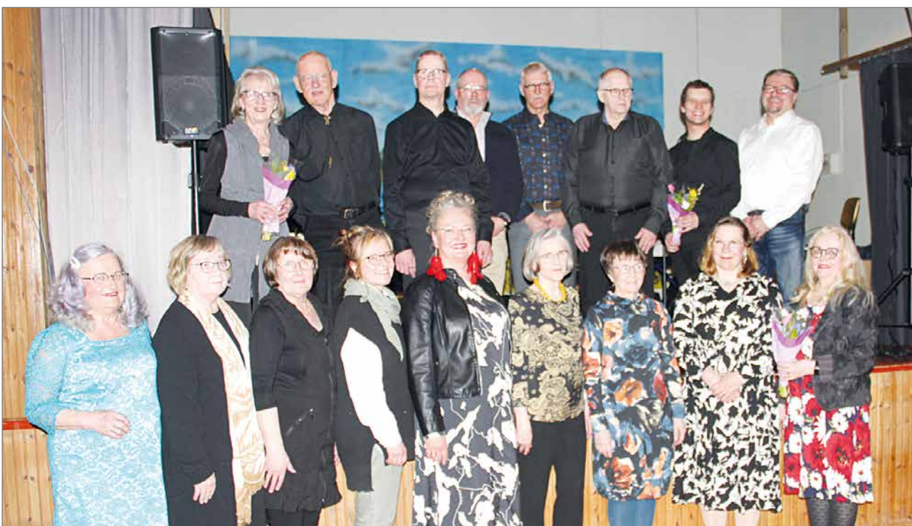
Muusikot ja laulajat yhteiskuvassa.