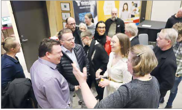
Paneeli kesti tasan kaksi tuntia. Sen jälkeen alkoi vilkas keskustelu ja ajatusten vaihto. Juontajat saivat yleisöltä aplodit ja heille annettiin myönteistä palautetta.