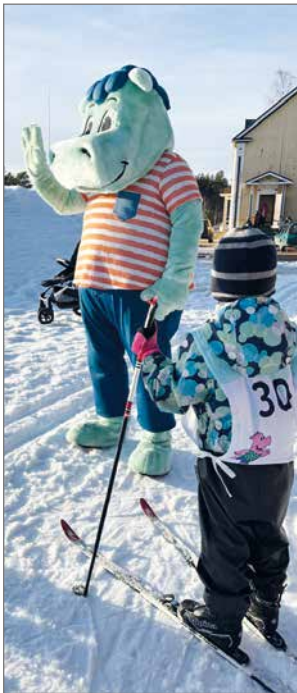
Hille toivottaa tsempejä hiihtäjille.