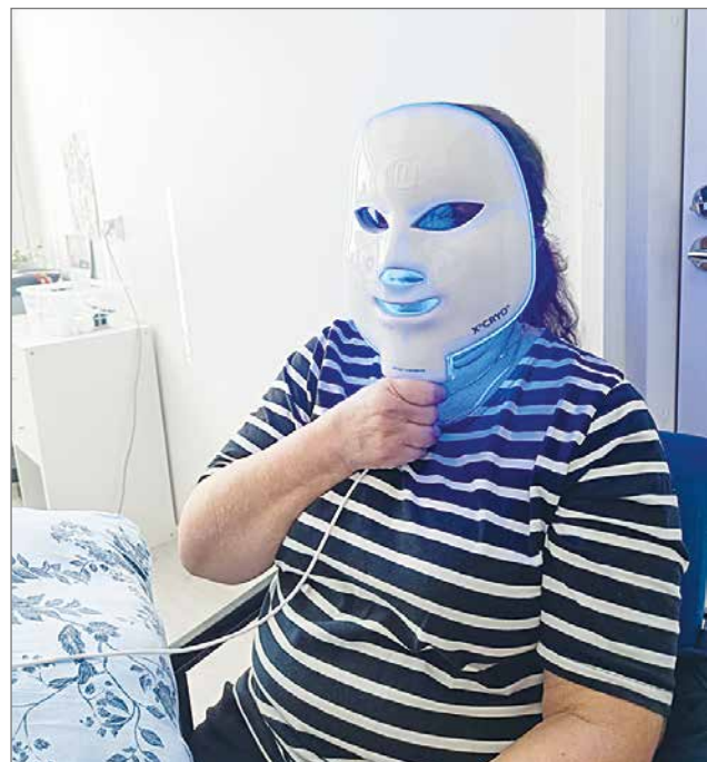
WellSpa-laitteeseen on saatavilla myös viilentävä kasvomaski, jolla on monia käyttötarkoituksia, kuten turvotuksiin, migreeniin ja ihopsoriasiksen hoitoon. Kasvoilla laite tuntuu kuin pakkastuuli nipistelisi poskipäitä.