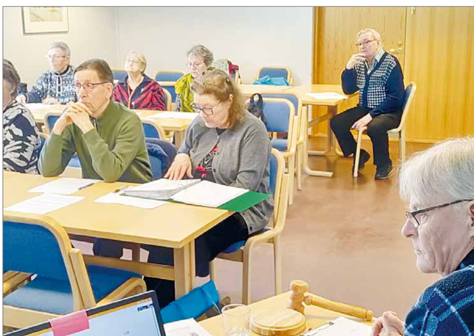
Kevätkokoukseen osallistui 14 henkilöä.