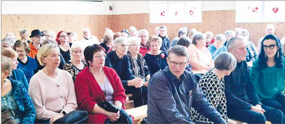
Rakkauslaulu-illassa oli salin täydeltä yleisöä Siuruan Kylätalolla.