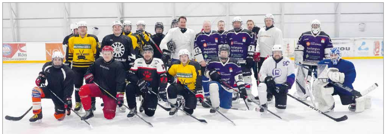
Ennen peliä kokoonnuttiin yhteiskuvaan.