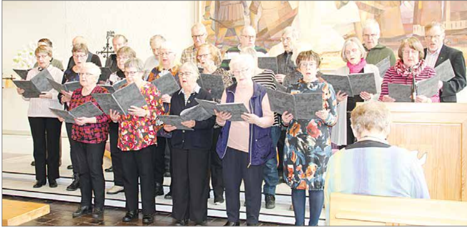
Eläkeliiiton Pudasjärven yhdistyksen Kööri-kuoro.