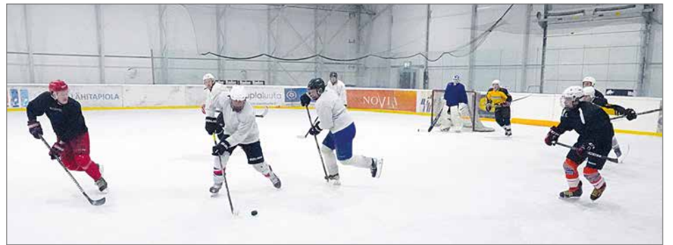
Pudasjärveläisten ja puolankalaisten peli oli vauhdikasta. Molemmat joukkueet pelasivat kahdella kentällisellä ja peli säilyi sitä kautta hyvin intensiivisenä.

Sen verran puolankalaisille on annettu etulyöntiasemaa, että jos Pudasjärveltä tulee paljon pelaajia, haastateltuiltakin oli 11-12, niin puolankalaisilla on periaatteessa etuajo-oikeus jälle.