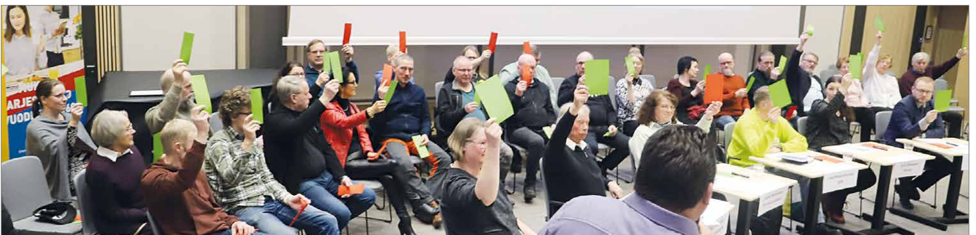
Tuulivoiman lisärakentamista kannatti vihreällä lapulla 25 ehdokasta ja kymmenen ilmaisi punaisella lapulla vastustavansa.