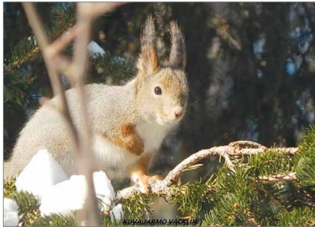
Vaikka orava on siirtynyt myös taajamiin, se on yhä myös erämaisten syrjäseutujen asukki.

Pesä on oravalle erityisen tärkeä paikka talvella. Vaikka orava ei nuku varsinaista talviunta, se viettää kylminä päivinä pesässään pitkiä aikoja. Kovilla pakkasilla ja lu-