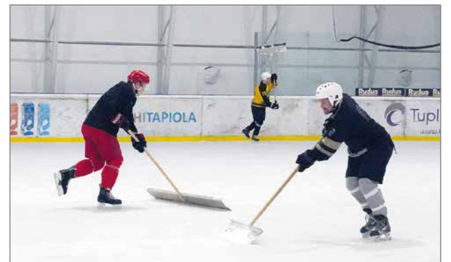
Ennen pelien alkua kaukalo puhdistettiin porukalla hyvässä yhteistyössä kunnan jäädytyslaitteen ollessa poissa käytöstä.

- Sivullisena kun katsoo Puolangan tilannetta, niin täällä on katettua areenaa, joka on töiden loppuunsaattamista vaille valmis, on kehitetty liikuntapuitteita ja Kainuun pelastuslaitoksen uusi halli on vieressä. Vaikka te pidätte itseänne pessimis-