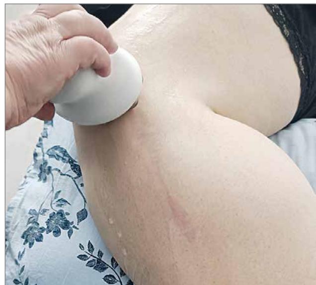
WellSpa-laitteen hieronnassa hyödynnetään kahta seerumia ja kosteuttavaa voidetta. Asiakkaan 12-vuotias leikkausarpi vaaleni hieman jo yhdellä hoitokerralla.