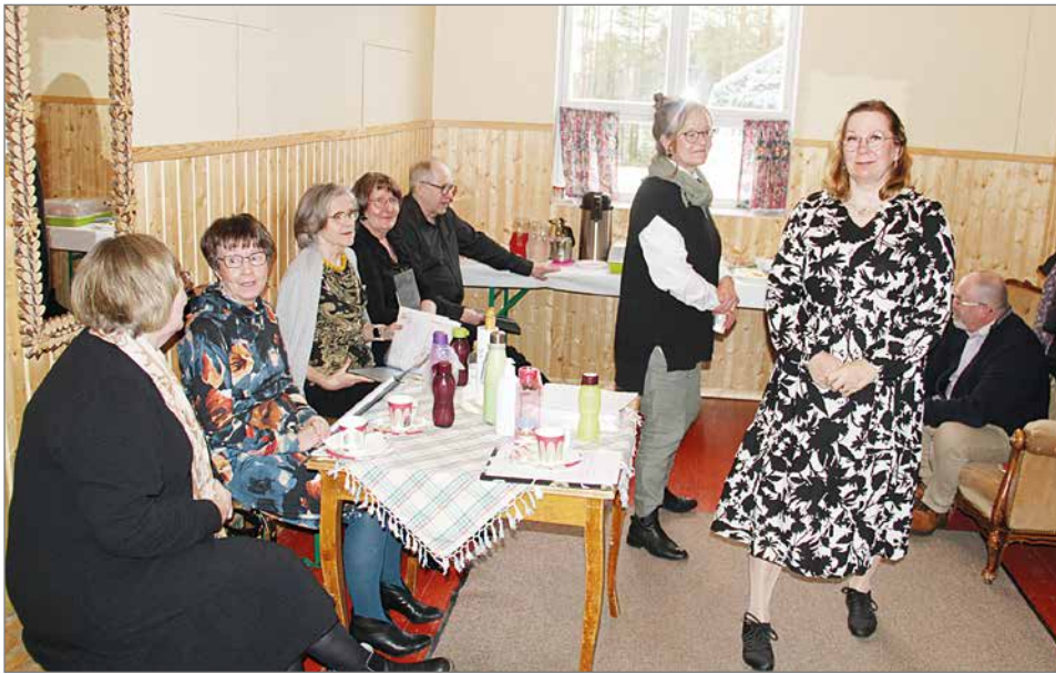
Bäkkärillä oli lämmintä ja terveen kihelmöivää tunnelmaa.