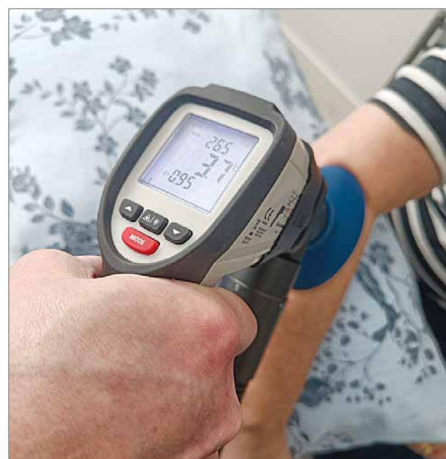
X CRYO-laite kertoo, millainen lämpötila iholla on. Hoito loppuu, kun 0 astetta on saavutettu, sillä ihoa ei ole tarkoitus jäädyttää.

- Piriformiskipuihin tuli helpotus jo yhdellä hoitokerralla, eikä ole tarvinnut enää kahteen viikkoon käyttää öisin särkylääkettä, hän nauraa.