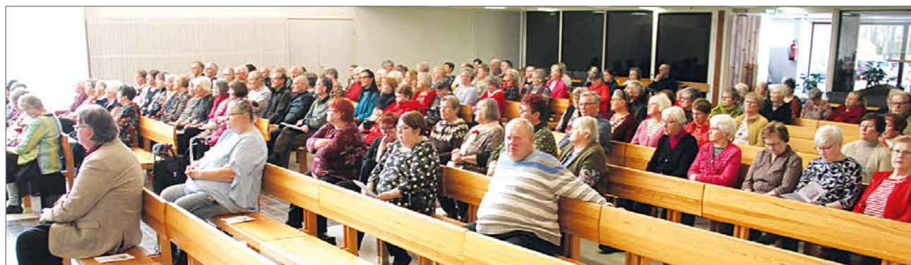
Konsertti veti suuren määrän kuulijoita.