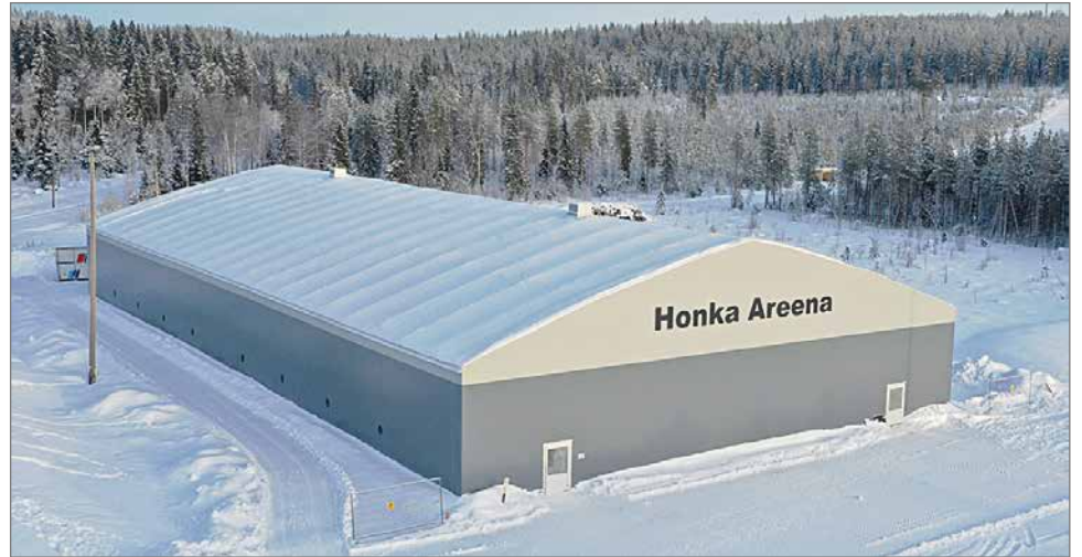
Puolangalla on oma jäähalli, joka Pudasjärvellä on jäänyt vain haaveeksi.

- Me olemme sitten Pudasjärvellä väliinputoajia, mutta jos meillä on siellä niin surkea tilanne, että emme pysty kuin ulkojäällä pelaamaan, niin sitten me tuleme tänne Puolangalle pelaamaan hyvin mielellämme.