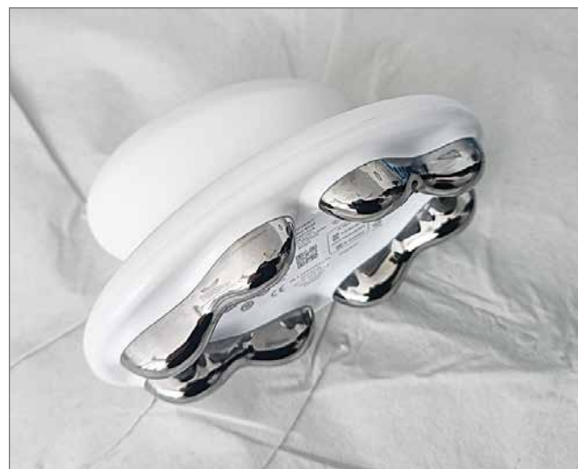
WellSpa-laite hyödyntää mikrovirtaa, älyteknologiaa sekä kevyesti hierovia nystyröitä.