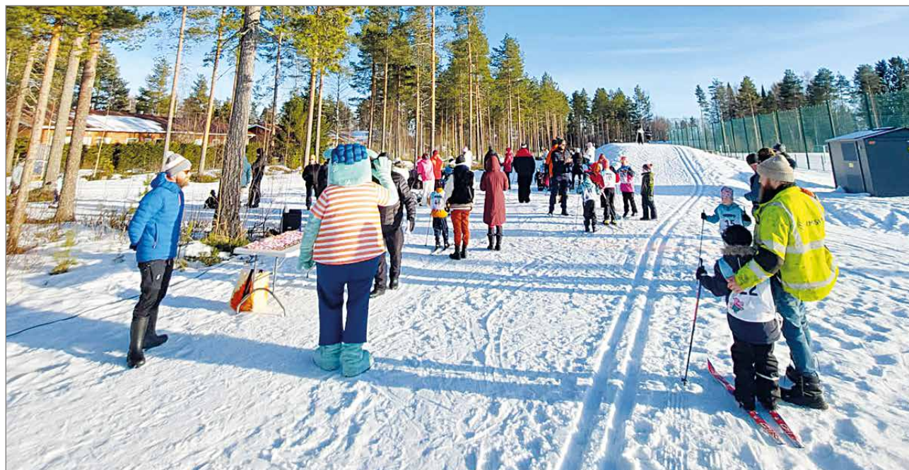
Sää suosi hiihtäjiä.