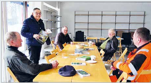
Avajaispäivänä kävi vaalituvalle väkeä pitäjän eri kyläkulmilta.