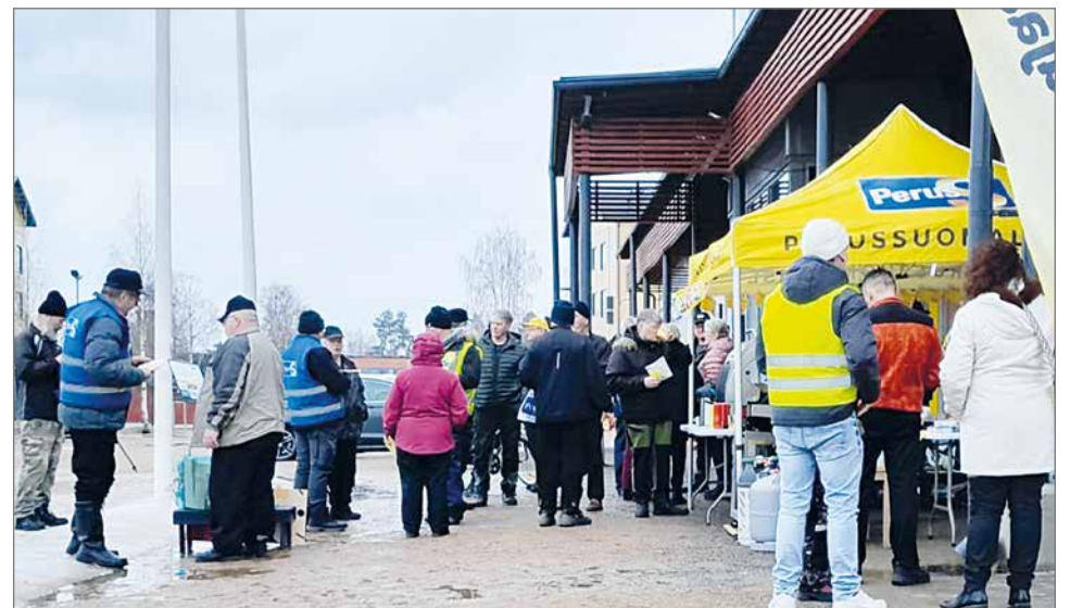
Perussuomalaisien teltalla touhusi kasvat hymyssä porukka, joka kokoontui jo 11.kertaa tällä kuntavaalikiertueella.