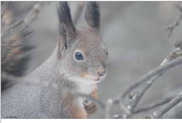
Oravan täytyy olla jatkuvasti valppaana, sillä se kuuluu mörkien petojen ruokalistalle. Talvella sen suurimpia uhkia ovat huuhkaja ja kanahaukka.

mimyrskyillä se saattaa pysytellä pesässä useamman päivän, jolloin syksyllä kerätyt ruokavarastot ovat elintärkeitä.