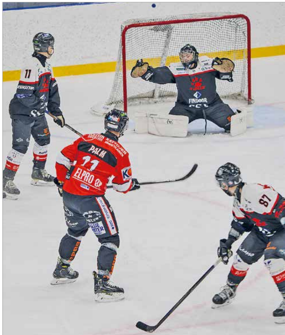
AC Susikädet taisteli tiensä neljän parhaan joukkueen lopputurnaukseen kaukalopallon SM-turnauksissa. Kuva Vierumäellä pelatusta kolmannesta osaturnauksesta.

teellä, TNC 14 pisteellä ja 13 pistettä keränneet AC Susikädet ja BEWE. MTR