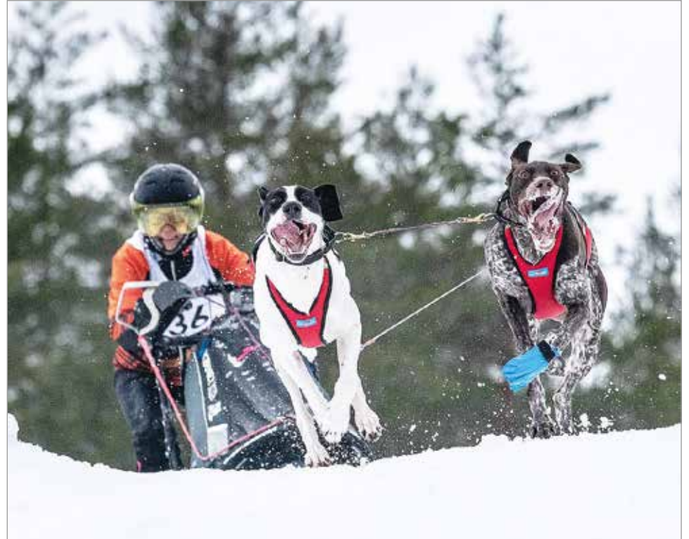
Tammikuussa Jämin SM-kisoissa kahden koiran sprintissä tuli Suomen mestaruus.