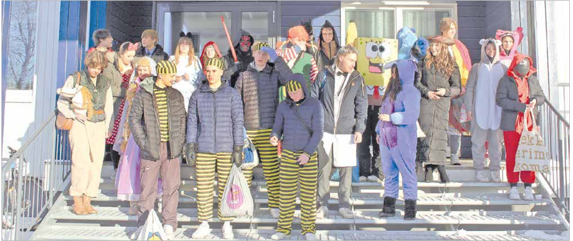
Ennen penkkariajelua abit kokoontuivat yhteiskuvaan koulun portaille.