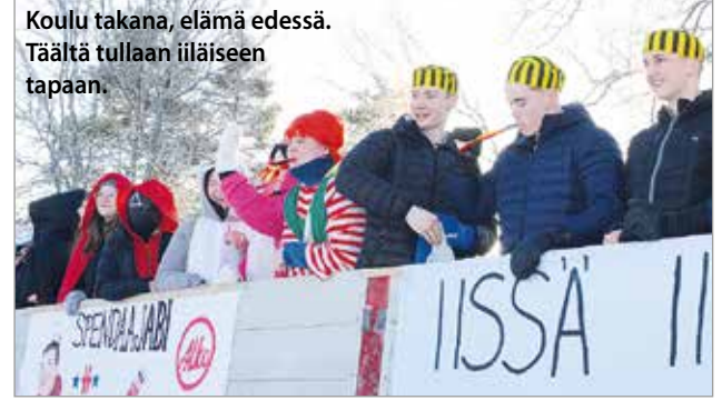
Koulu takana, elämä edessä. Täältä tullaan iiläiseen tapaan.

kuloma, jonka jälkeen vuorossa ovat ylioppilaskirjoitukset. Ensimmäisenä on vuorossa vieraan kielen (lyhyt oppimäärä) kirjoitukset 13.3. Iin lukiossa on tänä keväänä 35 abiturienttia. MTR