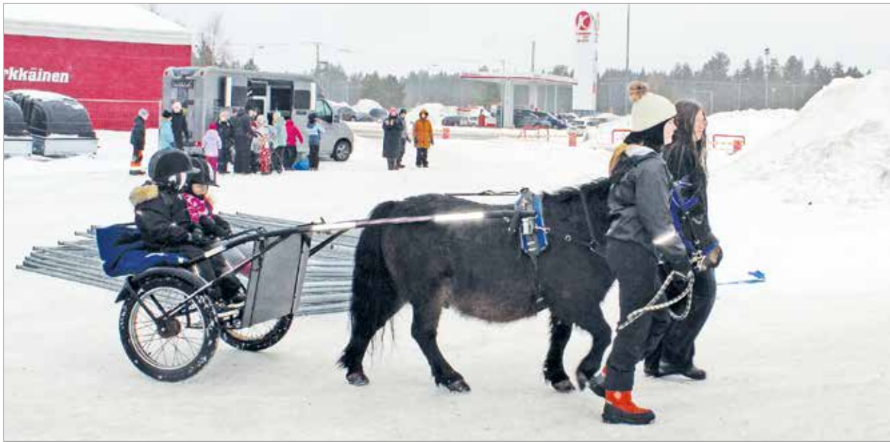
Poniajelu oli yksi päivän vetonautoista.