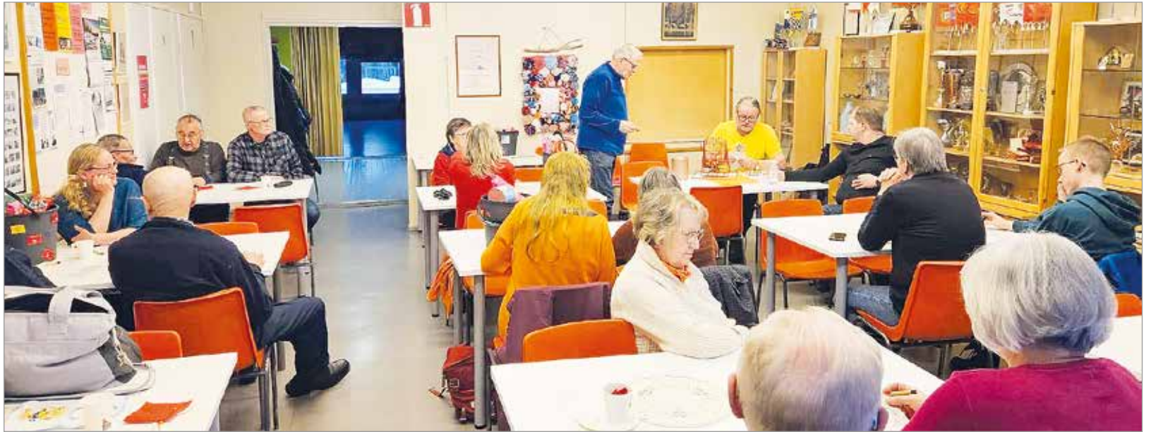
Laskiaisbingotapahtuma keräsi yli 30 osallistujaa vauvasta vaariin, jotka nauttivat yhdessäolosta ja ajankohtaisista keskusteluista.