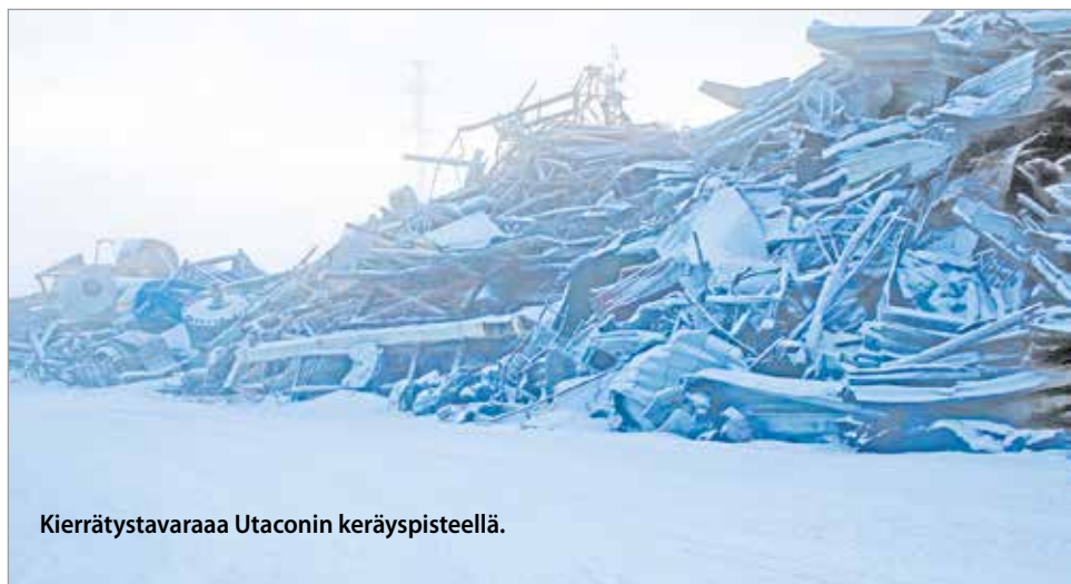
Kierrätystavaraa Utaconin keräyspisteellä.