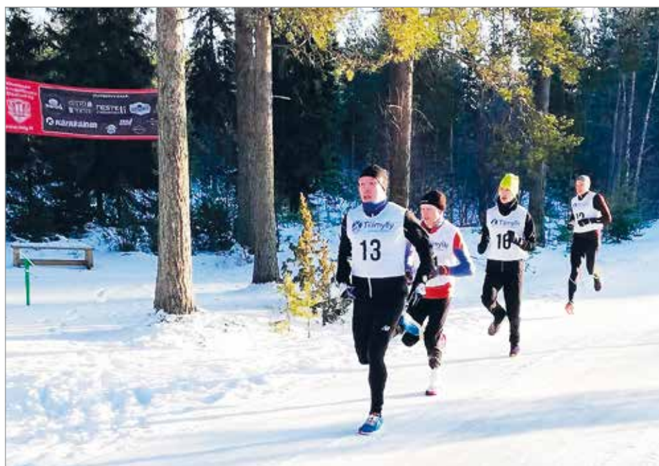
Tällä kertaa testijuoksut juostiin perinteisessä talvissäässä ja tossut pitivät hyvin, saaden neljä miestä painelemaan kymppin alle 40 minuutin.

T13 5 km: 1) Veera Kämä- räinen VaalKa 28.27