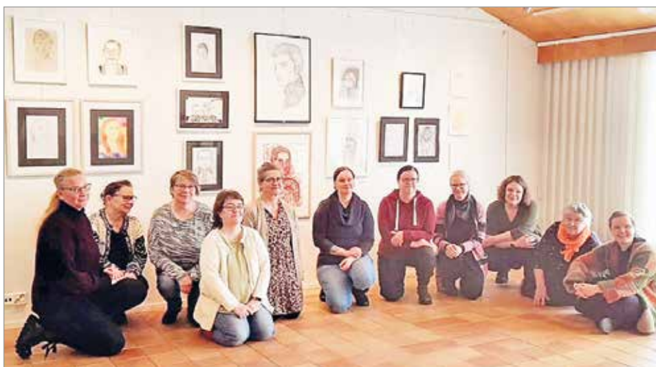
Kahvitellaan ja Kuvataiteillaan ryhmä.