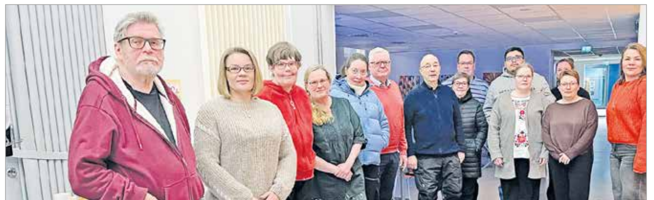
Iin Hamineseudun asukasyhdistys perustettiin Haminan koulun tiloissa pidetyssä perustamiskokouksessa.