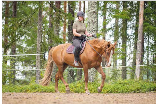
Mahlakaarto tarjoaa muun muassa hevospalveluita, kuten ponikerhoja ja ratsastusvalmennuksia.