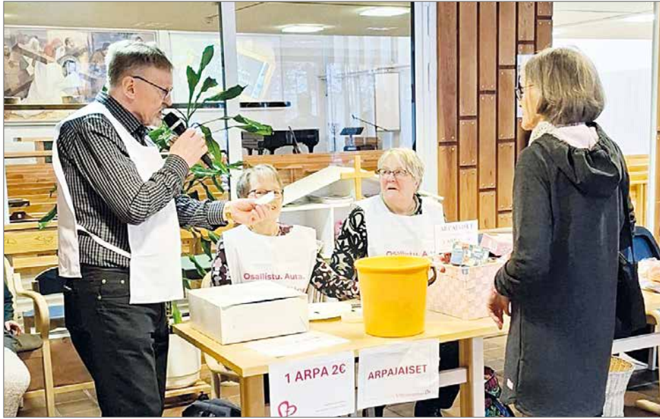
Eläkeliiton Pudasjärven yhdistys järjesti arpajaiset.

Kotiseurakuntamme Yhteisvastuukeräyksen tulos on ollut vuosittain keskimäärin 7000-8000 euroa. Huippuvuosina olemme päässeet yli 10 000 euron summaan. Keräyssummasta saamme 30 prosenttia kotiseurakunnan diakoniatyölle, jonka kautta varat käytetään nuorten hyväksi. Odotettavissa on noin reilun 1000 euron summa, jonka käyttö ja kohde mietitään vuoden 2025 keräysteeman mukaisesti yhteistyössä eri tahojen kanssa. Vuoden 2024 keräyksen kohteena oli myös