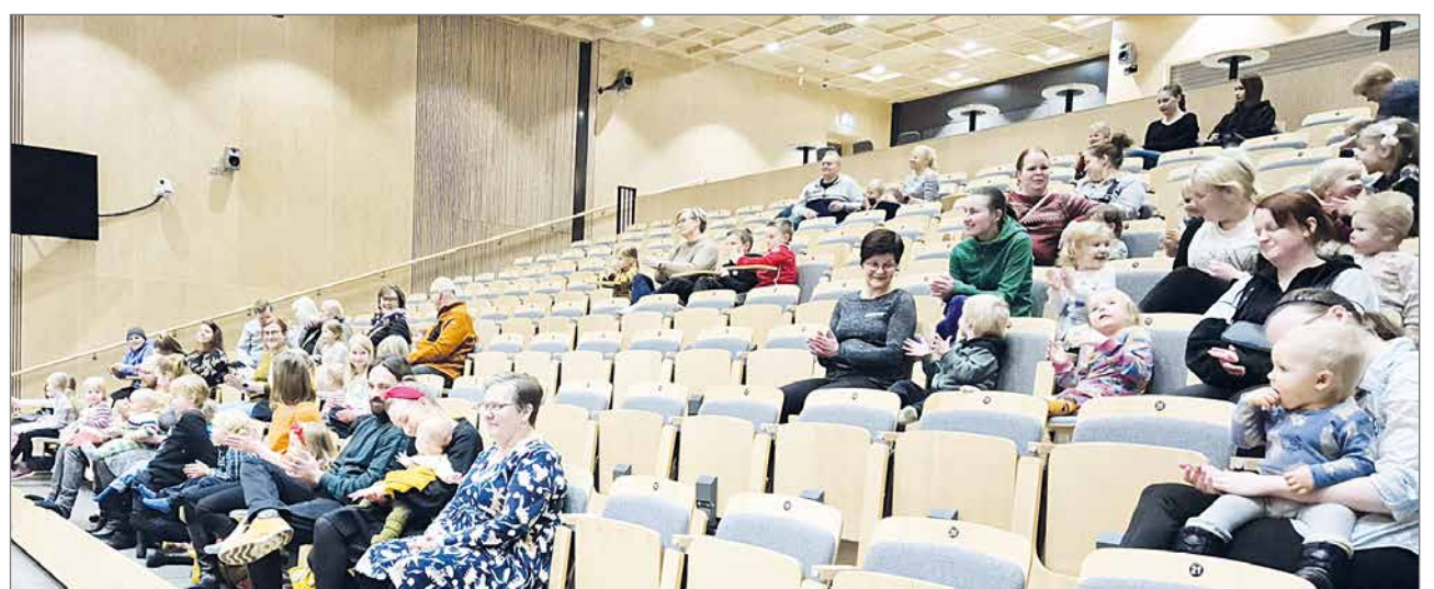
Konserttiin osallistui yli 60 eri-ikäistä kuulijaa mummosta mukulaan ja vaarista vauvaan.