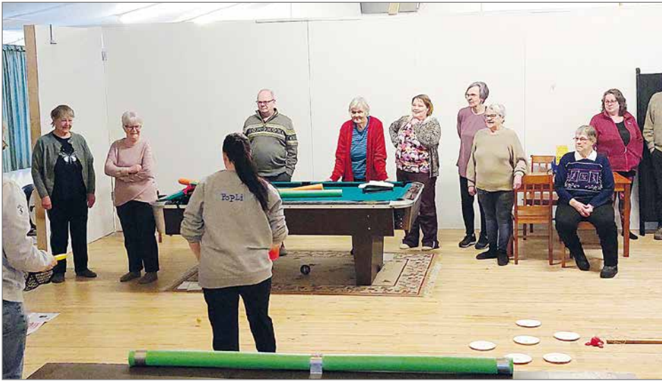
PoPLin edustaja veti Hyvinvointia kylille -tapahtuman osallistujille pelejä kehonhooltoon liittyen.