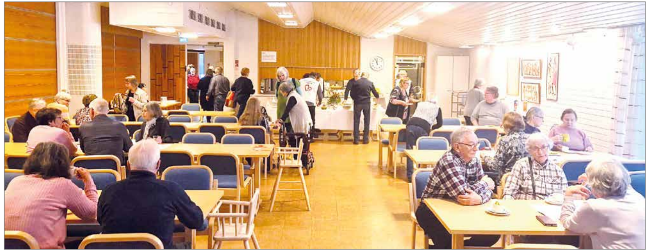
Hernekeittolounaalla ja laskiaispullakahveilla kävi lähes 200 henkeä.