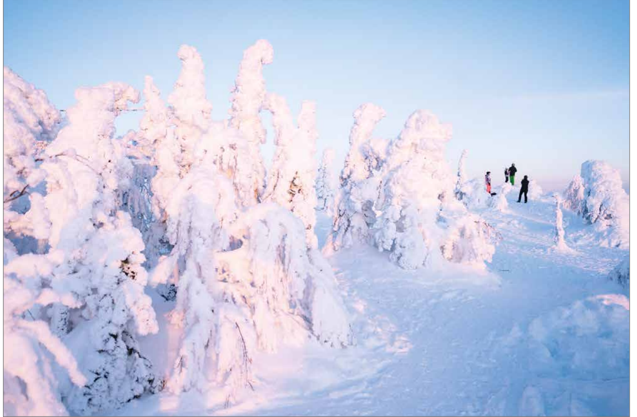
Etelä-Suomen hiihtolomaviikolla keli osui kohdalleen. Ihmiset kerääntyivät nauttimaan tunturimaisemista lasketteluun lomassa.

Hiihtolomaterveisin, Hiihtokeskus Iso-Syöte