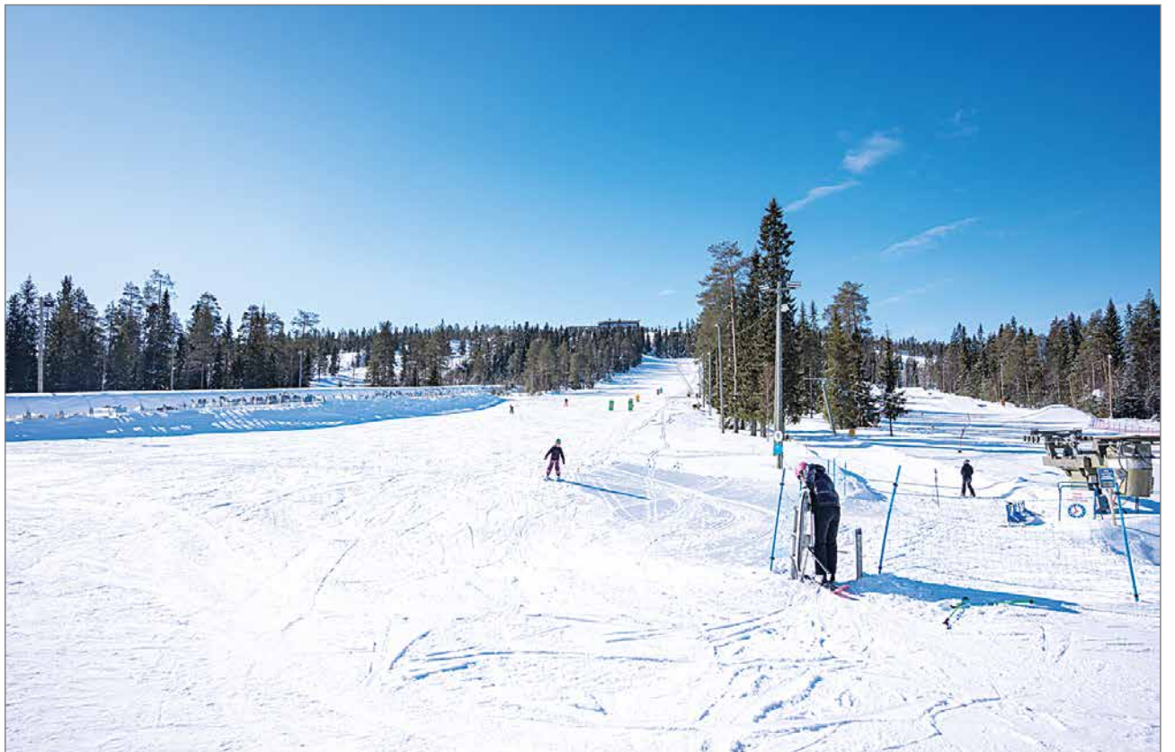
Lumetetuissa rinteissä lunta on 80 sentistä jopa yli kolmeen metriin keväisestä kelistä huolimatta.