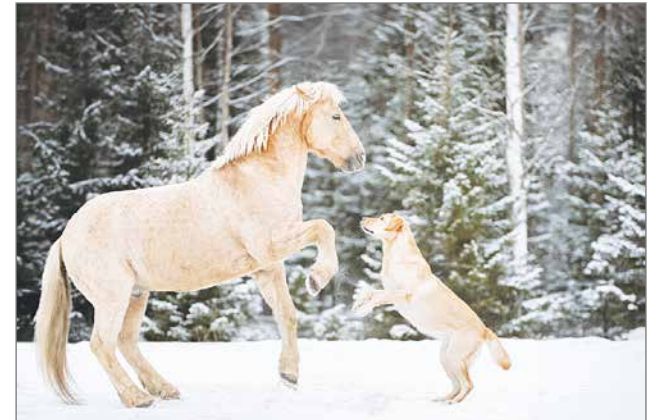
Yrittäjä on erikoistunut myös valokuvaamiseen, muun muassa lemmikkikuvat onnistuvat. Kuvassa Kamu sekä asiakkaan koira.

sa sosiaalipedagoginen hevostoiminta on yksi esimerkki palveluista, jotka voisivat parantaa hyvinvointia.