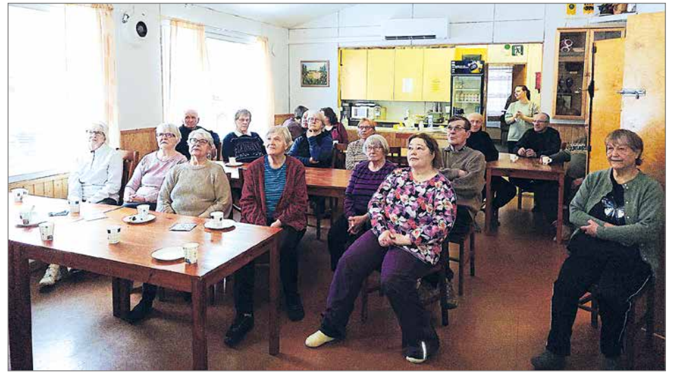
Möykkälään kokoontui 19 henkilöä kuuntelemaan tunnin mittaista muistiteemaista luentoa.