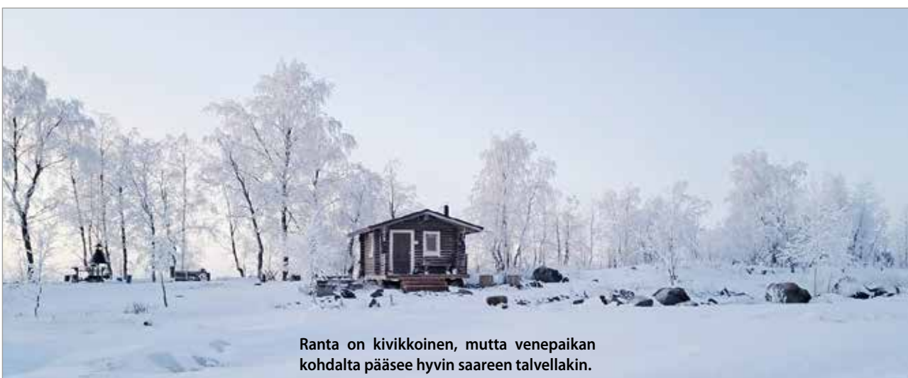
Ranta on kivikkoinen, mutta venepaikan kohdalta pääsee hyvin saareen talvellakin.