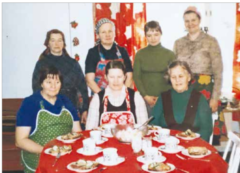
1980-luvulla opeteltiin voileipäkakkujen tekoa yhdessä.