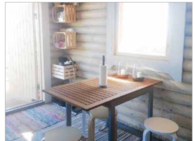
Tervetuloa tupaan kalastajat, veneilijät ja retkeilijät!