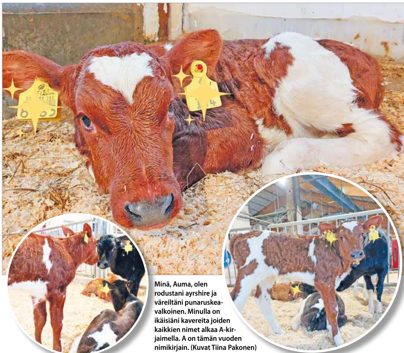
Minä, Auma, olen rodustani ayrshire ja väreiltäni punaruskea-vaikoinen. Minulla on ikäisiäni kavereita joiden kaikkien nimet alkaa A-kirjaimella. A on tämän vuoden nimikirjain.