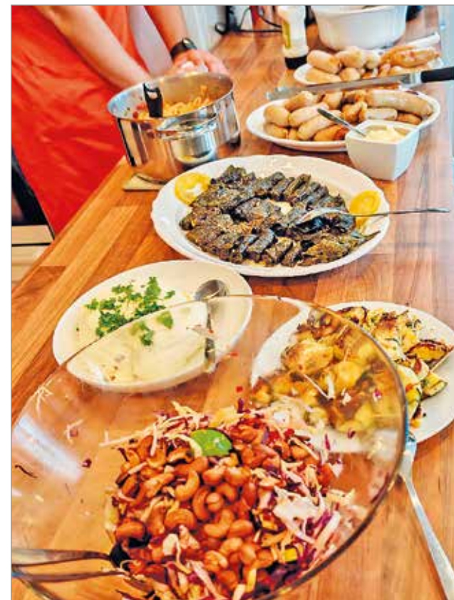
Makkarakurssilla valmistettiin makkaroita lisukkeineen.