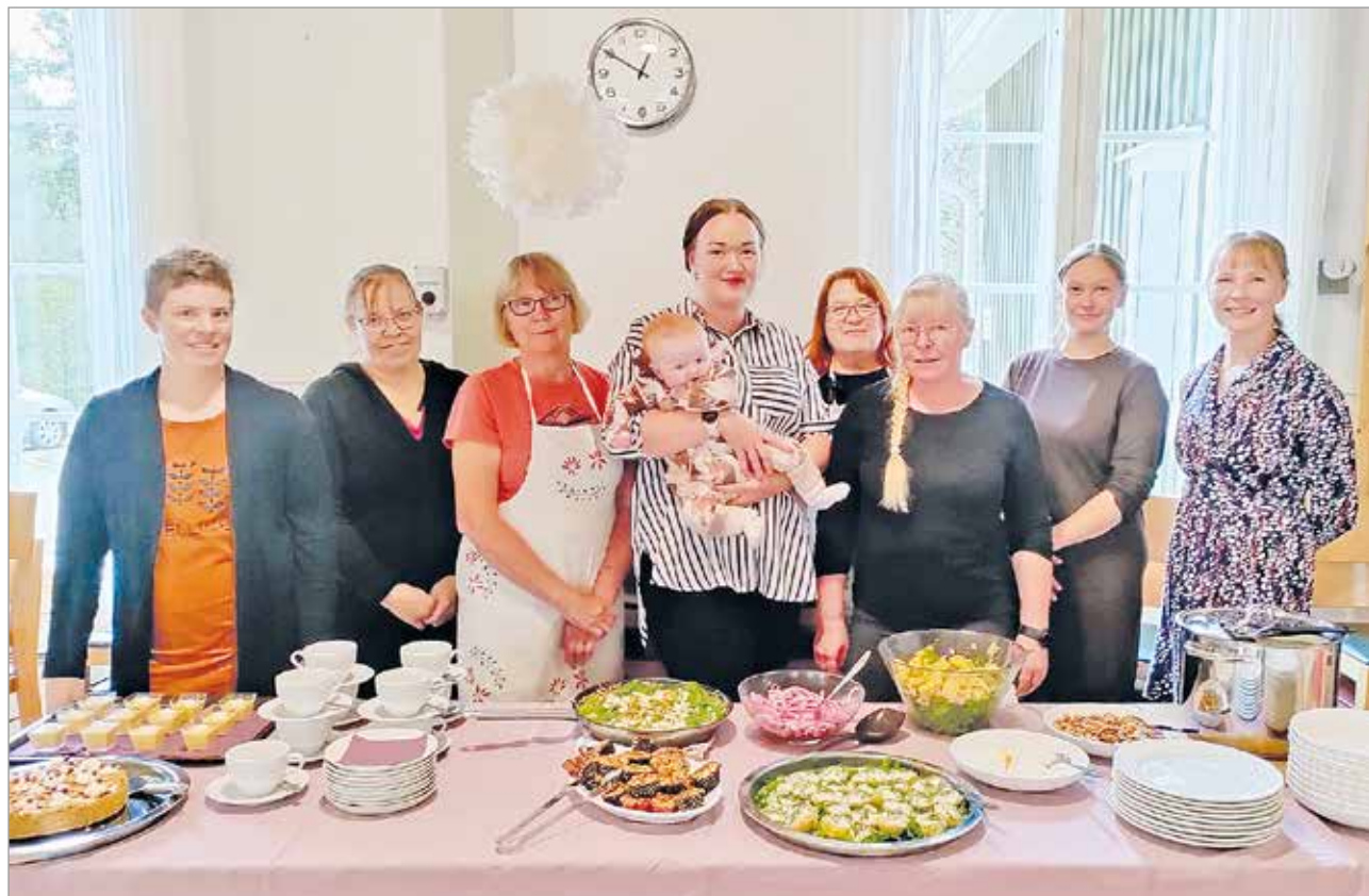
Brunssikurssin herkkuja.