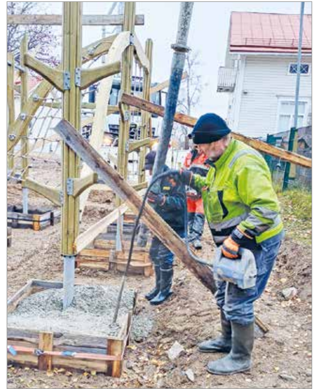
Muotit valettiin pystytyksen jälkeen.

Tälle vuodelle on koulun mäkeen suunnitella yhteistyössä Iin kunnan kanssa kuntoportaat talkoilla toteutettuna. Myös kyläkummitoiminta starttaa alueella. Toiveissa on lisäksi kevyen liikenteen kulkureitti Seljänperän ja Olhavan kylän välille.