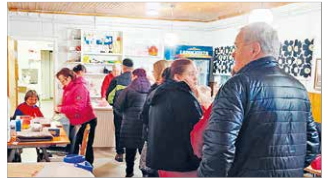
Kuivaniemen Seuran bingoihin saapuu aina runsaasti väkeä.