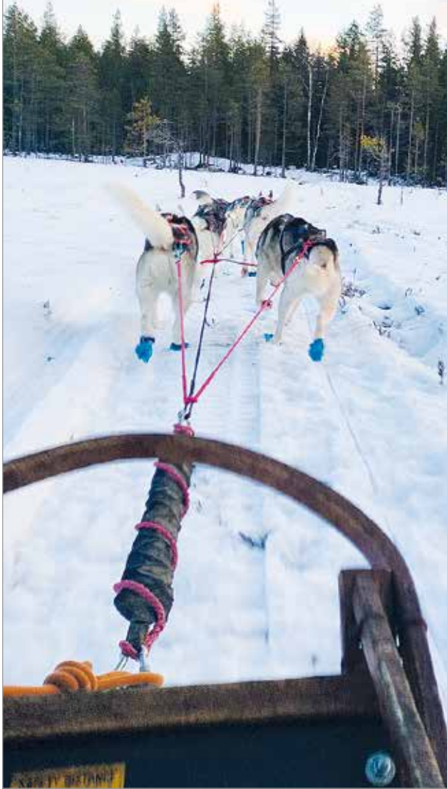
Koiravaljakolla käytiin Pirttijärven kodalla.

Suuri osa ulkomaisista matkailijoista on rauhaa hakevia matkailijoita, vain tarvittaessa heille on järjestetty ohjelmaa. Ohjelmapalveluille Iin seudulla olisi tarvetta, majoittajia on useita. Poro- ja koiravaljakko ajelut ovat kysytyimpiä.