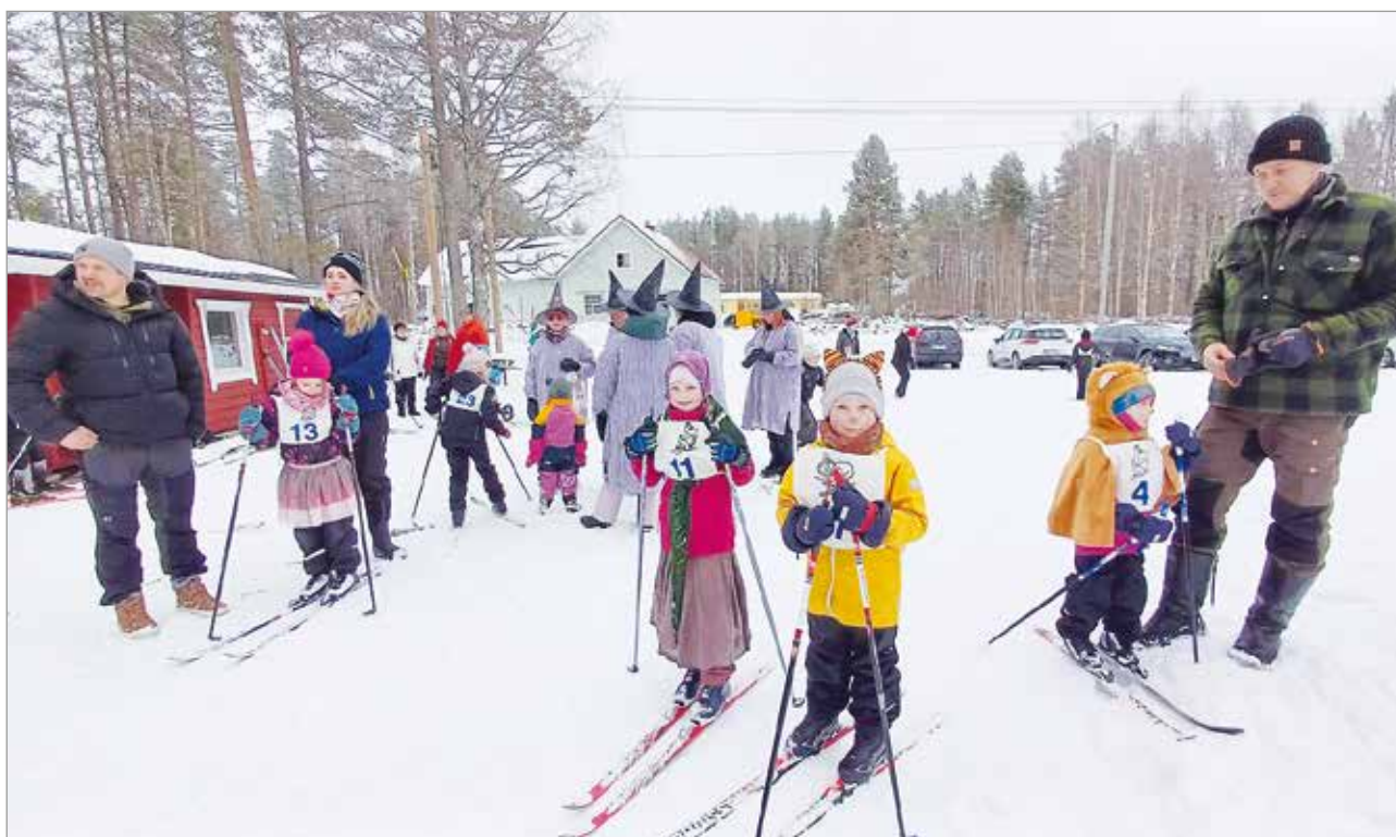
Lasten sprinttihiihtokilpailujen asujen kirjoa.