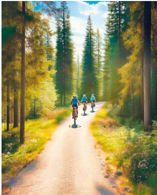
Mallinen unelmien maisemapyörätiestä kesällä.