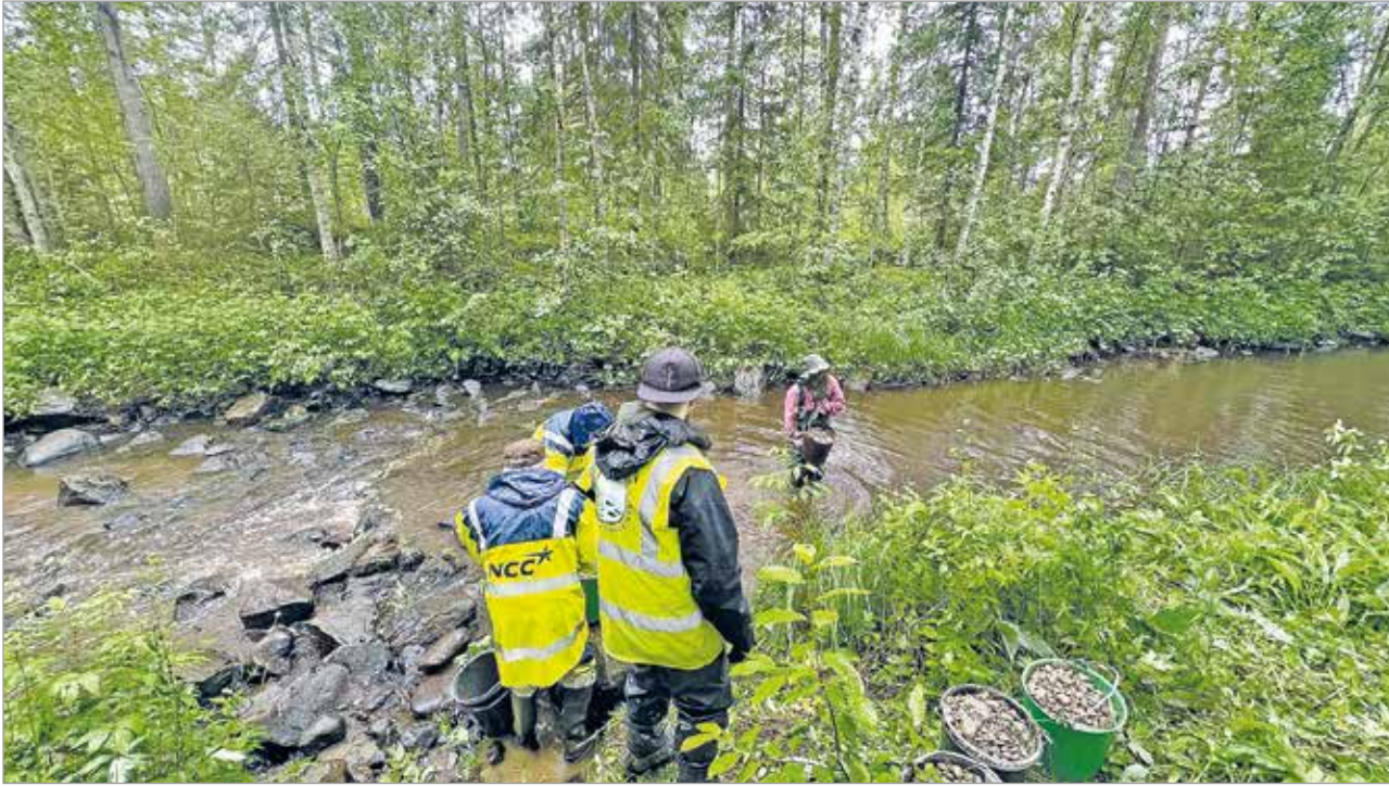
Kiviämpäri kiviämpäriin perään kutosorakko valmistui. (Kuva Jari Laakso)

Luonnosta ja erityisesti ranta-alueista pääsee Olhavan seudulla ensi kesänä nauttimaan uudella tavalla, sillä kehittämissyhdistys hankki Iin kunnan hyvinvointiavustuksen avulla kylälaisten käyttöön kaksi sup-lautaa. Näitä saa lainata ilmaiseksi jatkossa, joten meren, jokien ja järvien luonto tulee aidosti kaikkien kylälaisten saavutettavaksi.