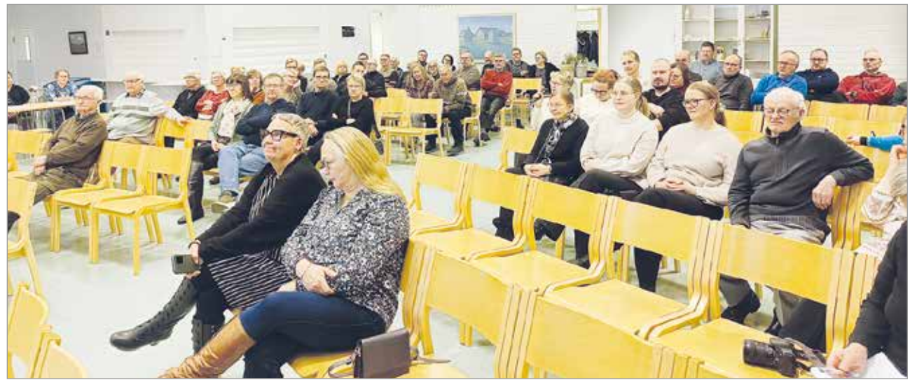
Jakkukylän kyläillan kokoukseen osallistui lähes 70 henkinen porukka kuulemaan ja keskustelemaan kylän historiasta.