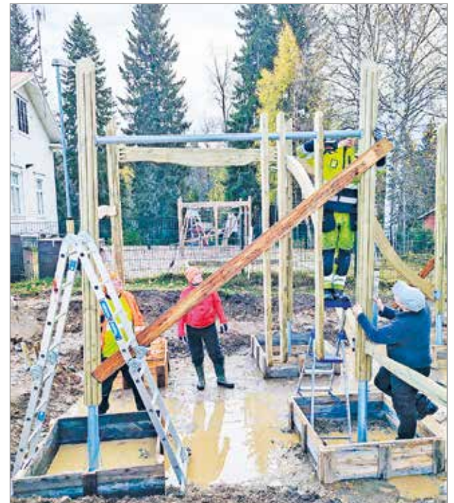
Pystytystiimi työn touhussa. Tässä vaiheessa todettiin tarve myös salaojalle.