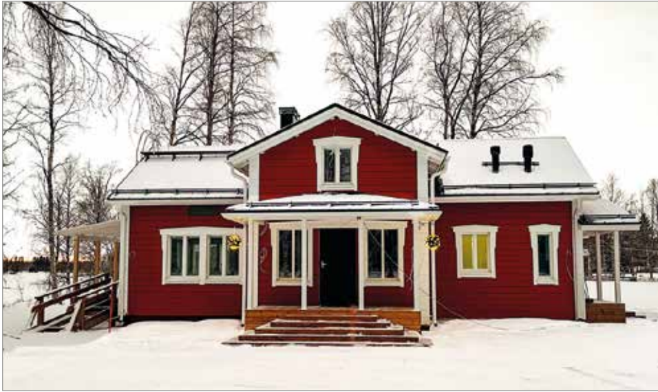
Kahvila & Kauppa Olhavan Paussin ovet aukeavat kevään aikana.