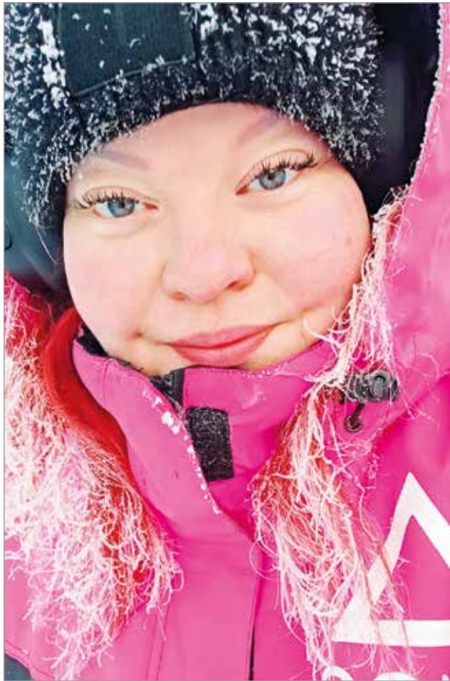
"Me tarvitaan toisiamme, koska yhdessä olemme enemmän."