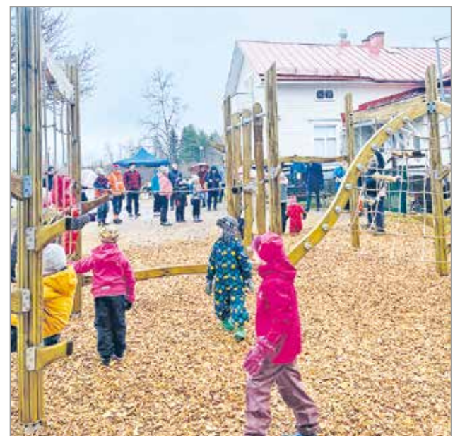
Pöllimetsässä riitti vilskettä.