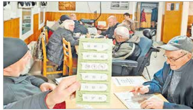
Juhlabingon päävoiton oikeat numerot.