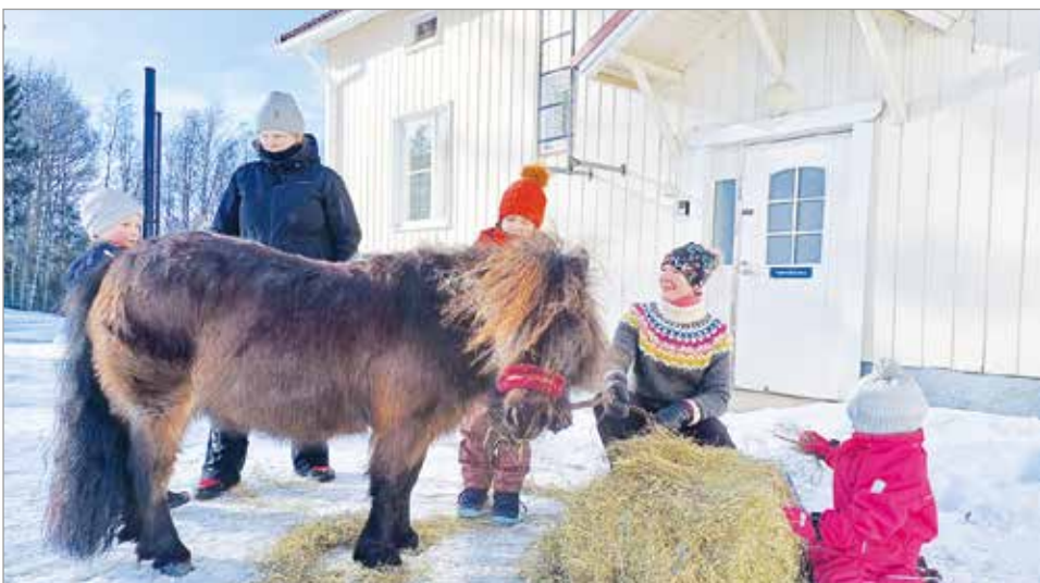
Olhavalaiset perheet osallistuvat aktiivisesti Tenavatuvan toimintaan. Keväällä vanhemmat järjestivät lapsille ponijälun ja makkaranpaistoa.

Anne Haataja Varhaiskasvatuksen opettaja Päiväkoti Tenavatupa