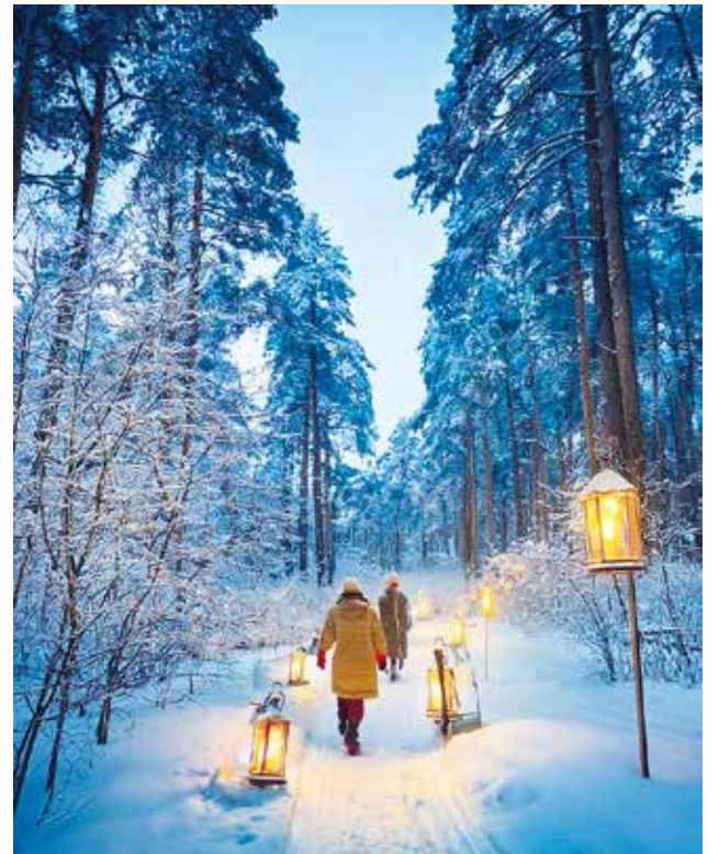
Mallinen unelmien maisemapyörätiestä joulun aikaan.