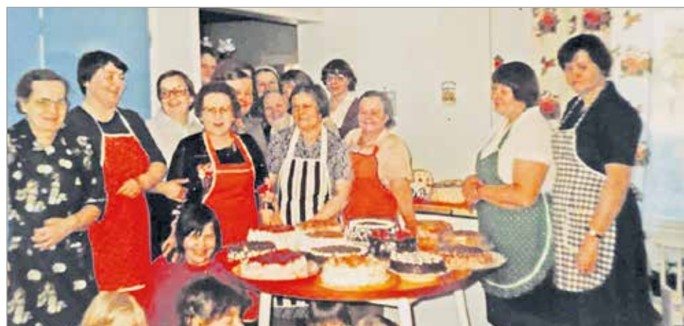
Maa- ja kotitalousnaisten kakkukurssi vuonna 1982.