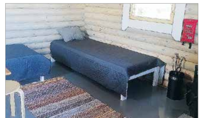
Kahden petipaikan lisäksi saa lattialle lisäpetejä