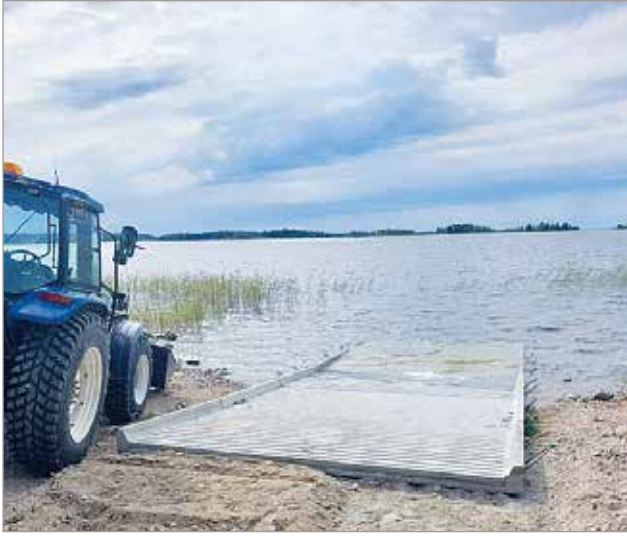
Seppo Tapio kunnostaa veneluiskien ympäristöä.