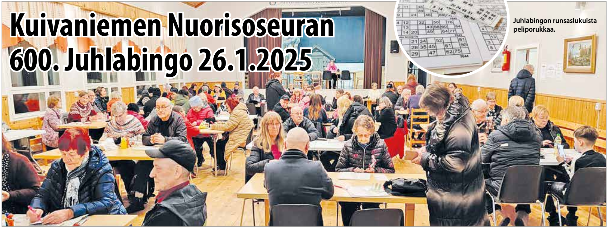
Juhlabingon runsaslukuista peliporukkaa.

Kuivaniemen Nuorisoseuralla oli juhlatunnelmaa, kun 26.1.-25 aloiteltiin Nuorisoseuran kuudettasadannetta bingoa. Bingoa oli tullut pelaamaan reilut 120 osallistujaa ja sali täyttyi nopeasti.