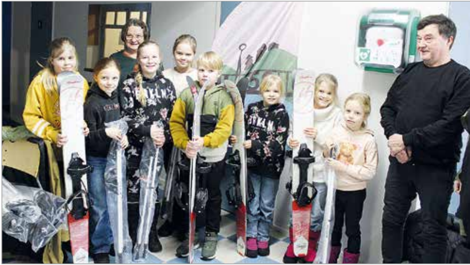
Aktiivisimman liikkuneen kylän, Kuivaniemen Jokikylän, edustajat pokkasivat kyläläisten käyttöön neljä paria liukulumikenkiä ja sauvoja.

liikuttuina tunteina asukasta kohti ja ne kirjattiin pilotihankkeena kokeillun puhelinsovelluksen kautta. Kisa oli äärimmäisen tiukka Kuivaniemen Jokikylän kyläyhdistyksen ja Jakkukylän kyläyhdistyksen päättyessä lähes tasatulokseen. Jokikylässä liikutettiin kampanja-aikana 24,98 tuntia/asukas ja Jakkukylässä 24,88 tuntia/asukas. Kolmanneksi eniten liikkunut kylä oli Iin Aseman ja Ylirannan seutu 17,13 tuntia/asukas. kampanja-aika oli 19.9.-31.12.2024. MTR