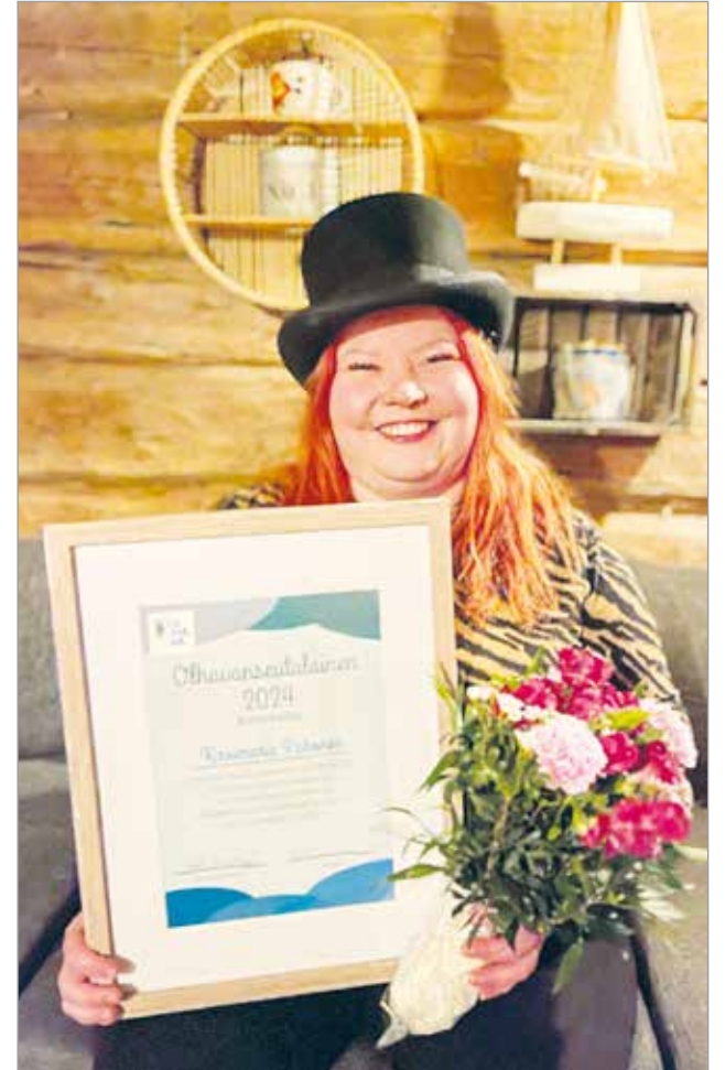
Vuoden 2024 Olhavanseutulaisessa, Kirsimariassa tiivistyy kaikki ominaisuudet sellaiseksi paketiksi, että siinä ei ole risut, eikä mäännökyt tiellä, kun pistetään tuulemaan.

Kirsimariassa tiivistyy kaikki yllä oleva sellaiseksi paketiksi, että siinä ei ole risut, eikä mäännökyt tiel-