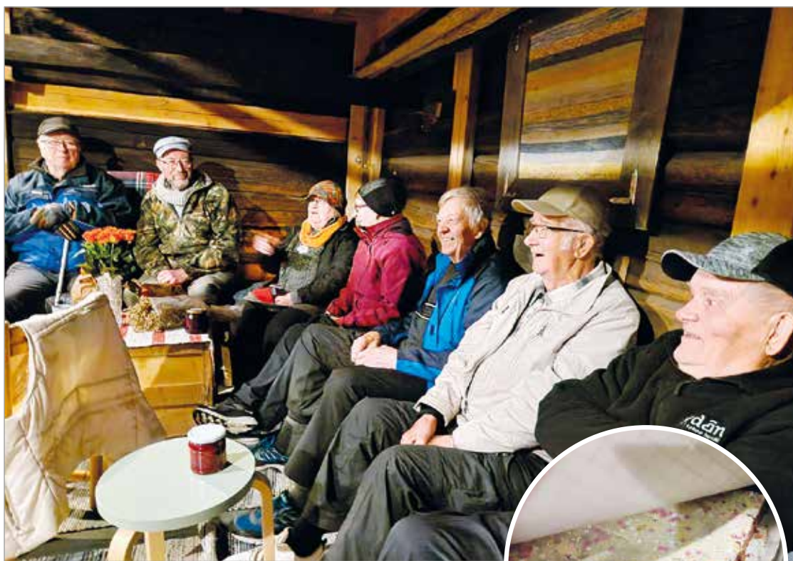
Kekri veti ilmeet iloisiksi.