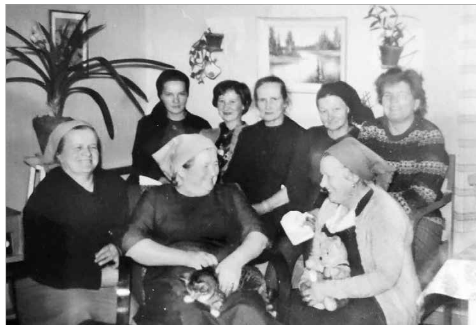
Naisosasto koolla 1960-luvulla Kärppäsuolla Haapakankaassa.