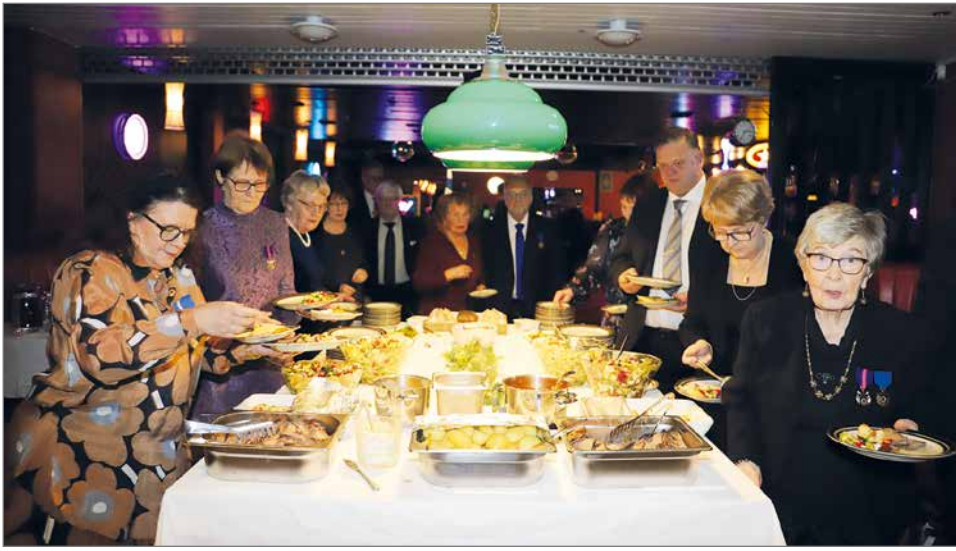
Juhla aloitettiin juhlaruokailulla, jonka oli lointinut Kakku ja Pitopalvelu Vengasaho.