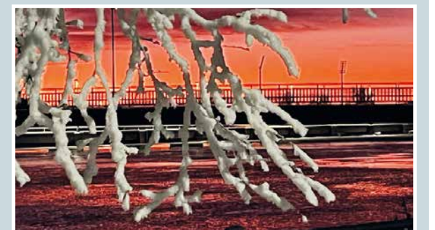
Talvi-illan taikaa.

Martti Kähkönen lukijoiden palaute ja jutut: vkkmedia.fi