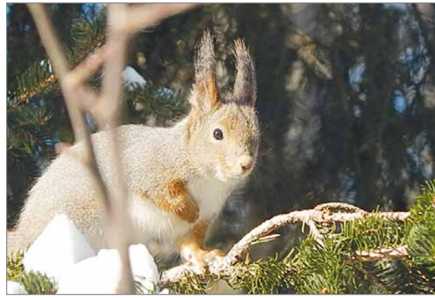
Osa vanhojen metsien lajeista, kuten orava, on sopeutunut myös asustelemaan talousmetsissä. Tosin luonnonkoloita on oravallakin pulaa. Jos orava löytää sopivan kolon, se muuttaa sinne mielellään asumaan risupesän sijaan.

Talouksmetsistä korjataan lähes kaikki lahoppu pois, tai sitä ei edes kerkeä syntymään, jos metsiä hakataan