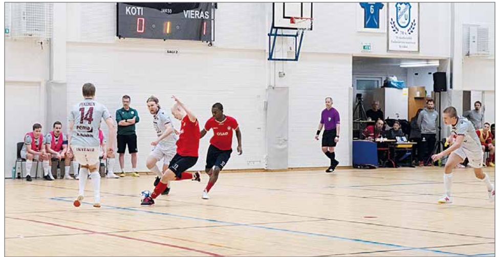
Kurenpoikien ja Alastalon Urheilijoiden ottelussa riitti paljon tapahtumia heti alusta alkaen.

raiden yrittäessä lentävän maalivahdin avulla kaven- nusta. Kurenpojat esitti jäl- leen hyvää, kollektiivista puolustamista ja oli selkeä- ti lukenut vieraiden pelikir- jan jättäen AUn lopulta aika