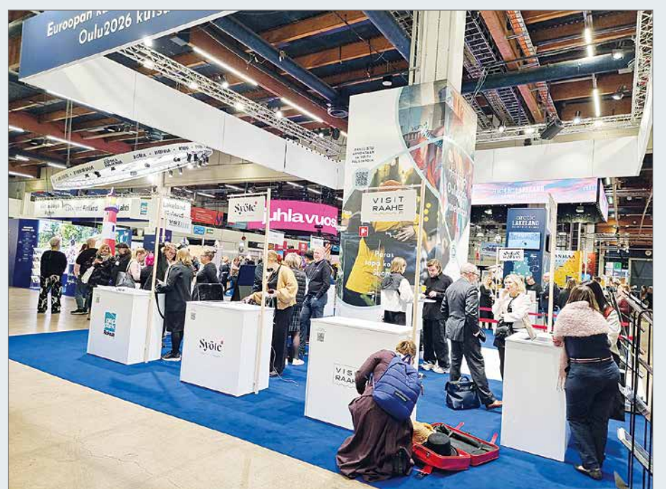
Messuosasto mahdollistettiin yhteistyössä Visit Oulun kanssa osana Pohjolan Rengastie -seutu-yhteistyötä.