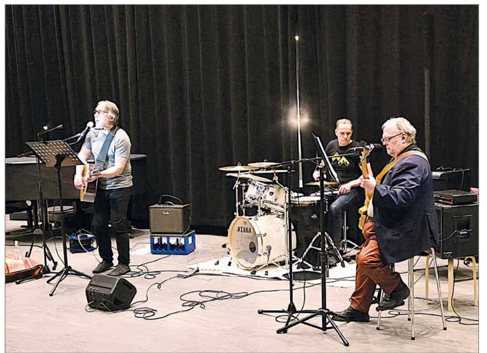
Vauhko Varsan tammikuun esiintyminen Kurkisalissa on tullut jo perinteeksi.

Yleisö tuntui ja näy- ti olevan mukavasti muka- na. Laulujen välillä jutus- teltiin ja naurettiin yhdessä yleisön kanssa. Kerroin vä- lillä lauluista ja niiden taut- toista. Loppupuolella settiä laulettiin jo yhdessä koko salin voimin. Yleisön muka- na olo antaa aina hyvää li- säpotkua. Aika kului siivil- lä. Pian oli varsinaisen setin viimeinen laulu laulettu.