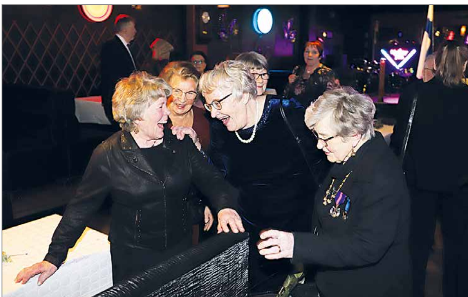
Hilimojen toimintaa tehdään iloisella mielellä, kuten kuvakin osoittaa.