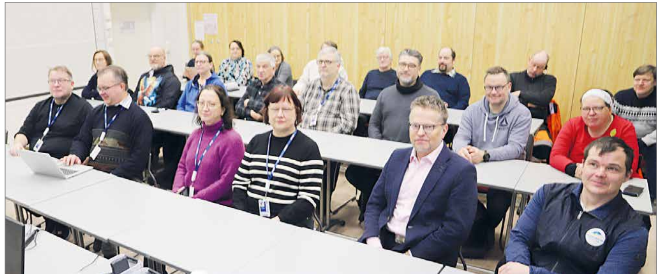
Vuoden ensimmäisille Yrittäjien aamukahveille osallistui 25 henkilöä.