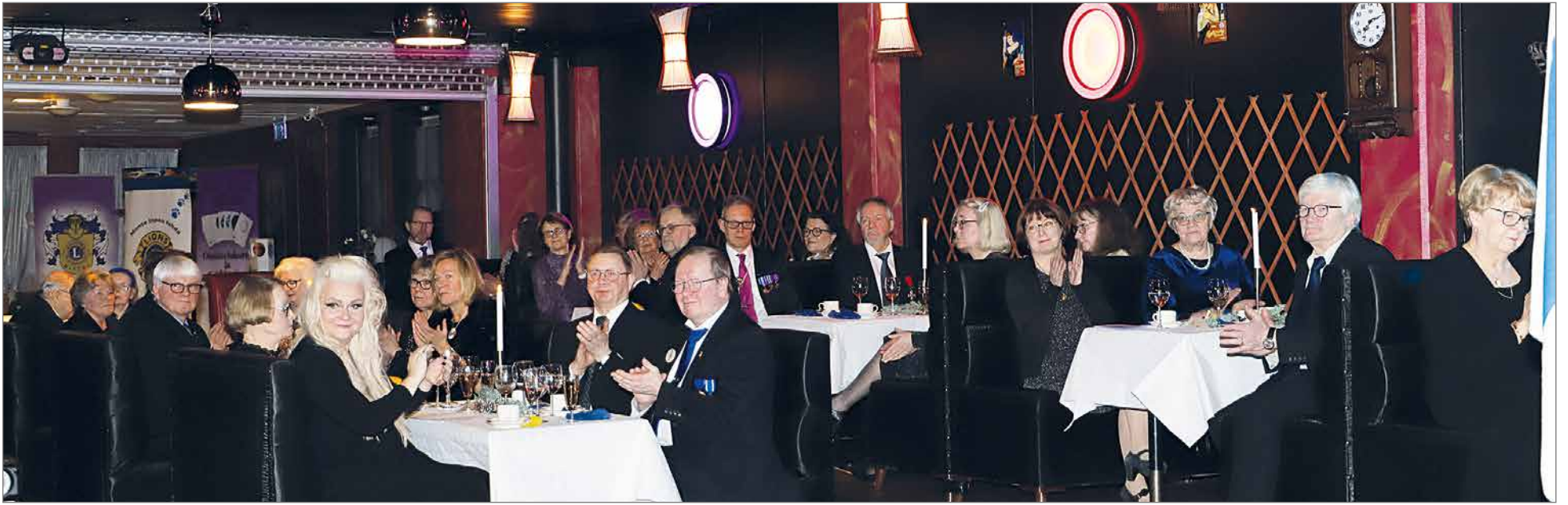
Juhlaan osallistui 45 kutsuvierasta.