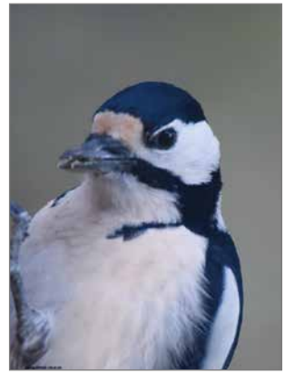
Tikat ovat hyvin riippuvaisia hyönteisistä ja niiden toukista. Sitä mukaa kun metsät nuortuvat, myös lahoppuun määrä vähenee. Etenkin tikkojen poikaset tarvitsevat hyönteisravintoa, jota löytyy varsinkin vanhoista haavoista.

Monet hyönteiset käyttävät puiden koloja myös hyödyksi. Tuttua on nähdä ampiispesä puun kolossa. Toisinaan puiden koloi-