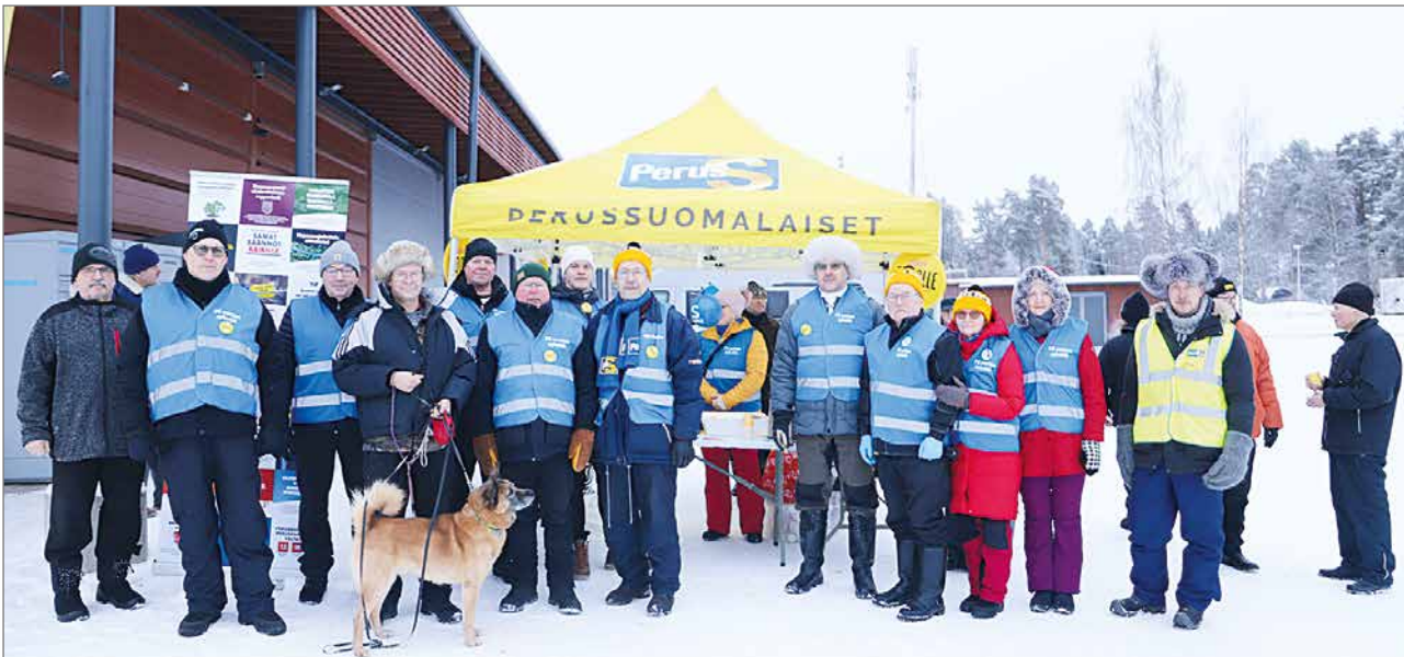
Telttatapahtumassa S-marketin pihalla oli uusia ja nykyisiä luottamustehtäviin valittuja alue- ja kuntavaaliehdokkaiksi asettuneita henkilöitä.