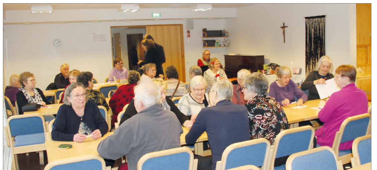
Yhdistyksen ensimmäisessä kerhossa oli iloista jälleennäkemisen porinaa.

Helmikuun kerhotapaaminen on torstaina 13.2. kello 14 alkaen seurakuntakeskuksen rippikoulusalissa, maaliskuun 13. päivä on vuorossa Kevätkokous