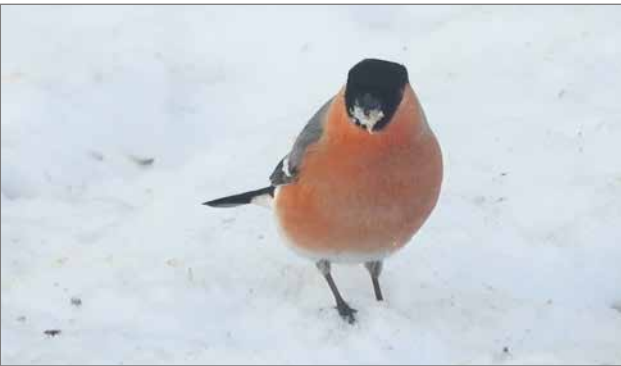
Punatulkkuja voi pitää parvilintuna koska suurimman osan vuodesta laji viihtyy pienemmissä tai suuremmissa parvissa. Parvissa ollessaankin koiras ja naaras viettävät talven yhdessä.

Ilmaston lämpeneminen tulee varmasti hyödyttämään punatulkkuja. Tämä on nähtävissä kannan voimistuessa pohjoisessa. Eteläisessä Suomessa punatulkku tekee kesän aikana usein kaksikin poikuetta, toisinaan kolme. Mikäli Lapissa ilmasto lämpenee voimakkaasti ja lumeton aika pidentyy, pystyy punatulkku tekemään entistä useammin kaksi tai kolme poikuetta kesän aikana. Lämpeneminen aiheuttaa myös havupuiden pohjoisrajan siirtymisen