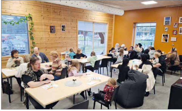
Pirtin nuorisotilat soveltuvat hyvin myös iltakahvilan pitämiseen.

Tapahtumailat järjestää yhteistyössä Work & Stay -hanke, SPR Pudasjärven