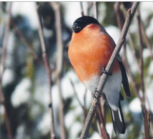
Punatulkku osaa käyttää hyödyksi monenlaista luonnotta löytyvää ravintoa kuten katajanmarjoja, pihlajanmarjoja, sekä lehtipuista löytyviä siemeniä.

ylemmäksi tunturiseuduilla. Tämän myötä punatulkku tulee entisestään runsastumaan pesäpaikkojen lisääntyessä.