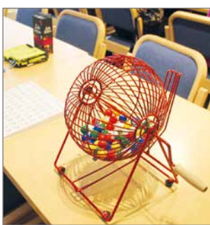
Pitkästä aikaa ohjelmistoon kuului myös bingon pelaaminen.