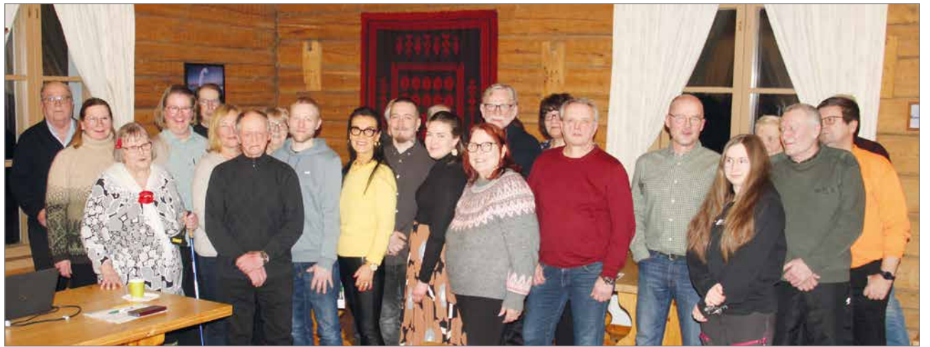
Liepeen pappilan Väentupaan oli torstai-iltana kokoontunut 35 kuulijaa.

Keskustan tavoitteena on taata lasten ja nuorten tasa-arvoisen koulutautumisen sekä varmistaa kaikkien kuntalaisten hyvinvointi liikkunnan ja kulttuurin parissa laajasta kunta-alueesta hu-