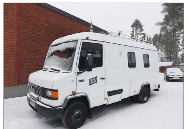
Seurakuntatalon takapihalla oli lähetysauto, josta radiojumalanpalvelus väitettiin suorana lähetyskäyjiä koko Suomen alueelle.

Radiojumalanpalvelusten lähettämiset Yle ostaa alihankintana GrassMark Oy:ltä, jonka kotipaikka on Turku. Saman yrityksen kautta Sundvik hoitaa myös urheilulähetyskäyjiä ja Yle Vegalle ruot-