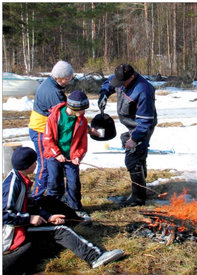
Nokipannukahvit keitetään kaikissa kyläyhdistyksen ulkoilutapahtumissa.