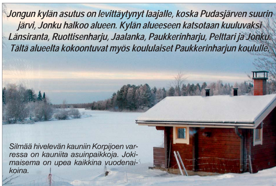
Silmää hivelevän kauniin Korpjoen varressa on kauniita asuinpaikkoja. Jokimaisema on upea kaikkina vuodenaikoina.

Jongun kylän asutus on levittäytynyt laajalle, koska Pudasjärven suurin järvi, Jonku halkoo alueen. Kylän alueeseen katsotaan kuuluvaksi Länsiranta, Ruottisenharju, Jaalanka, Paukkerinharju, Pelttari ja Jonku. Tältä alueelta kokoontuvat myös koululaiset Paukkerinharjun koululle.