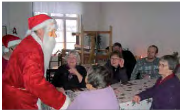
Joulupukki tervehti joulujuhlassa mukana olleita ja samalla harmitteli lahjasäkkiänsä keveyttä.

ohjelmaa, jonka vuoksi kukin mukana olija saa varoa nauruhermojensa katkeamista. Se puolestaan tietäisi aika ikävää ensi vuotta. RR