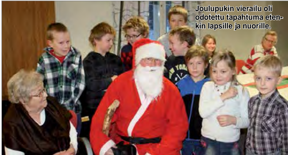
Joulupukin vierailu oli odotettu tapahtuma etenkin lapsille ja nuorille.