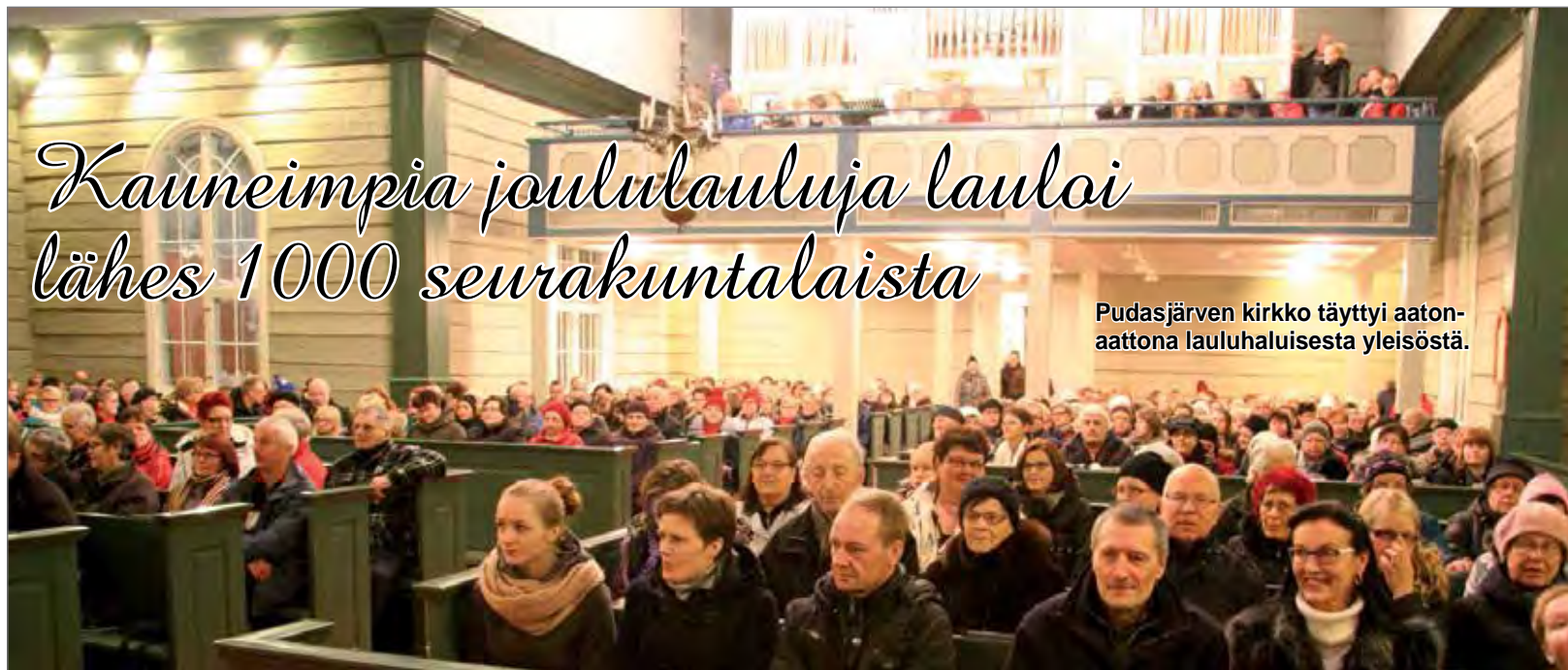
Pudasjärven kirkko täyttyi aaton-aattona laulupaluisesta yleisöstä.