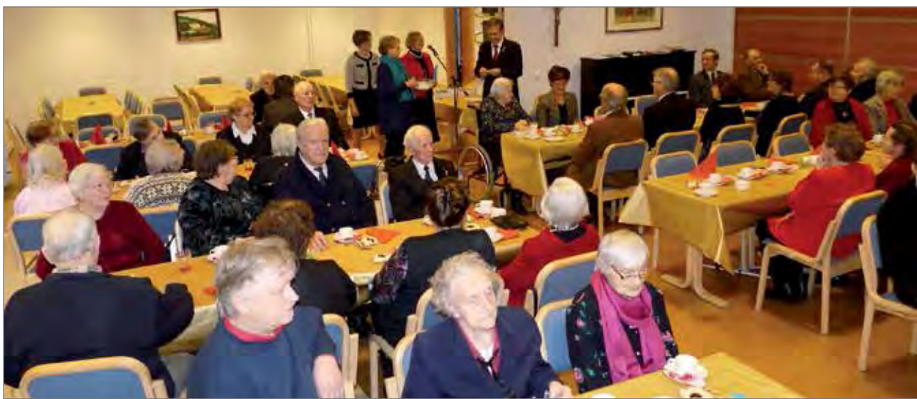
Pudasjärven Sotaveteraaniyhdistys tarjosi juhlaväelle joulupuurot ja torttukahvit. Lopuksi saatiin iloita vielä ilmaisista arpajaisista.