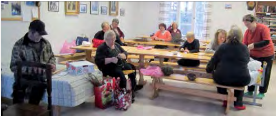
Korpisen askartelukerhoon on osallistunut sekä miehiä ja naisia että lomalla olleita nuorempia harrastajia.

Korpisen käsityöntekijät ovat käsityökerhossaan syyskauden ahertaneet joulukoristeiden tekemisessä. Joka toinen viikko kokoon-tuneet kerholaiset ovat ope-