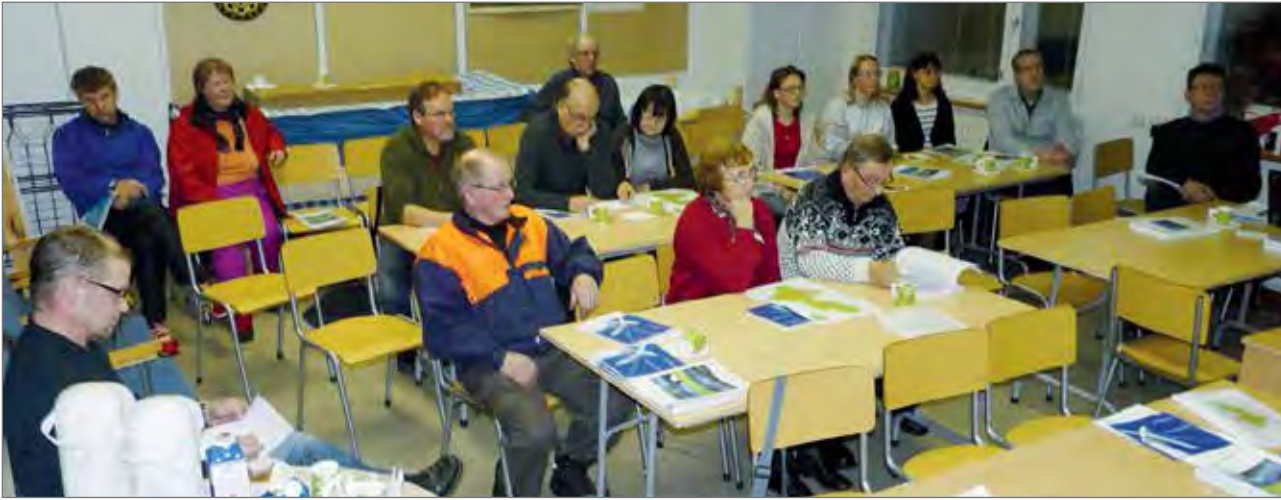
Pudasjärven kaupunki järjesti torstaina 12.12. Nokipannussa Tolpan- Jylhänvaaran tuulivoimapuiston osayleiskaavaehdotuksen esittelytilaisuuden.