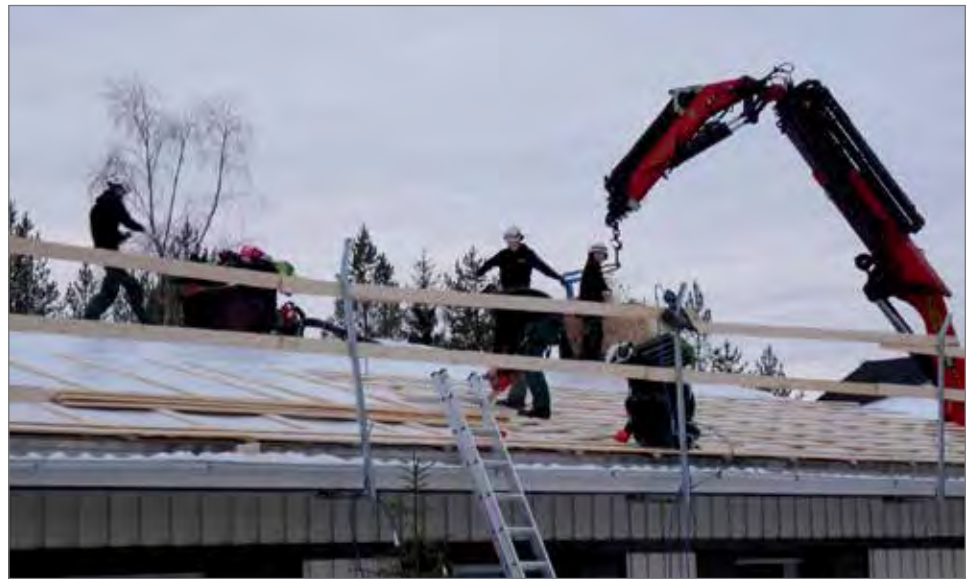
Viisi ammattimestä apunaan nosturiauto tekee kattoremontin joutuisasti.

Kokeneella työmiesporukalla purettiin vanha katopelti ja alusrakenteet pois ja asennettiin uusi aluskate edelleen hyvässä kunnossa olevien vanhojen kattosaksien päälle. Ensimmäisenä päivänä purkutyö aloitettiin aamulla klo 8 jälkeen ja uusi aluskate ja ruodelaudat olivat jo asennettuna klo 12. Ensimmäisen päivän työt menivät nappiin suunnitelmien mukaisesti, koska sääennusteen mukaan iltapäivälle luvassa oli sadetta. Asennuspäivä ja tarkka ajankohta olikin valittu huolella seuraamalla sääennusteita. Vesisateen osalta