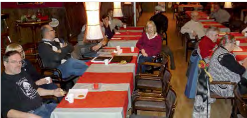
Julmarharjun suojeluyhdistyksen Hotelli Kurenkoskessa järjestämään tuulivoimakeskusteluiltaan osallistui parikymmentä henkilöä.