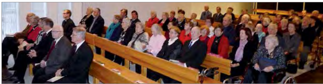
Pudasjärven Sotaveteraanit ja Sotainvalidit naisjaostoineen viettivät yhteistä joulujuhlaa seurakuntakodilla. Juhlaan osallistui reilut 60 henkilöä.