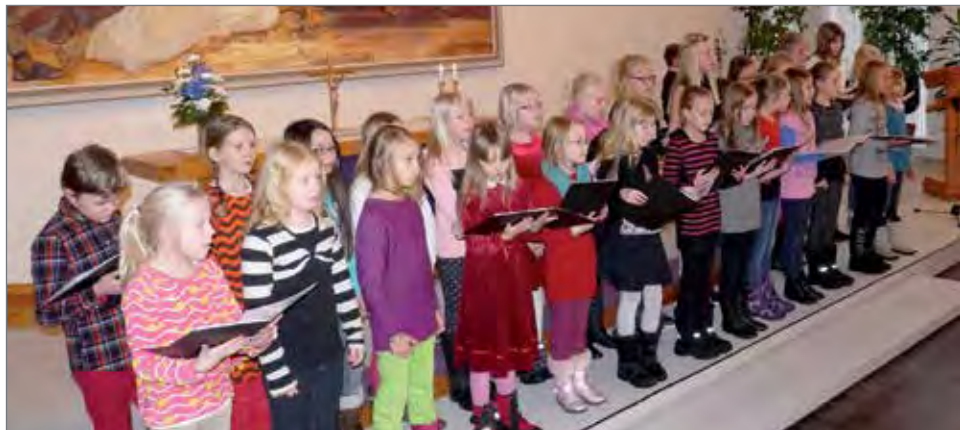
Lamarin koulun lapsikuorokin kävi ilahduttamassa juhlaväkeä laulusesityksillään.

Juhlaväki sai nauttia useista musiikkiesityksistä ja tilaisuudessa laulettiin yhteislauluna lukuisia perinteisiä joululauluja. Lamarin koulun lapsikuorokin kävi ilahduttamassa juhlaväkeä laulusesityksillään.