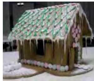
Voittajaksi opiskelijat äänestivät perinteisen mainiosti koristellun talon.

Parhaillaan asuntolatutorit valmistelevat ensi vuoden alun tapahtumia, jonne sisältynee kuntosaliohjaus-