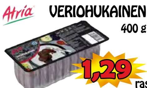
Atria VERIOHUKAINEN 400 g