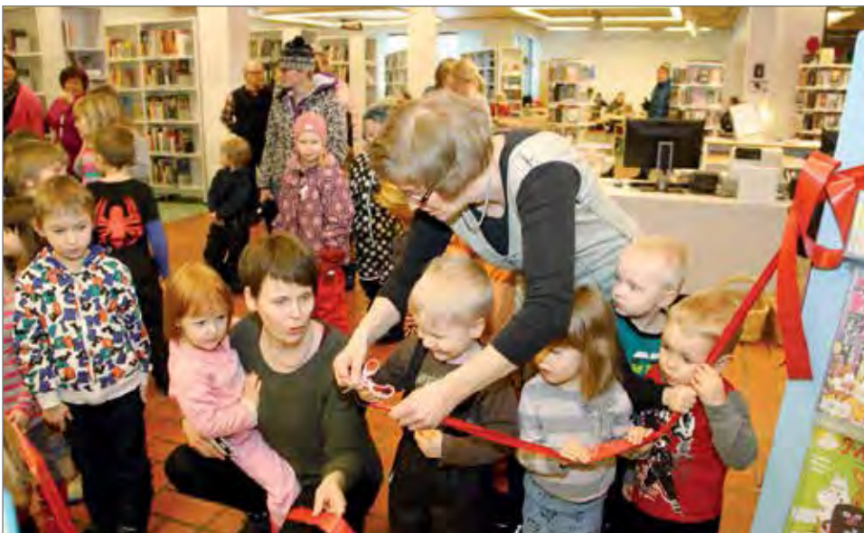
Nauhan leikkaus oli lapsille tärkeä tapahtuma.