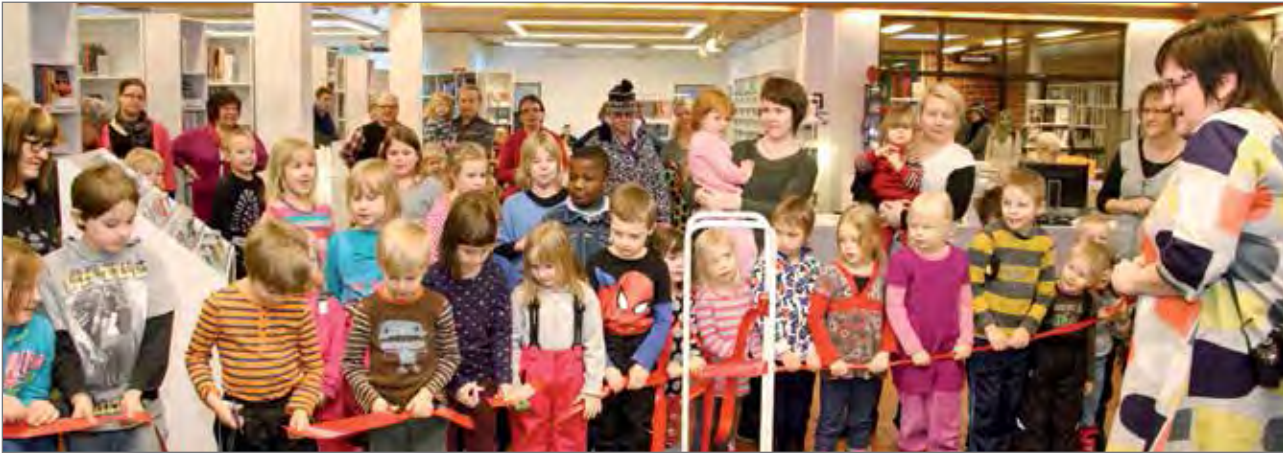
Pikku-Paavalin päiväkodin lapset leikkasivat nauhan kirjaston lasten ja nuorten osaston uudistuksen avajaisissa.