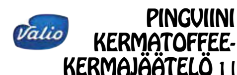
Valio PINGVIINI KERMATOFFEE- KERMAJÄÄTELO 1 l