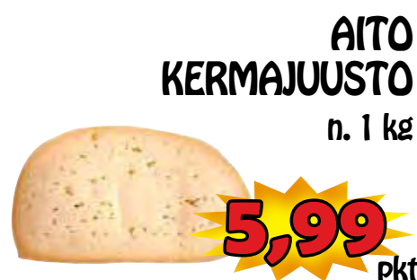
AITO KERMAJUUSTO n. 1 kg