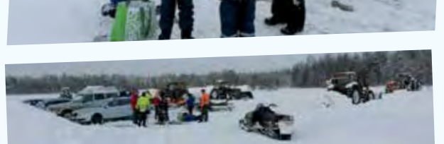
Porokilpailujen järjestäminen on vaatinut lukuisia talkootunteja.