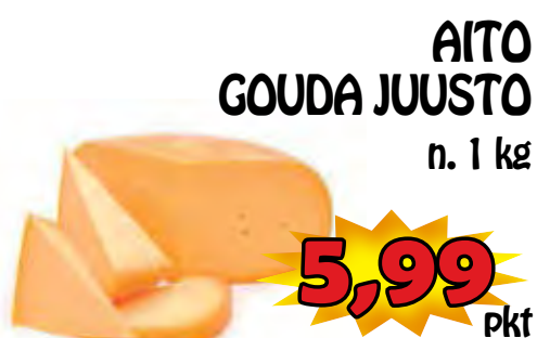
AITO GOUDA JUUSTO n. 1 kg