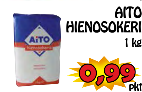
AITO HIENOSOKERI 1 kg