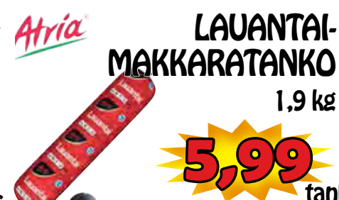
Atria LAUANTAI- MAKKARATANKO 1,9 kg