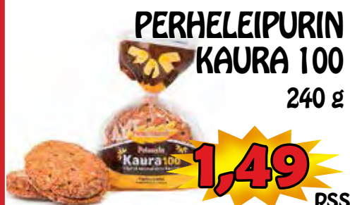
PERHELEIPURIN KAURA 100 240 g

PIETARILANTIE 48, PUDASJÄRVI P. (08) 822 726, TYÖKALUOS AVOINNA MA-PE 9-19, LA 9-18, SU 11-18