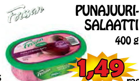
Frisian PUNAJUURI- SALAATTI 400 g