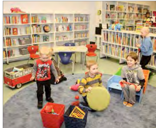
Uudistetut rennot ja värikkäät tilat houkuttelevat lapsia ja nuoria tulemaan kirjastoon ja viiptymään siellä. Väljästi ja näkyvästi esillä olevat aineistot houkuttelevat lukemaan ja lainaamaan kirjoja ja muuta aineistoa.