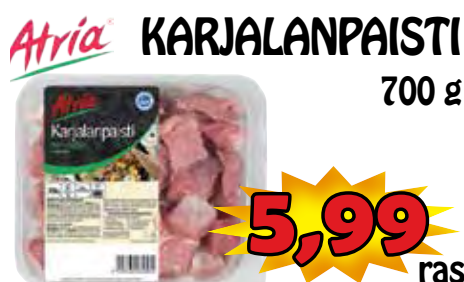
Atria KARJALANPAISTI 700 g