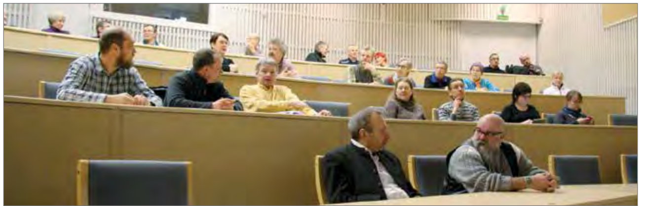
Aktiivinen yleisö keskusteli vilkkaasti.