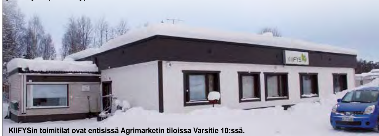
KIIFYSin toimitilat ovat entisissä Agrimarketin tiloissa Varsitie 10:ssä.