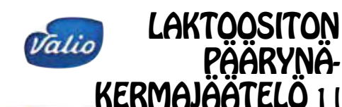
Valio LAKTOOSITON PÄÄRYNÄ- KERMAJÄÄTELO 1 l