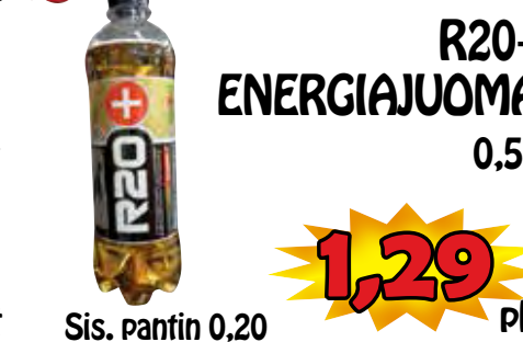
R20+ ENERGIAJUOMA 0,5 l