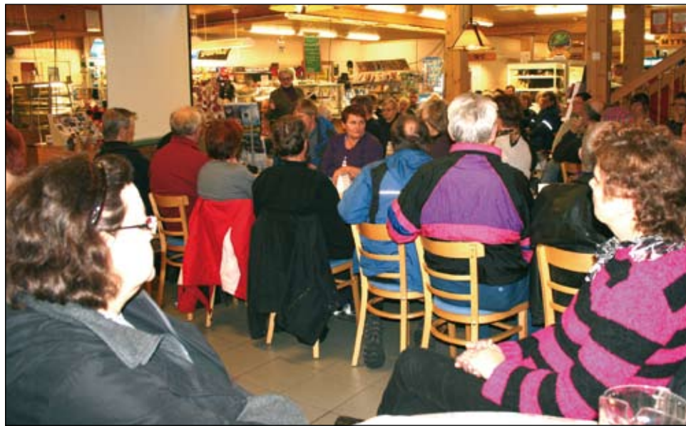
Niemitalon Juustolaan kokoontui salin täydeltä väkeä.