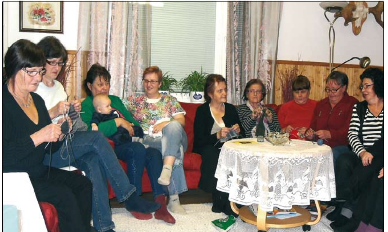
Viime viikon torstaina 21.10 kokoonnuttiin Säkkinellä.

Viime keväänä oli ruokakurssi, johon kurssin pitäjät tulivat Maaseutukeskuksesta. Vuosittainen linja-automatka päätettiin tänä syksynä 13.11 toteuttaa Haaparantaan. (ht)