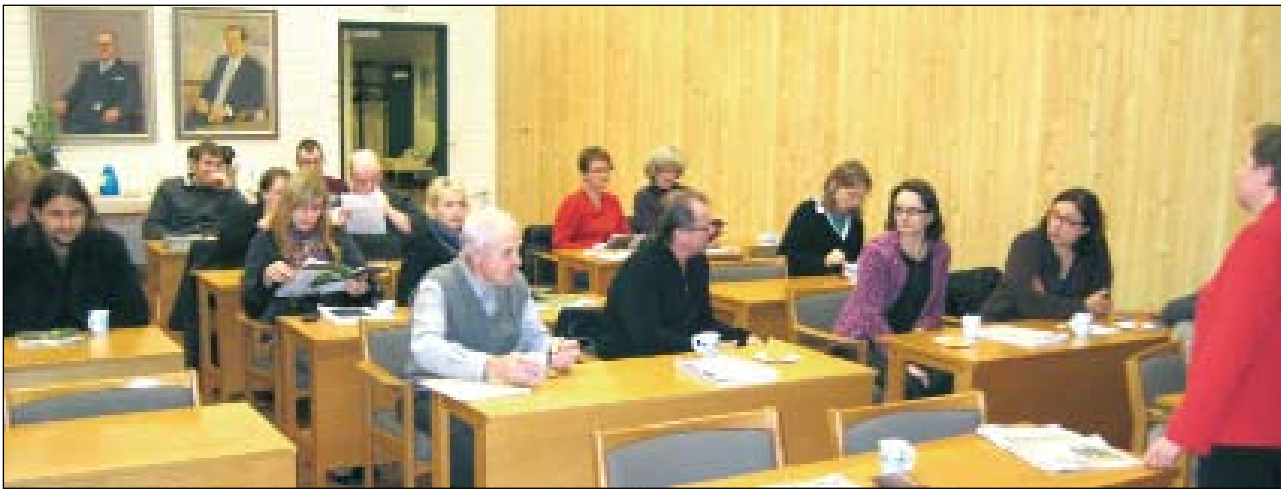
Kaupungin valtuustosali täyttymässä yleisöstä. Kahvin lomassa voitiin tutkia tilaisuudessa jaettavia esitteitä.