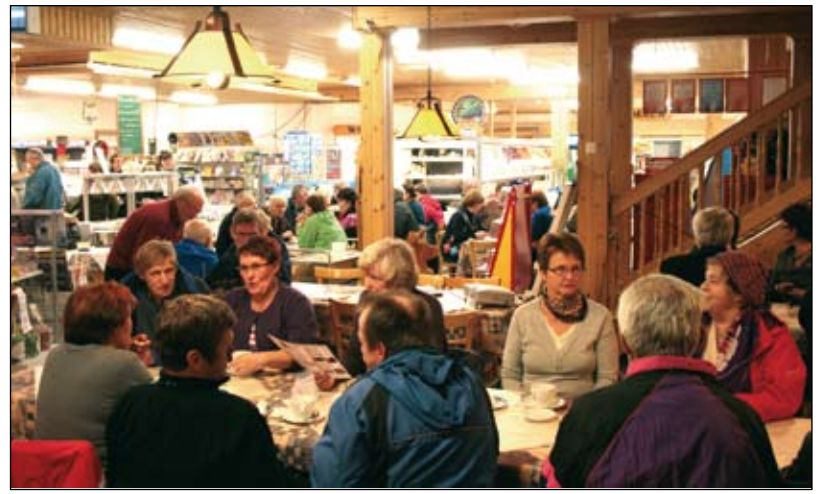
Kyläjohtokunnan perustaminen on ensimmäinen askel naapurikylien yhteistoiminnalle. Alueella on suunnitelmia matkailun kehittämiseen ja kylätalon perustamiseen.

kolle ajattelemisen aihetta kertomalla esimerkein miten asenteet ja erilaiset näkemykset voivat vaikeuttaa elämää. Positiivinen ja avoin asenne ja mieli olisi kaikkien hyvä omaksua.