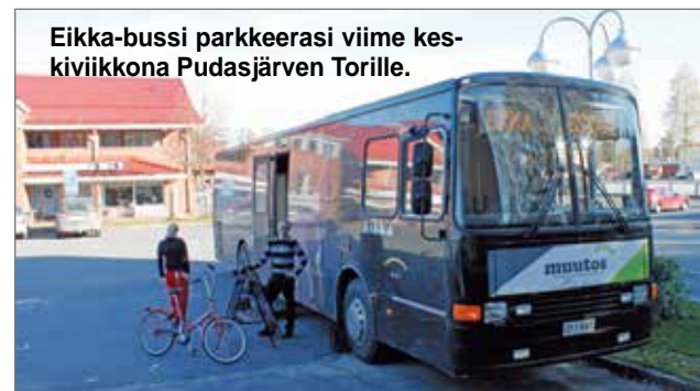
Eikka-bussi parkkeerasi viime keskiviikkona Pudasjärven Torille.

Eikka heitti keikan Pudasjärvelle keskiviikkona 7.10. Eikka on Pohjois-Pohjanmaan Liikunnan eli PoPLin bussi, jolla kierretään kunnissa tekemässä terveyden edistämistyötä.