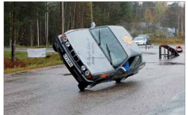
Autoharrastaja Sami Lund teki Luntti 2Wheels Driver -näytöksiä ajaen autolla kahdella renkaalla.