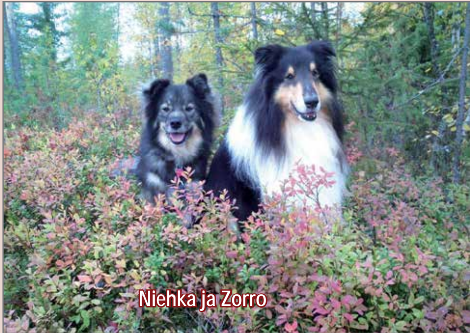
Niehka ja Zorro

Näin eläinten viikon kunniaksi kirjoittelen muutamaa rivin kuulumisiani.