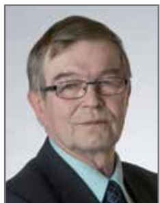
Niilo Keränen kansanedustaja

Ei ole mukavaa olla tekemässä tällaisia päätöksiä, vaikka eihän täällä eduskunnassa ollakaan mukavuuslaitoksessa. Itse yritän mieltä rankoilta säästöille vaihtoehtoja. Yksi mahdollisuus olisi verotus. Nykyisin yli 90 000 euroa vuodessa ansaitsevat maksavat kaksi prosenttia ylimääräistä veroa normaaliin progressiivisten taulukkojen yli. Ensi vuonna sitä maksavat yli 72 300 euroa tienaat. Voisi olla oikeudenmukaista, jos tuo prosentti vaikka kaksinkertaistettaisiin.