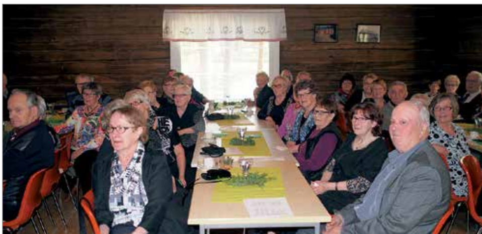
Koskenhovi on kodikas paikka järjestää tilaisuuksia.