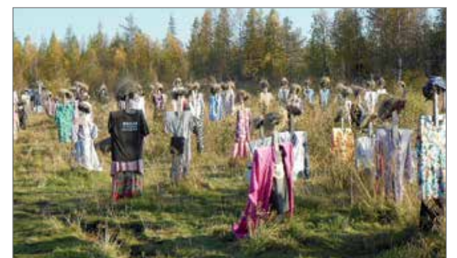
Hiljainen kansa kesäpuvuissaan oli vaikuttava elämys.