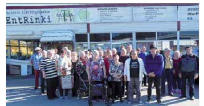
Kyläyhdistyksen porukkaa Kainuun matkalla.