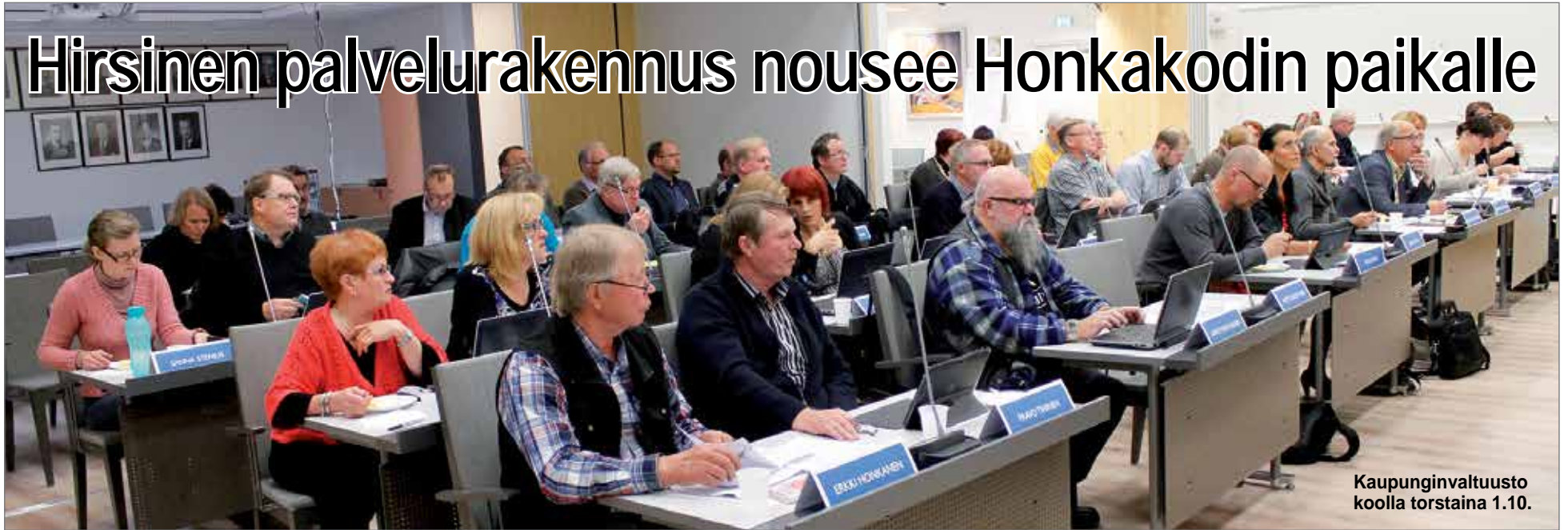
Kaupunginvaltuusto koolla torstaina 1.10.

Kaupunginvaltuuston kokouksessa torstaina 1.10. kopautettiin nuijalla hyväksyvästi hirsirakenteisen palvelurakennuksen puolesta. Elinkaarimallilla toteutettavan projektin vetäjäksi valikoitui ainoan tarjouksen tehnyt Lemminkäinen Talo Oy. Purettavan Honkakodin paikalla rakennustöiden odotetaan alkavan jo 4.11. ja päättyvän ensi vuoden marraskuun loppuun mennessä.