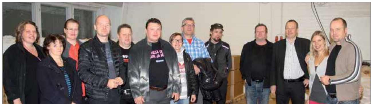
Yrittäjien yhteisillä aamukahveilla oli hyvä tilaisuus saada tietoa paikkakunnan eri yritysten palveluista ja yrittäjien tutustua myös keskenään.