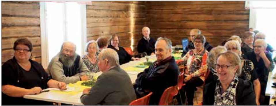
Ihmiset viihtyvät Koskenhovilla ja hauskaa oli.

Pudasjärven Osuuskaupan ja myöhemmin Arinan työn-tekijät kokoontuivat muistelemaan aikoja entisiä perinteiseen Koskenhovin nuorisoseurataloon. Aktiivisen ryhmän kutsua oli kuulut 55 ihmistä niin hyvin, että olivat panneet pyhävaatteet ylle ja suunnistaneet jotkut kaukaakin tähän tilaisuuteen tapaamaan vanhoja työtovereita.