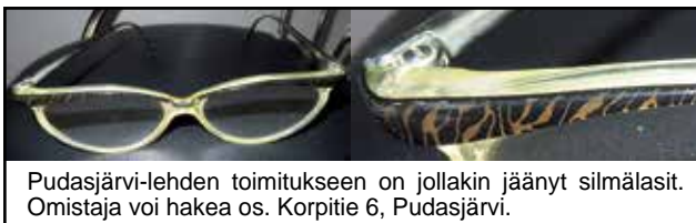
Pudasjärvi-lehden toimitukseen on jollakin jäänyt silmälasit. Omistaja voi hakea os. Korpitie 6, Pudasjärvi.