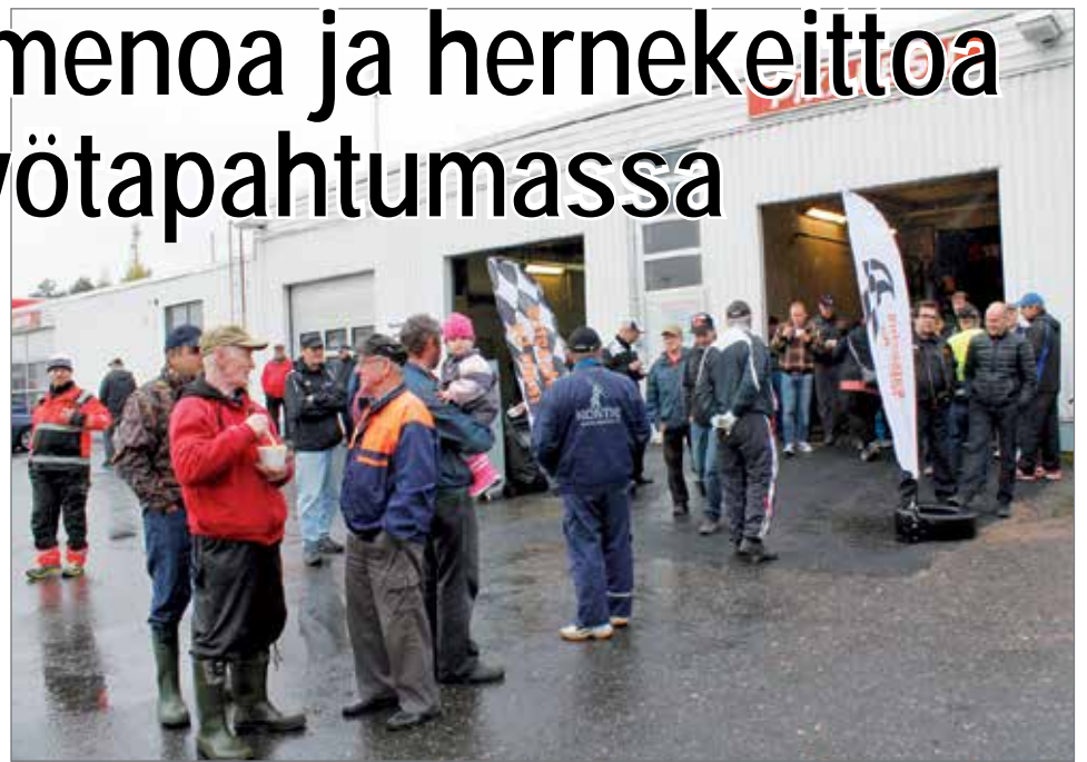
Kolmen yrityksen yhteistyötapahtumaan kertyi mukavasti ihmisiä, vaikka sää olikin satelinen. Lämmin hernekeitto maistui.