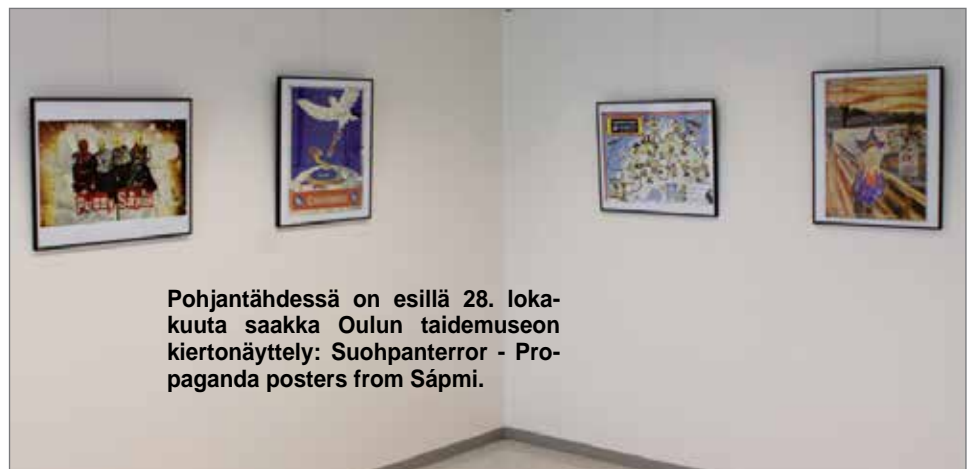
Pohjantähdessä on esillä 28. lokakuuta saakka Oulun taidemuseon kiertonäyttely: Suohpanterror - Propaganda posters from Sápmi.