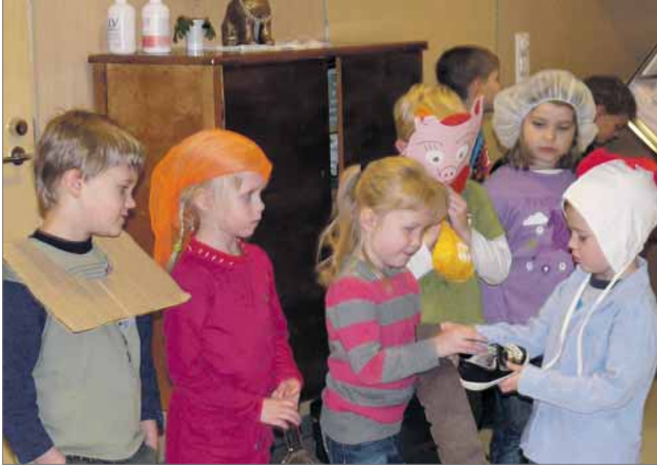
Lapset valmistautuvat esitykseensä.

huksia. Lapsille jäi myös mukava muisteltava vanhusien luona vierailusta. (ks)