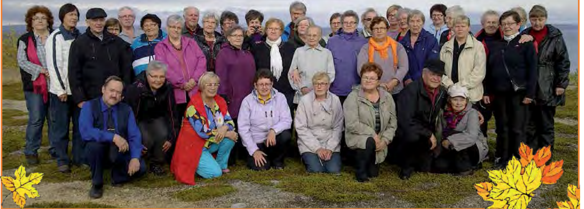
Ryhmäkuva otettiin Norjan puolella Varanginvuonon rannannalla.