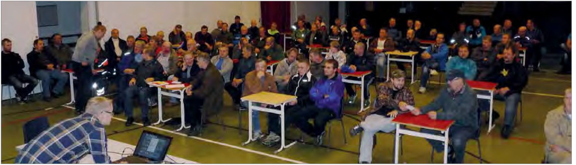
Syksyn 2013 Hirvipalaveri kokosi salin täydeltä väkeä.