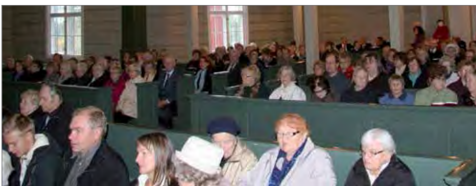
Lähes kirkon täyteinen yleisö oli todistamassa Pudasjärven seurakunnan 28. kirkkoherran virkaan asettamista.