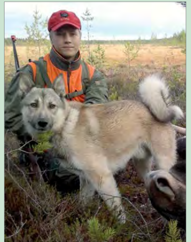
Pysäyttävä hirvikoira on verratton apu hirvenmetsästyksessä. Suomen hirvikäyttövalio Jaaskamon Turon seisontahaukku päätyi onnistuneeseen hirvenkaatoon.

Tutkimus toteutetaan lähettämällä joulukuun aikana 2013 kysely kaikille alueluvan saaneille ja yhteisluvuissa myös osaporukoiden vetäjille. Aineisto käsitellään alkuvuodesta 2014 ja tulokset ovat käytössä huhtikuus-