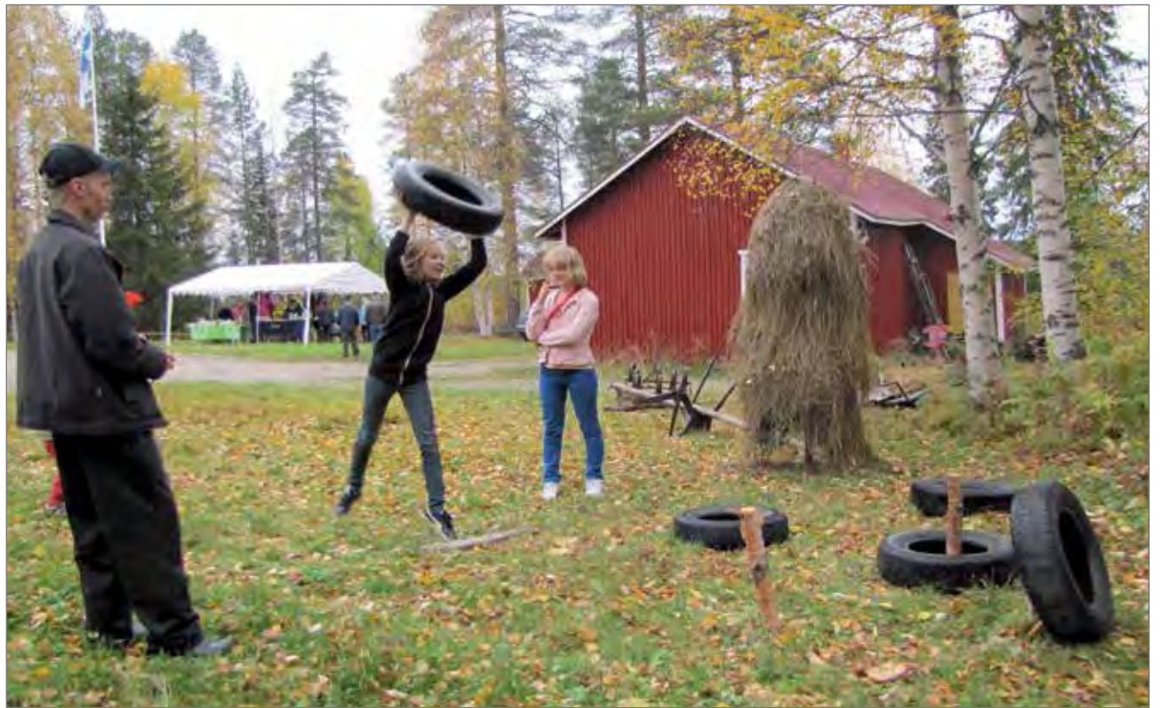
Renkaanheitto oli mukavaa toiminnallista markkinapuhua.

Syysmarkkinat olivat iloinen kansantapahtuma, jossa tavattiin tuttuja ja nautittiin