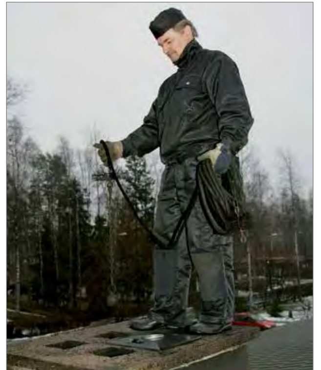
Nuohooja puhdistaa savuhormin laskuharjalla niin puhtaaksi, ettei nokipalon vaaraa ole ja että hormi on toimintakunnossa.