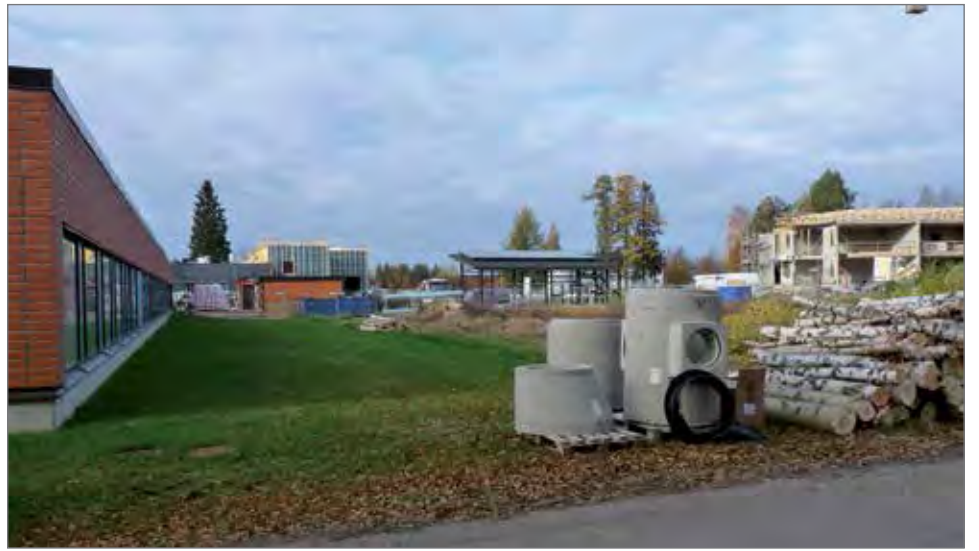
Kaupungintalon uuden pysäköintialueen rakennustyöt kaupungintalon ja Kaupunginkartanon väliin aloitettiin alueen puuston harventamisella.