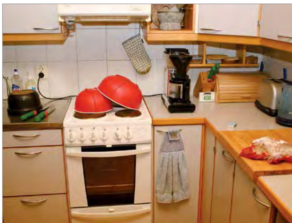
Paljon on itsestä kiinni. Etsi kuvasta vähintään viisi vaaratekijää. Vastaukset jutun yläosassa. Kuva: Pelastuslaitos.

Kotoa lähettäessä on ehdottomasti tarkistettava, että liesilevyjen virta on katkaistu. Syömättä jääneet ruuat on oltava siivottuna liesitasolta erityisesti silloin, jos asuntoon jää suurikokoisia kotieläimiä. Saman tarkistuskierroksen aikana on hyvä tarkistaa myös, että astianpesukoneen ja pyykinpesukoneen hanat ovat kiinni. Meidän emme jätä pyykin- tai astianpesukonetta tai kuivausrumpua päälle kotoa lähettäessä! Lähtörutiiniin kuuluu myös tarkistaa, ettei muitakaan tarpeettomia sähkölaitteita tai valoja jää päälle. Lopuksi ovet lukkoon ja