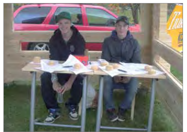
Iloiset prosessiopiskelijat myymässä markkina-arpoja.