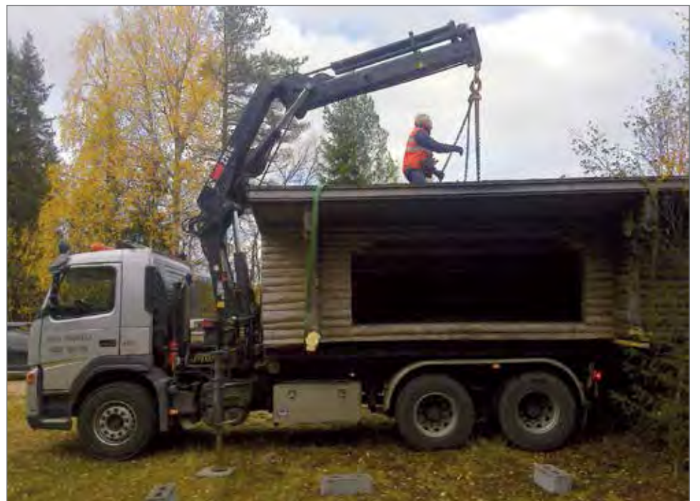
Laavun siirto tehtiin kuljetusyritystä, Juha Huhtelan nosturilla varustetulla kuorma-autolla.