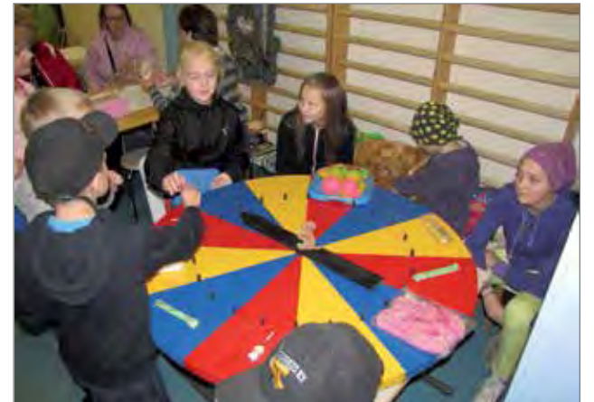
Lapset saivat pyörittää onnenpyörää.

voimainen sukupolvi. Tämä joukko ei ole jäänyt laakerilleen lepäämään. Kylille on perustettu Kyläkolmio ry, joka on tarjoutunut ostamaan tyhjäksi jääneen koulukiinteistön. Kyläkolmioon kuuluvat Kelankylä, Kuukasjärvi ja Petäjäjärvi. Yhdistys on vuokrannut koulun kuluvaan talvikaudeksi. Kyläkolmion tarkoitus on ylläpitää kiinteistöä ja järjestää erilaisia aktiviteetteja kyläläisten