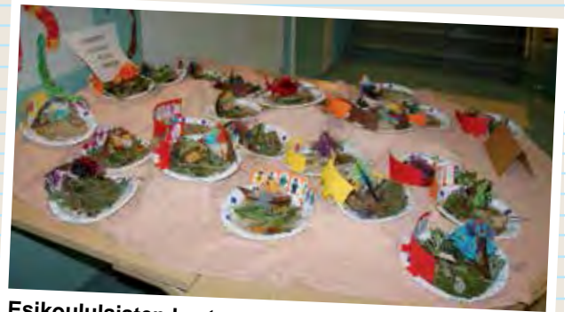
Esikoululaisten kastematonäyttely Lakarin aulassa.