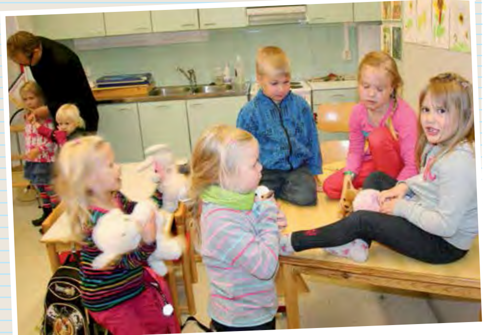
Eskareilla leikki mielessä. Ainakin välitunnilla.