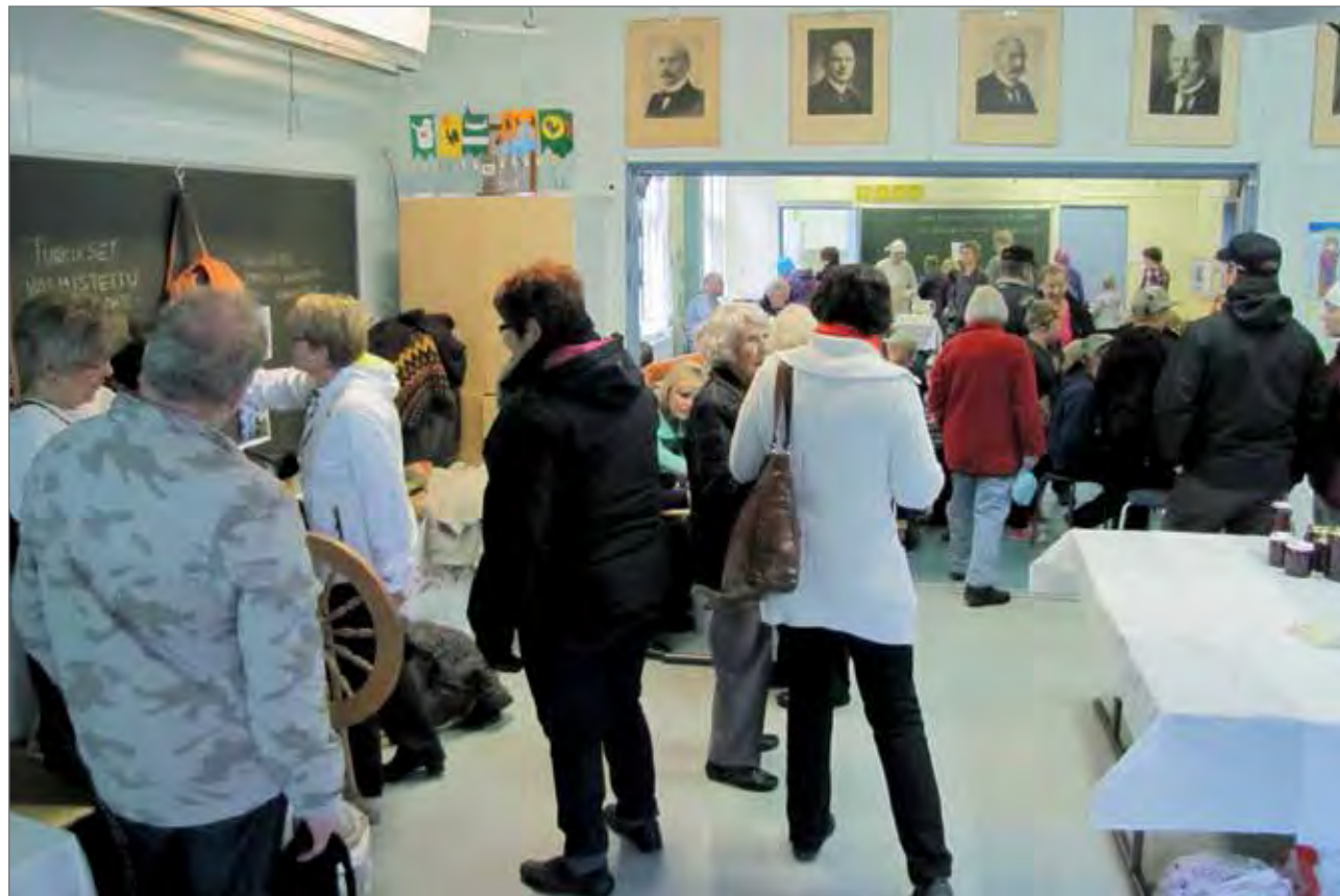
Ensimmäiset Kuukasjärven koulun syysmarkkinat vetivät 300 kiinnostunutta.