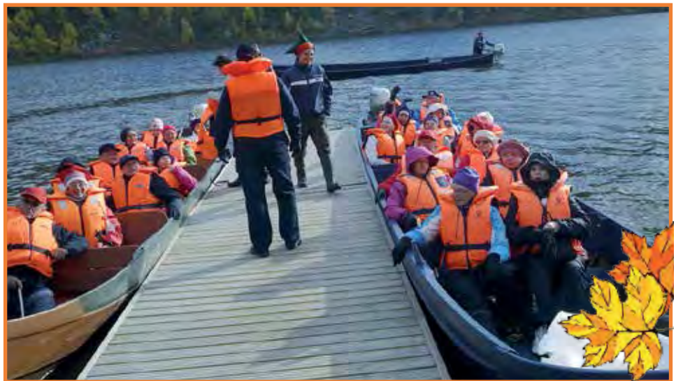
Ryhmäläiset matkustivat kolmella jokiveneellä 17 kilometriä Lemmenjokea pitkin.

ja hän kertoi miehensä olevan ahkera karhunmetsästäjä. Utsjoelta lähdetessä pysähdyimme vielä kauniin vanhan Utsjoen kirkon luona. Sieltä saavuimme sitten Kaamasen ohittaen, Jounin kaupan ollessa kiinni, takaisin Inarin Kultahoviin rantasaunan löylyihin.