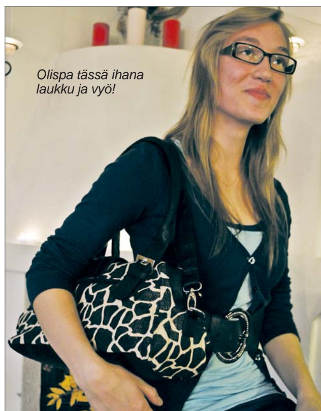
Olispa tässä ihana laukku ja vyö!