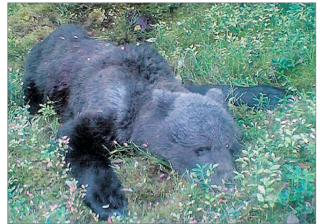
Jaurakkavaaraan Lohilammen tuntumaan kaadettu naaraskarhu, joka oli jo iäkäs ja huonokuntoinen.