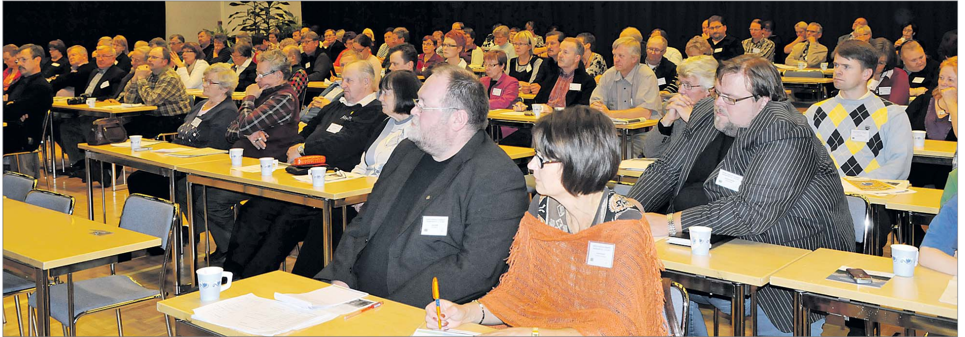
Kyläpäiville osallistui runsaasti väkeä Pohjois- ja Keski-Pohjanmaalta.

Perjantaina ja lauantaina 24-25.9 kokoontui noin 150 eri pohjois-pohjalais ja keski-pohjalaiskylien ja hankkeiden edustajaa kyläseminariin Syötekeskukseen Pikku-Syötteelle. Kahden päivän seminaariohjelma oli rakennettu siten, että perjantaina ohjelman runkona oli teema "Kerrotaan kylistä" ja lauantaina "Kylät kertovat". Molempina päivinä teemoja käsiteltiin monelta eri kantilta, tavattiin toisia ja etsittiin kylätoimintaan vinkkejä ja ideoita.