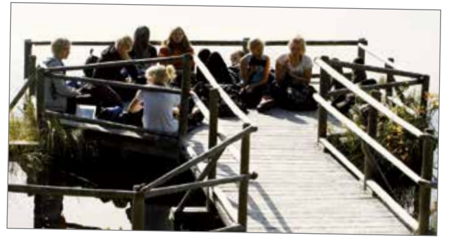
Levähdyshetket taukopaikalla olivat tarpeellisia.

Kun oltiin ahmittu lätyjä useampikin, alettiin leikkiä pimeäpiilosta pilkkopimeässä! Se oli hauskaa jos mikä. Pimeässä oli myös hyvä pelotella toisia, jotka tärisivät koko illan kaamean kummitusjutun pelottamina! Väsymys alkoi kuitenkin pian painaa, ja alettiin jo siirtyä puolijoukkueeltaan nukkumaan. Yön hyisestä kylmyydestä huolimatta teltassa oli lämmitä, kiitos sinne viri-