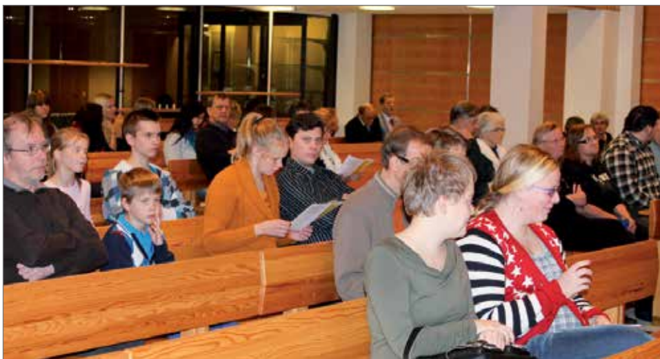
Konsertti keräsi yli seitsemänkymmenen hengen yleisön seurakuntasaliin.