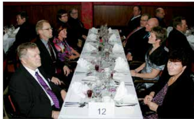
Juhlaan osallistui reilut 100 Pudasjärven Yrittäjien jäsenyrittäjiä ja kutsuvieraita.