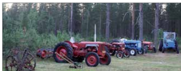
Kisapaikan vieressä parkkialueella oli vanhojen koneiden ja traktoreiden näyttely.