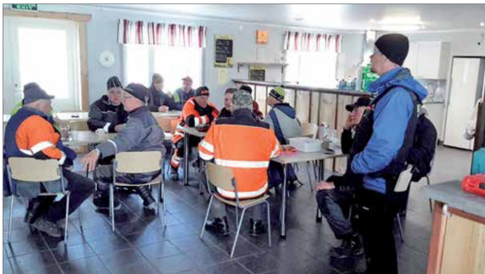
Talkooporukkaa tauolla viime keväänä.