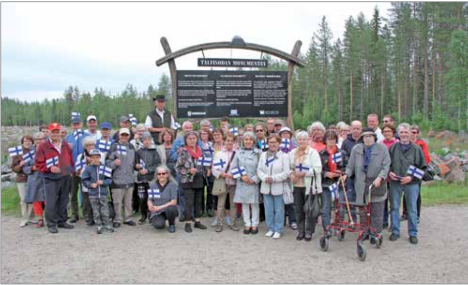
Retkikuntamme talvisodan monumentilla.