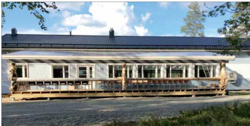
Yli 70 neliömetrin terassilla voi tanssia ja nauttia myös kahvion antimia.

HT, kuvat Terttu Holappa ja Sauli Juurikka.