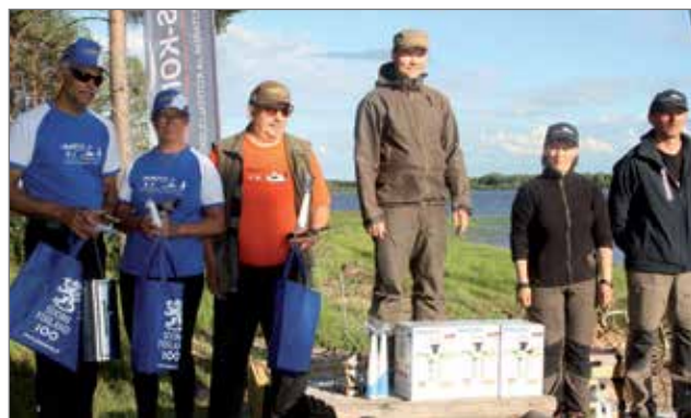
Joukkuekilpailun voittajat palkintopallilla.