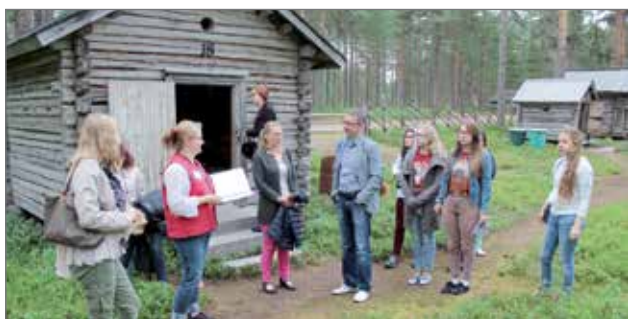
Delegaation jäsenet ja taideleirin nuoret tutustuivat lauantaina kotiseutumuseoon.