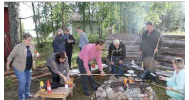
Kynttilätalon pihapiirin nuotiopaikalla vietettiin vapaamuotoista nuotioltaa mm. räiskäleitä ja grillimakkaroina paistena ja nauttien.