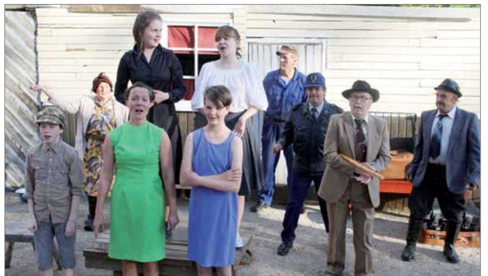
Ryyspoksi näytelmän esittäjät jatkavat esityksiä elokuun lopulla Herkonmäen kesäteatterissa, jonne toivotaan runsaasti myös pudasjärvisiä katsojia.