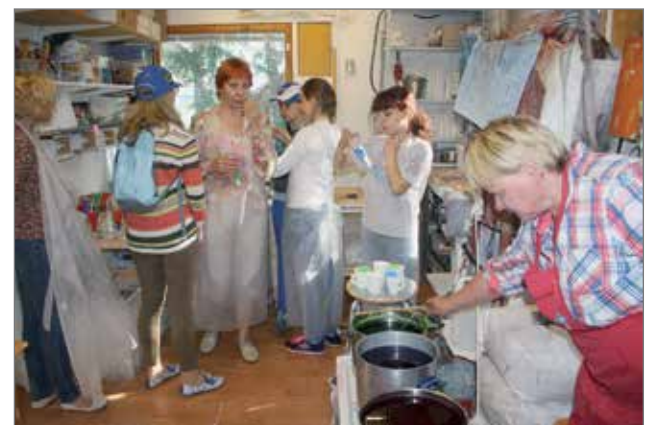
Kynttilänvalantaa tutustuttiin ja sitä myös harjoiteltiin torstai-iltana Kynttilätalolla.