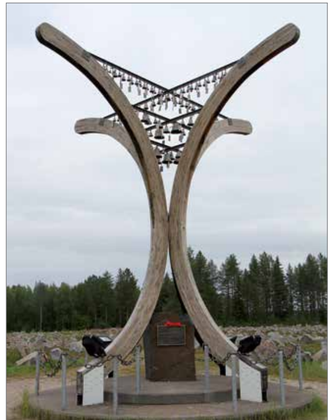
Vaikka ihminen kuolee - niin muisto elää. Talvisodan monumentin keskellä oleva muistomerkki "Avara syli", jossa 105 vaskikelloa soittaa hiljaista sävelmää. Kelloja on yksi jokaista talvisodan päivää kohti.