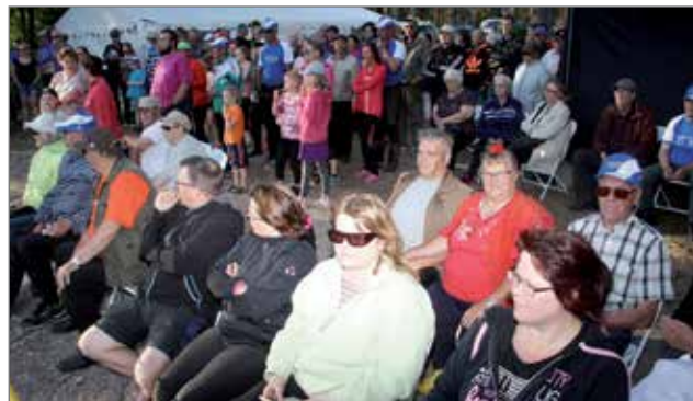
Yleisöä oli joka päivänä paikalla seuraamassa kisa. Eniten sunnuntai-iltana finaalin palkintojen jaon aikana.