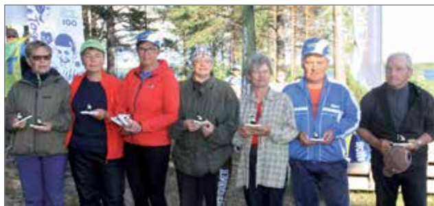
Kymmenen kerran kilpailuun oli tällä kertaa osallistumassa 14 eri henkilöä, joista palkintoa oli ottamassa vastaan finaali-iltana puolet.