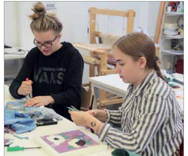
Taideleirin pudasjärveläisiä nuoria.