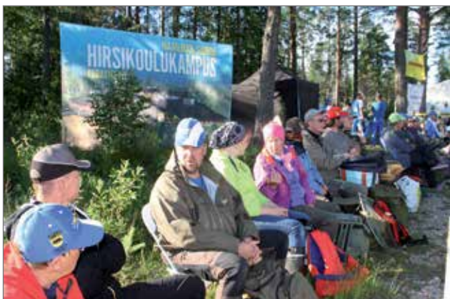
25 finalistia odottamassa kalojen punnitusvuoroaan lauttojen numerojärjestyksessä.