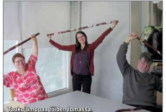
Taukojumppaa töiden lomassa.