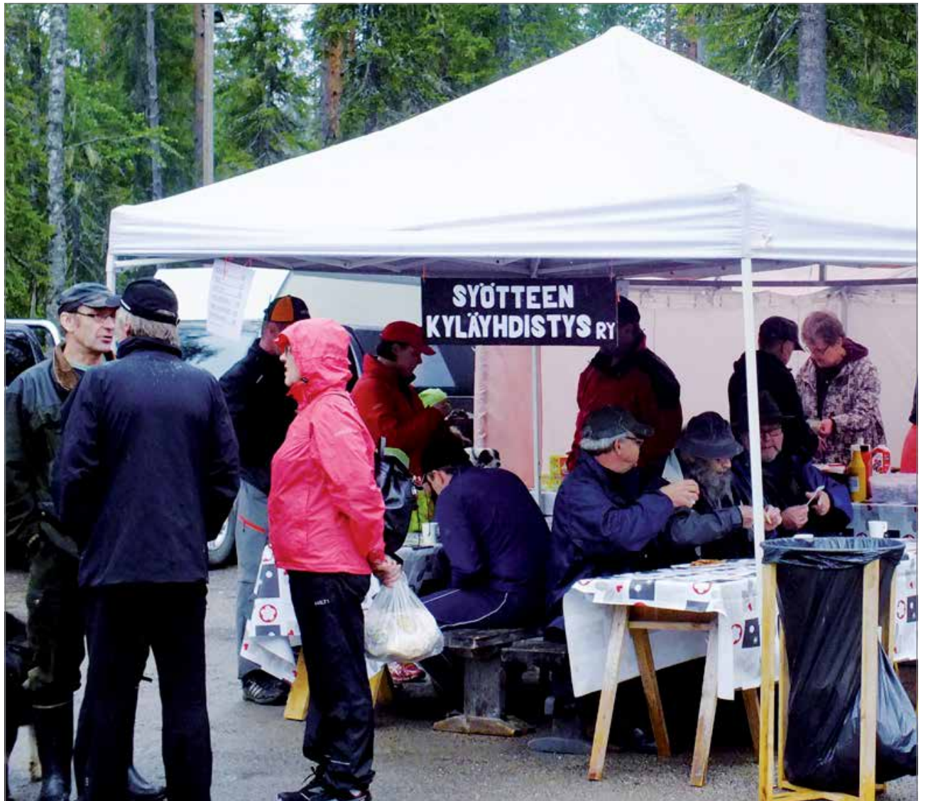
Erämaamarkkinoilla Syöteen Kyläyhdistyksen teltalla kuhisi väkeä ja ruoka teki kauppansa.