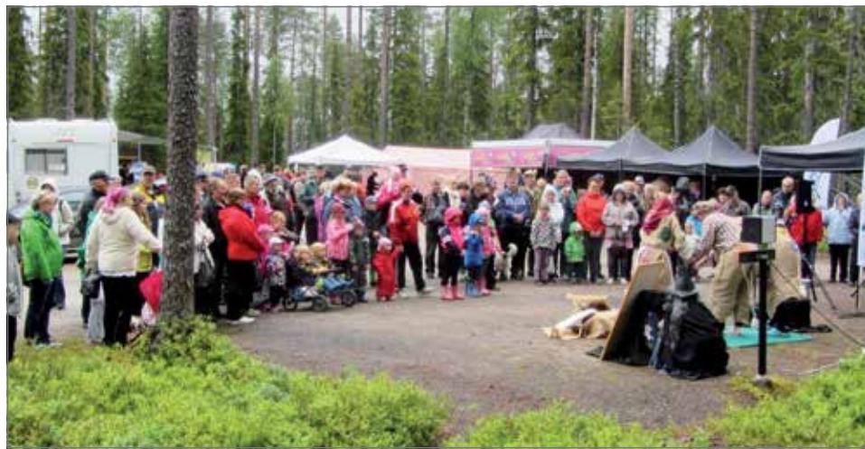
Markkinäkävijät pääsivät kannustamaan Syöte MTB -maastopyöräkisaan osallistuneita markkinoiden laidalta kulkeneen reitin laidalla.