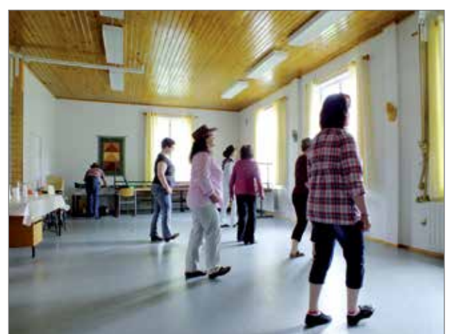
Kanta-askel, jalan suoristus, askel taakse.. kantritanssin perusteita opiskelemissa oli toistakymmentä ihmistä.