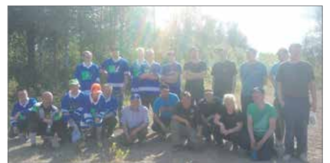
Pelaajat yhteiskuvassa, Pappojen joukkue vasemmalla.

tystä oli joskus enemmän kuin taitoa ja harhasyötöjä nähtiin molemmilta joukkueilta. Hiekka pölysi ja ottelu varten taiseksi lanatun kentän pintaan ilmestyi isoja kuoppia kamppailun jäljiltä. Tämän jälkeen myös tuurilla oli osuutta siinä mihin pallo sattui potkaisun jälkeen pomppiin. Se ei kuitenkaan tahtia hidastanut, vaan voitosta taisteltiin ankarasti puolin ja toisin. Toisella puoliajalla Junnujen muutama nopeasti tehty maali ratkaisi ja pelin tempo laski. Ottelu päättyi lopulta 5-0 junioreille. Aikaa on kulunut yhdeksisen vuotta siitä kun