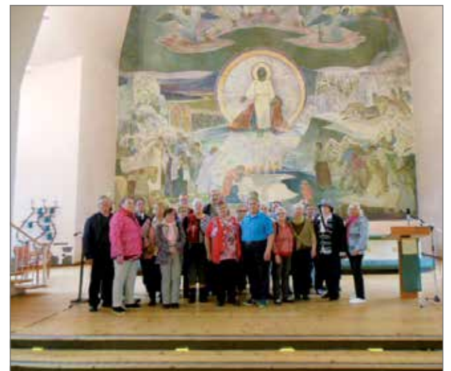
Ryhmäkuva otettiin Rovaniemen kirkossa