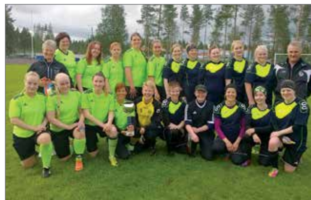
Naisten finaali joukkueet FC Rauha Haukiputaalta ja kajaanilainen FC TeLun.