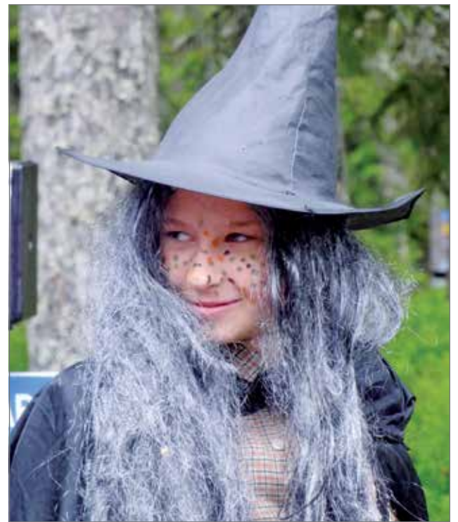
Peikkoteatteri viihdytti markkinaväkeä sateen keskellä.