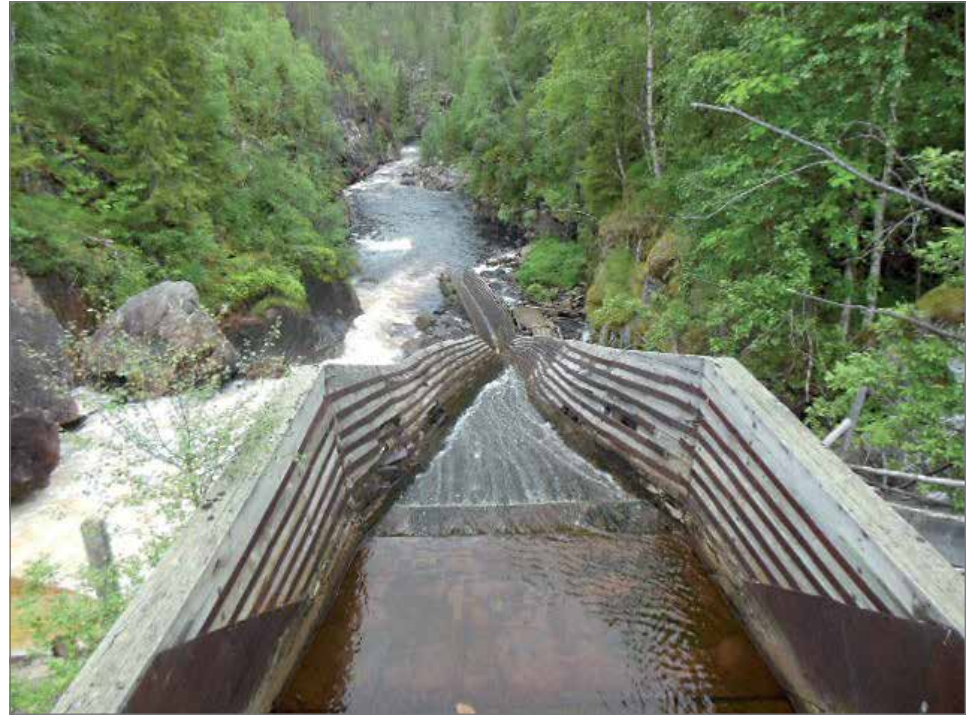
Auttiköngäs oli näkemisen arvoinen. Tukkien uittoränni oli entistettynä hyvässä kunnossa.

Syönnin aika oli Erä- kämpä-hotellissa "Lap- in ukon keitto" maistui. Tunnin päästä lähim- mä Kemijokivartta pit- kin Rovaniemelle, jossa meillä oli kahden tunnin opastettu esittely. Kau- pungin kulttuuria, histo- riaa ja toimintaa opimme, Rovaniemen kirkossa- kin kävimme esittelyssä - oli tosi hieno! Sunnun- tain jumalanpalveluksen radiontivalmistelutki oli-