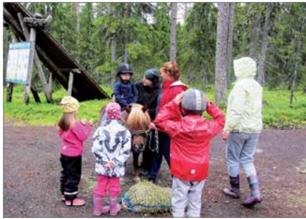
Hirvaskosken tallin järjestämä poniratsastus oli lasten suosiossa.