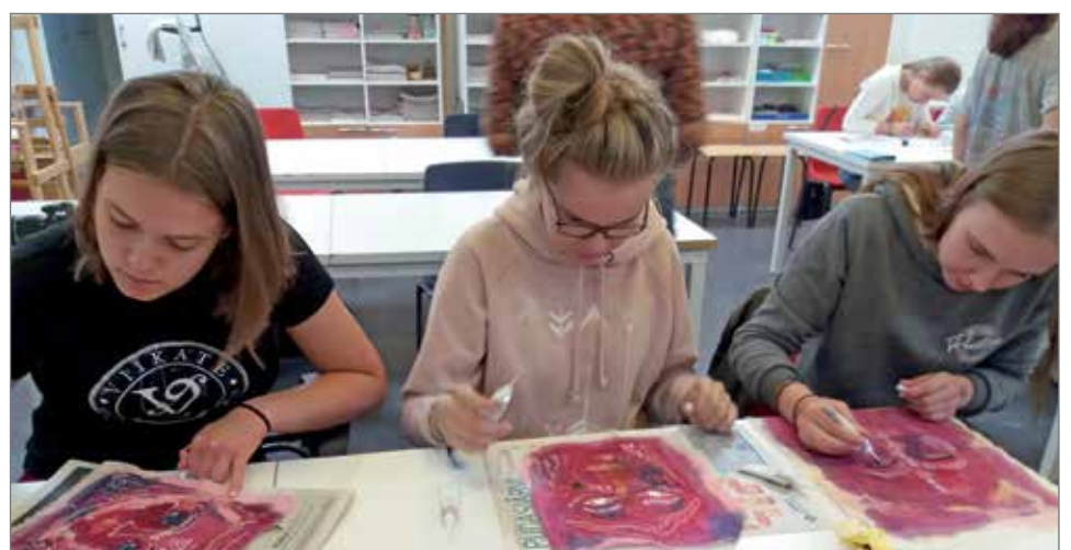
Sukukansojen taidesilta-taideleirille osallistuu nuoria kädentaitajia Komin tasavallasta ja Pudasjärveltä