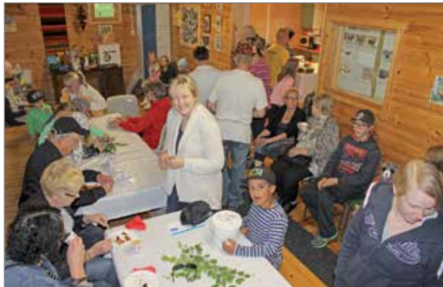
Tiivis oli tunnelma ajoittain sisätiloissa, mutta hyvin mahdollittiin kahvittelemaan ja nauttimaan tarjottavia sekä osallistumaan arvontaan.