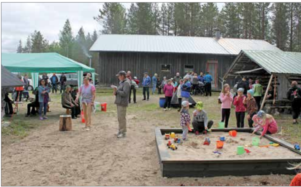
Kettinginheittoa ja kuulumisten vaihtoa. Lasten viihtyvyyteen on panostettu vuosi vuodelta. Aiemmin investoidun hiekkalaatikon lisäksi tänä vuonna uusina ajanvietepeleinä olivat renkaan heitto ja frisbeegolf.

Leikkimielisten kilpailuiden ohella nautittiin monipuolisista tarjoiluista. Kahvi, mehu, pannukakku sekä makkarat lisukkeineen maistuivat. Lapsille oli lisäksi jäätelöä ja karamelleja. Hupitoimikunnan kantavana periaatteena tapahtumien järjestelyissä on, että tarjoiluista ei veloitetä. Varoja toiminnan pyörittämiseen kerätään arpojen myynnillä ja