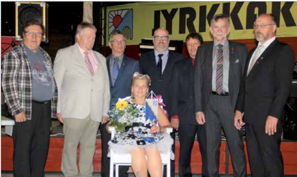
Ensimmäisinä onnittelijoina oli Pudasjärven Urheilijoiden hallitus, jotka kiikkuttivat mukanaan Kiikkutuolin yhteisesti Tuurintuvan onnittelulistalta kertyneillä euroilla.