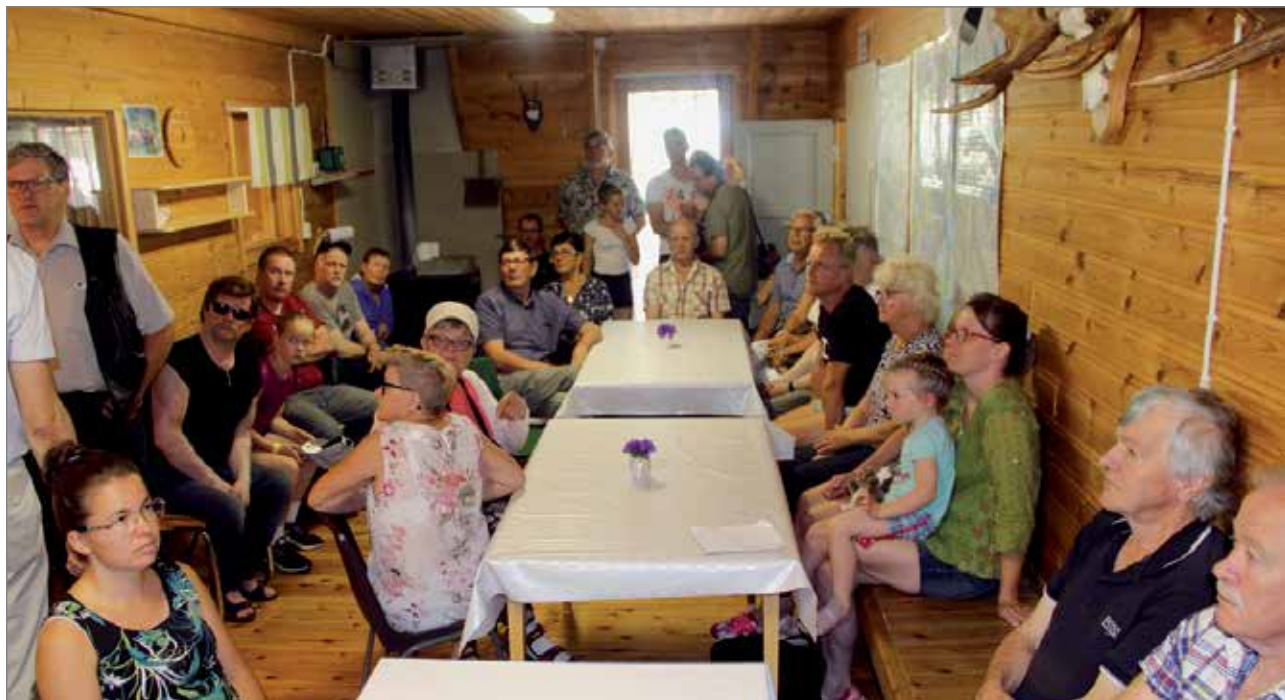
Metsästysseuran 50-vuotisjuhlaan osallistui arviolta 150 henkeä. Osa väestä oli kuvassa näkyvän juhlatilan viereisessä laajennusosassa, jossa oli myös juhlahvitarjoilu.

lähinnä lintumetsällä. Hän mainitsi metsästyksen olevan erittäin merkittävä kansantaloudellisesti ja miljoonia euroa säästetään myös terveydenhoitokuluissa, kun metsästäjien kunto kohenee metsässä liikkessa. HT