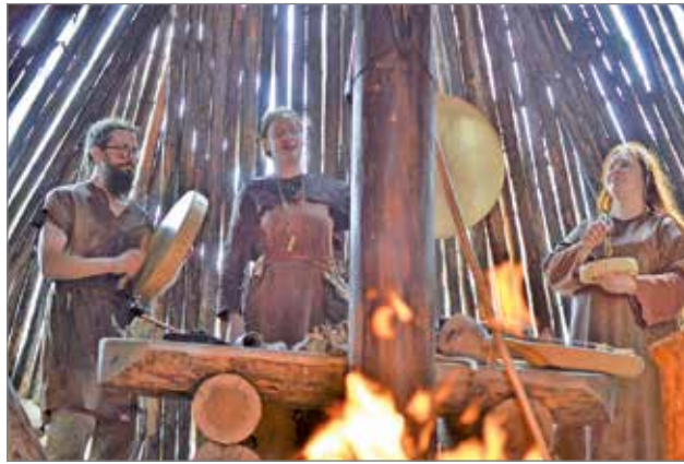
Vuoden 2017 markkinoilla Äiniöiden muinaismusiikkia, joita esityksiä on myös tänä vuonna.