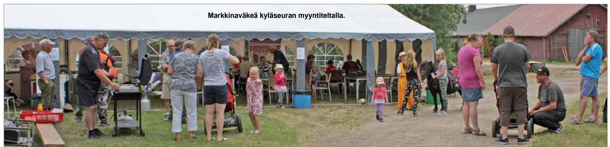
Markkinäväkeä kyläseuran myyntiteltalla.