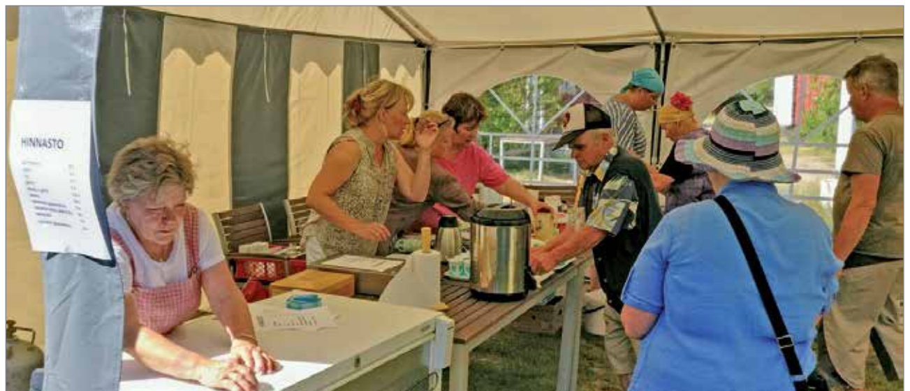
Kyläseuran teltalla riitti kiirettä.