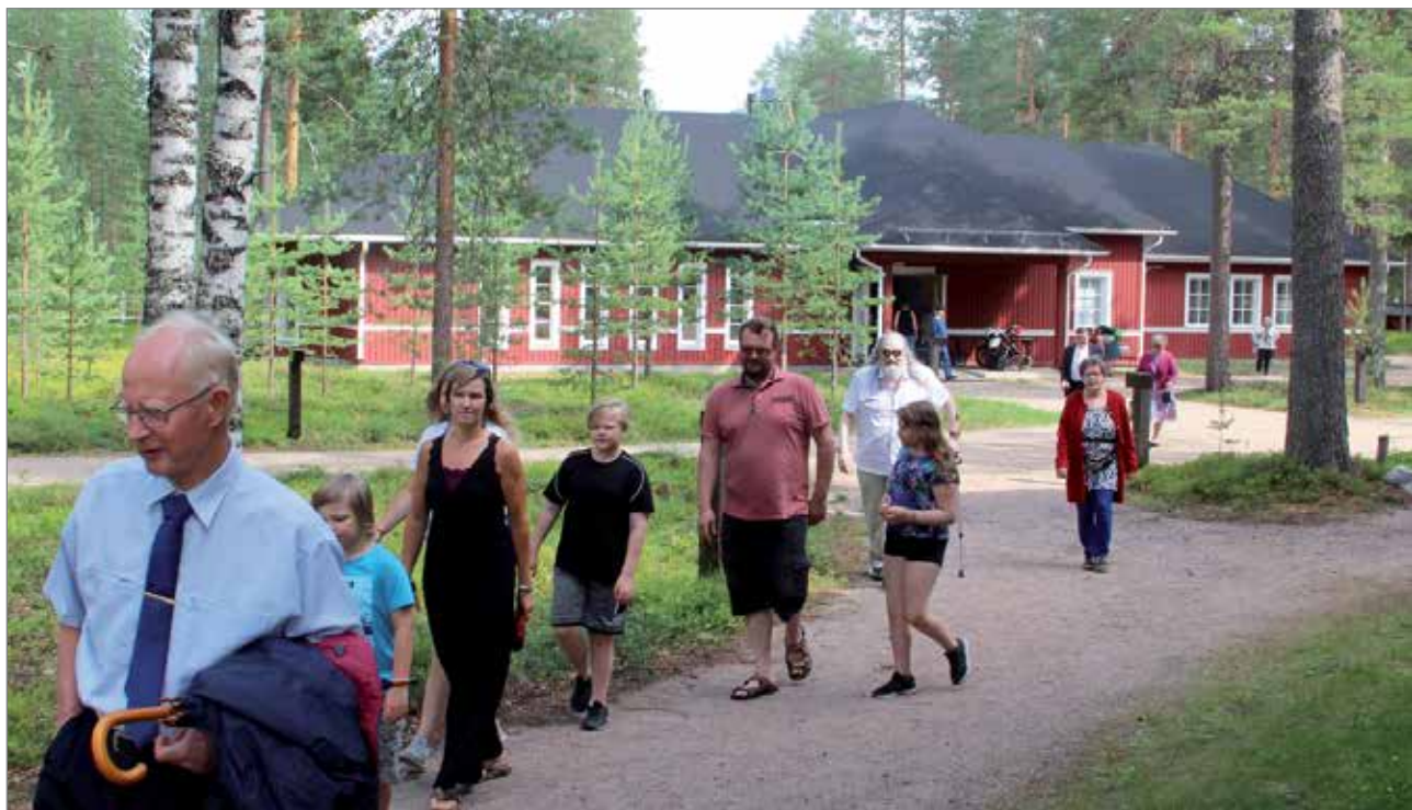
Sateen uhan vuoksi kirkkokahvit nautittiin siunauskappelissa, josta siirryttiin kirkossa pidettyyn kotiseutujuhlaan.

Kälkälä kertoi kaupunkistrategiasta, joka pohjau-