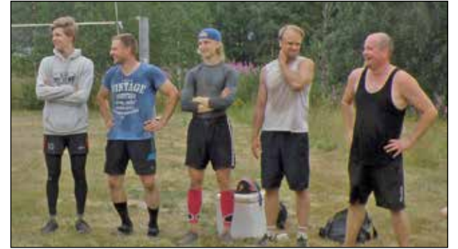
Miesten sarja voittajajoukkue Ala-Livo, sarjaan osallistui viisi joukkuetta. Kuva pui