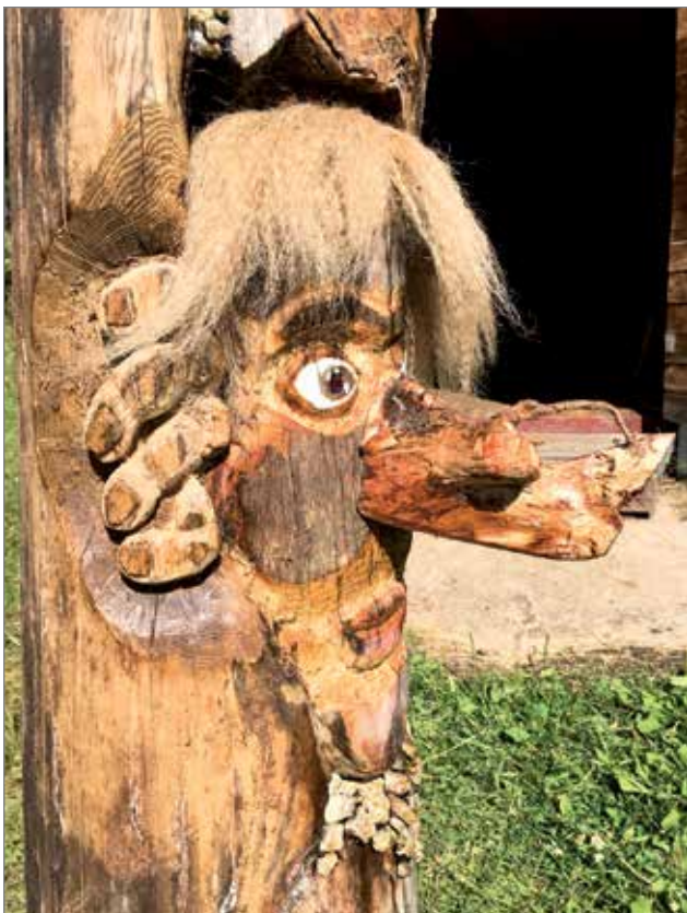
Kurkistelija peikko lähikuvassa.