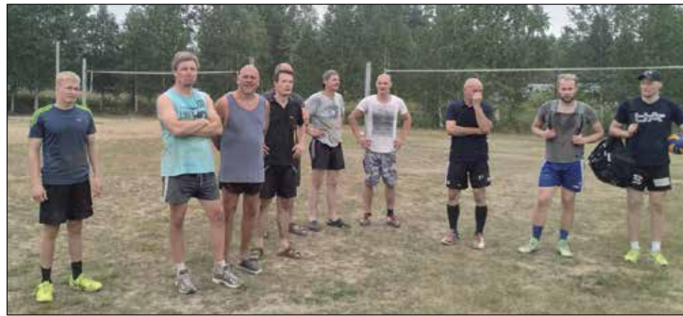
Miesten sarjan pelaajia seuramassa palkintojen jakoa.