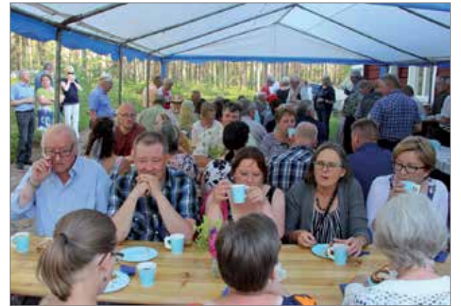
Täyte-kakkukahvit nautittiin ulkona olevassa teltassa.