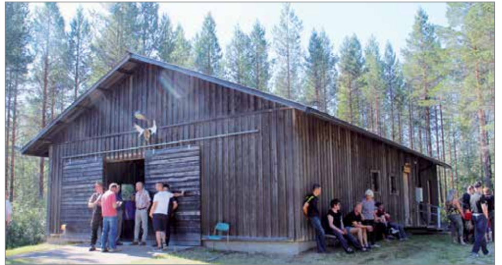
Karvasarvi-nimellä kutsuttu hirvihalli on muodostunut koko kylän toimintojen kokoontumis- ja keskuspaikaksi.

Metsästysaluetta seuralla on noin 14 000 hehtaaria, jonka Piri mainitsi olevan keskimääräistä huomattavasti suurempi. Tavallisimmin maita on 5000 hehtaarin