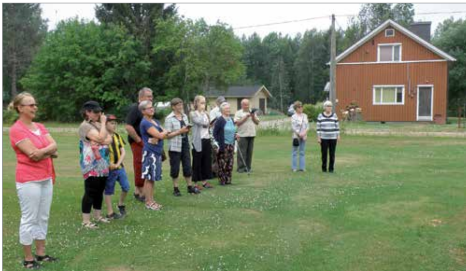
Reliefin paljastusyleisö Livon Naavalassa.