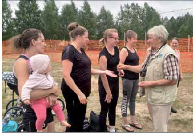
Naisten mestaruus meni Hetekylään, naisten joukkueita oli kuusi.