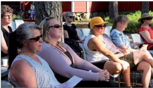
Eino Leino -runolaulukonserttiyleisöä kotiseutumuseon pihapiirissä aurinkoisena ja lämpimänä iltana.