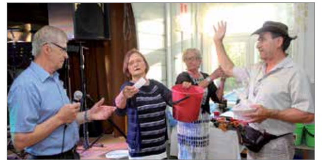
Arpajaisvoittoja oli runsaasti ja niin ollen myös onnellisia voittajia.

ollut tunnusomaista yhdessä tekeminen, toisista välittäminen ja kansalaissopu. Oinas-Panuma ehdotti hirrestä rakennettua Tönöä yhdeksi Pudasjärven hirsipääkaupungin esittelykohteeksi.