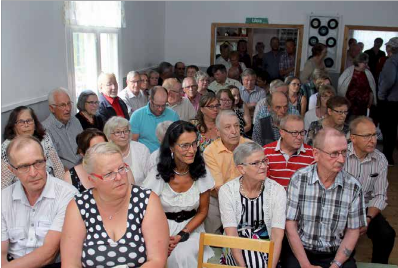
Juhlaan ja juhlatansseihin osallistui noin 130 henkilöä.