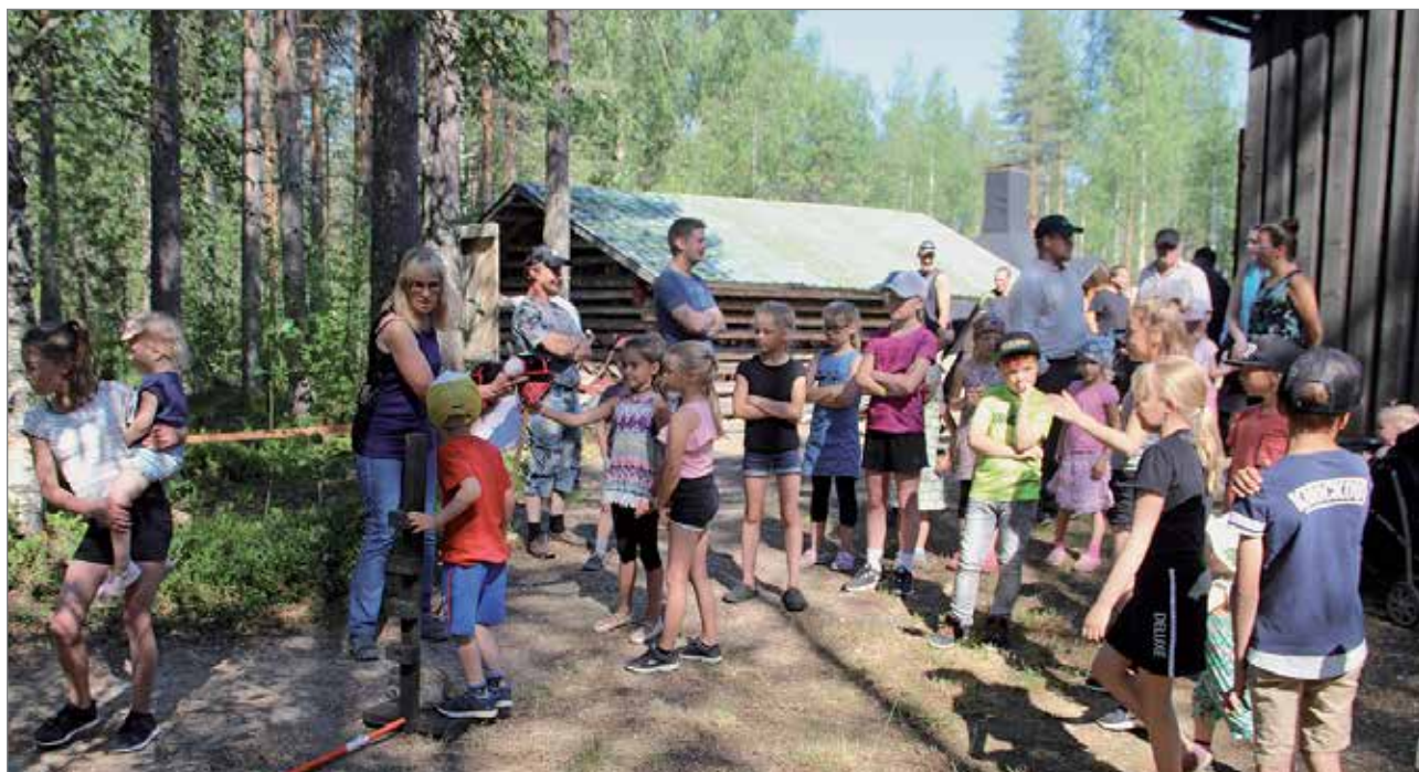
Kesäisen kylätapahtuman lasten keppihevostikissa oli kaiken ikäisille sarjoja alkaen 1-vuodesta lähtien.