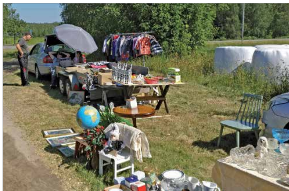
Peräkärkykirppismyyjäkin oli paikalla ja enemmänkin heitä olisi paikalle mahtunut. Kirppistavarat kävivät hyvin kaupaksi.