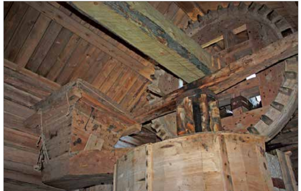
Kuusamontieltä näkyvä Sankalan tuulimylly oli yhtenä mielenkiintoisena käyntikohteena. Tuulimyllyn sydämessä näkyy myllykivien käyttökoneisto, myllykivet sekä suppilo, johon jyvät kaadettiin.

Järjestäjien kesken todettiin, että vaikka tapahtuma vaati paljon ennakkotyötä, niin se kannatti. Ja kun viimeisen viivan allekin jäi plussaa, päätettiin että vuoden päästä sama uudelleen, kun on päästy hommasta jo "kärrylle".