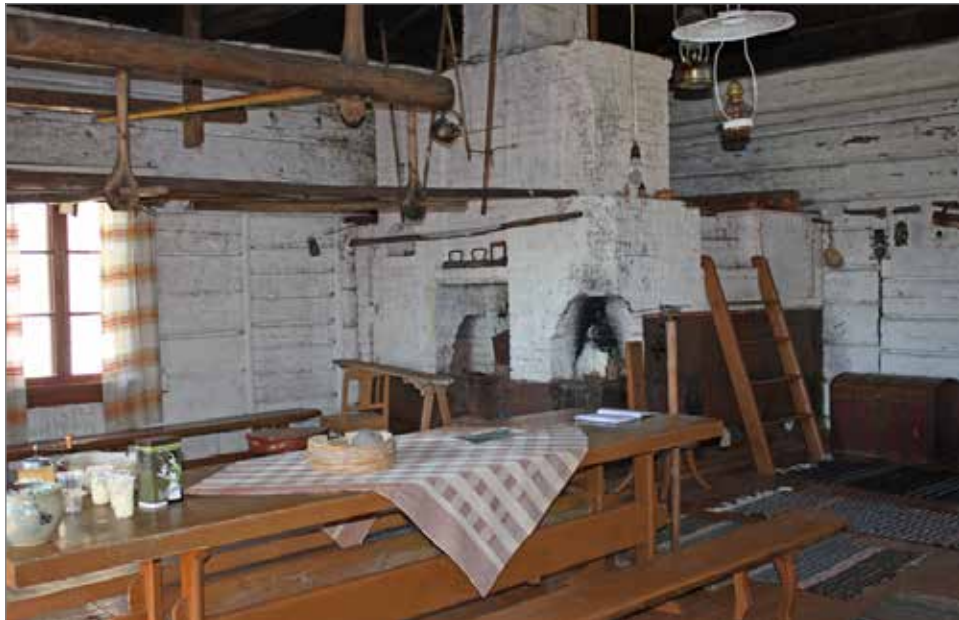
Sankalan kievaritalon pirtti. Pirtti oli alun perin savupirtti.

Teksti: Seppo Sankala, Taipaleenharjun kyläseuran puheenjohtaja