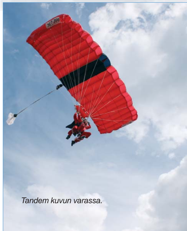
Tandem kuvun varassa.