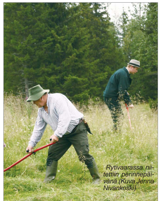
Rytivaarassa niitettiin perinnepäivänä

Tauolla maistuiivat noki-pannukahvin lisäksi kylmää hetteestä noudettu piimä ja puolukkamehu sekä räiskäleet ja ruisleipä. Nuotion äärellä pystyi seuraamaan myös villan karstausta ja näpertelemään tuohisormuksia kotiin viemisiksi. Perinnepäivä-tapahtuma työnäytöksineen on osaltaan säilyttämässä arvokasta kulttuuriperintöämme tuleville sukupolville.