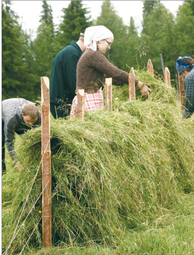
Heinät haasiolle kuivumaan