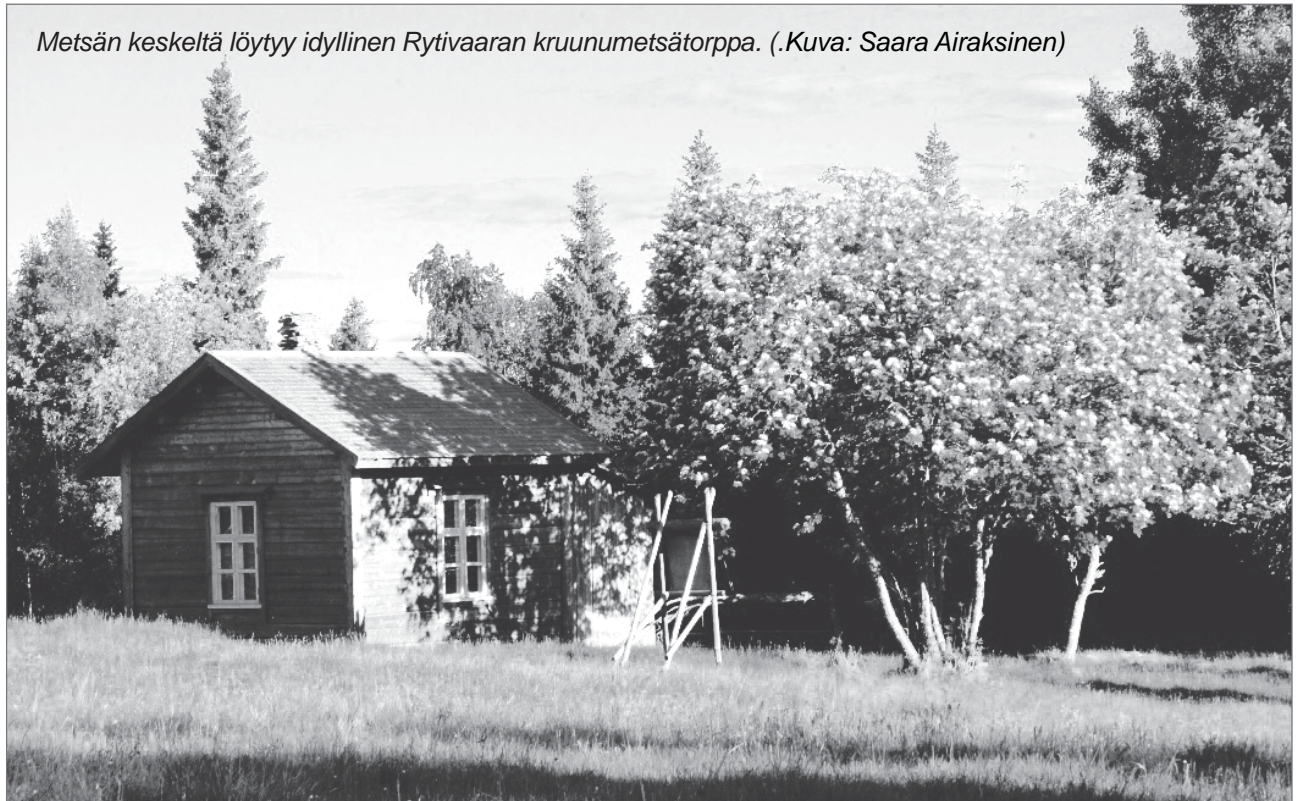
Metsän keskeltä löytyy idyllinen Rytivaaran kruununmetsätorppa.

Rytivaaran kruununmetsätorpalla vietettiin perinnepäivää hyvässä säässä lauantaina 17.7. Paikalle saapui noin 80 perinteistä kiinnostunutta osallistujaa. Metsähallituksen luontopalvelut, Sarakylän kyläseura ja Maa- ja kotitalousnaiset järjestivät yhteistyössä tapahtuman.