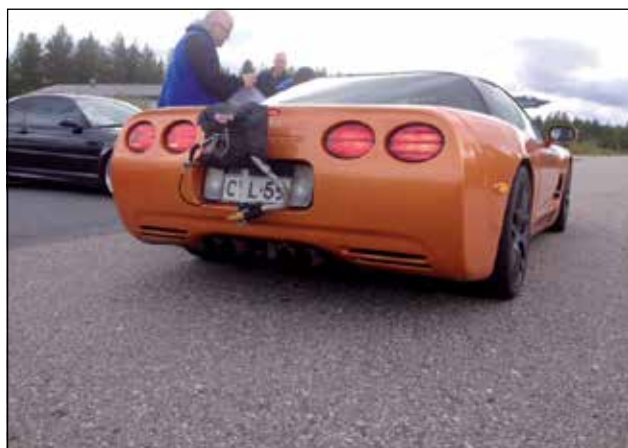
Chevrolet Corvette c5 on valmistautunut mailin vetoon!

Tietoa henkilökohtaisista suorituksista kiihdytyspäivillä ja No speed limit -tapahtumissa antaa Taivalkosken moottorikerhon omat ajanottolaitteet, jotka on kalibroitu ja ovat samaa luokkaa kuin muualla maailmassa. Näin aikakortin tiedot ovat virallisia ja verrat-