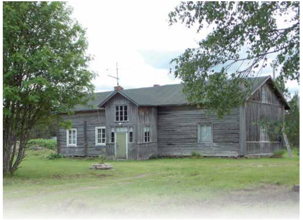
Livolla 1600-luvulla rakennettu Etilän tila entisöidään, jotta kesäkievaritoiminnalle saadaan autenttiset tilat.

Historiikkiseuran tarkoitus on vanhan suomalaisen maaseutukulttuurin ja rakennusperinteen ylläpitäminen, edistäminen sekä tunnettuuden lisääminen. Yhdistys on perustettu 1994.