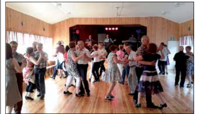
Uusitulla tanssilattialla kelpasi pyörähdellä: lattia luistaa juuri tarpeeksi muttei liikaa.