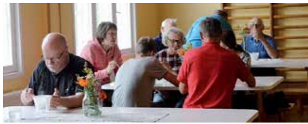
Keittoa riitti kaikille.