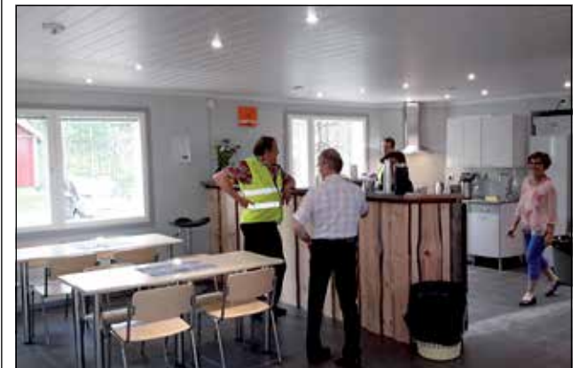
Kylätalolla on remontoitu muun muassa keittiö, joka tulee ahkeraan käyttöön.

- Mukavaa että saatiin talo tanssikuntoon kyläjuhliavarten. Muilta osin talon remontti etenee vielä ja remontin jälkeen tarkoituksena on herätellä kylätalolle ympärivuotista toimintaa. Keittiön remontti alkaa olla valmis ja nyt kesän aikana peruslämmöt vielä laitetaan kuntoon. Tulevaisuudessa myös muuta remonttia on luvassa, kuten ulkoterrassin teko. Tänä kesänä uuterat kyläläiset ovat tehneet varmasti yli 2000 talkootuntia kylätalon eteen, kiittelee Juurikka.