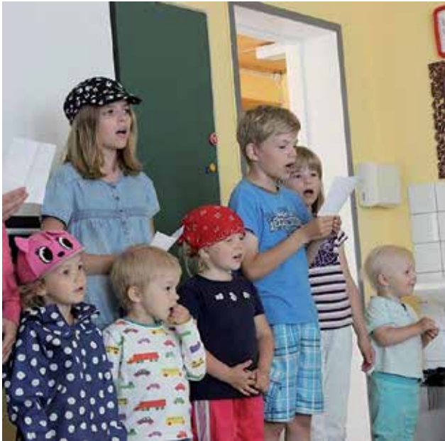
Lapset esittivät ohjelmaa.