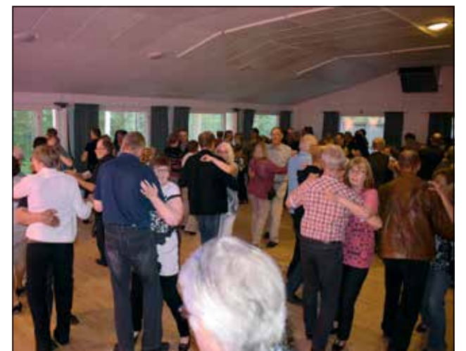
Tanssilattia täyttyi tanssijoista ja ulkonakin oli kauniilla ilmalla pihä täynnä väkeä.