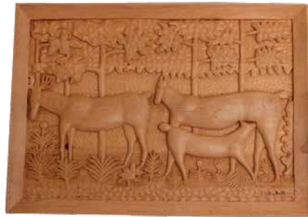
Hirvet -teoksessa on kuvattu herkkä hetki metsän laidasta, jossa hirviemo imettää vasaansa.

Lupauksensa lunastaakseen Outila on neljä vuotta suunnitellut ja veistänyt kaksi pienoismallia teoksesta. Nyt työn alla on lopullinen teos, joka muovautuu miehen korkuisesta kivilohkareesta.