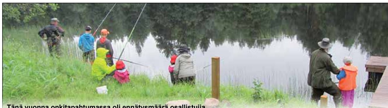
Tänä vuonna onkitapahtumassa oli ennätysmäärä osallistujia.