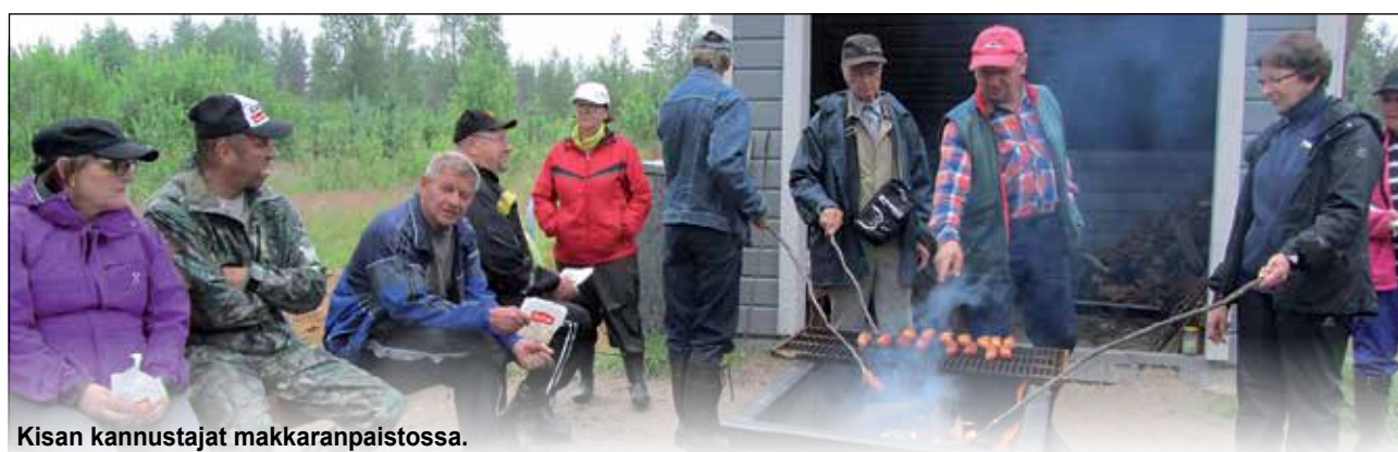
Kisan kannustajat makkaranpaistossa.