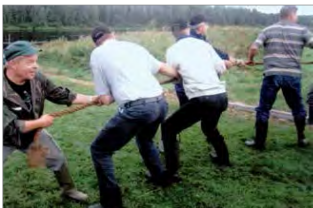
Kuvassa vuoden 2011 köydenvetokisan voitokkaat Kuren miehet.