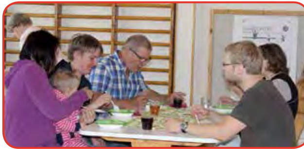
Lohikeitto maistui kaikille.