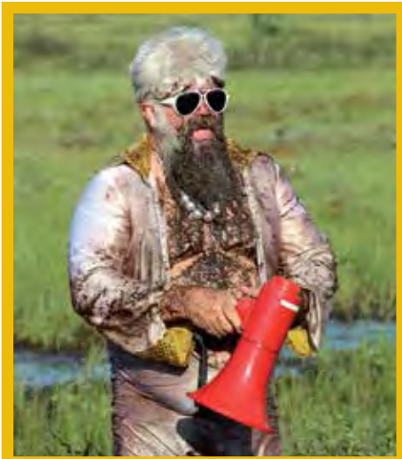
Tykkyläinen teeman mukaisessa asussa.