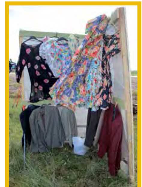
Pukinevarasto oli näyttävä. Kaikki löysivät vaatteet päälle, koska yhtään alastonta hiihtäjää ei tällä kertaa suola näkynyt.