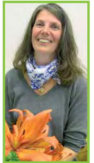
Sari Timlinin suviseurat sujuivat pitkälti ravintolatoimikunnan työhön tutustuen.