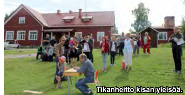
Tikaneitto kisan yleisöä.