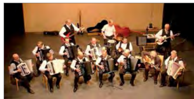
Kemijärven Työvään Viihdeorkesteri esiintyy Moskovassa 12-hengen kokoonpanolla.

tie 2941 saamme lauantaina nauttia nostalgisesta tanssimusiikista ison orkesterin