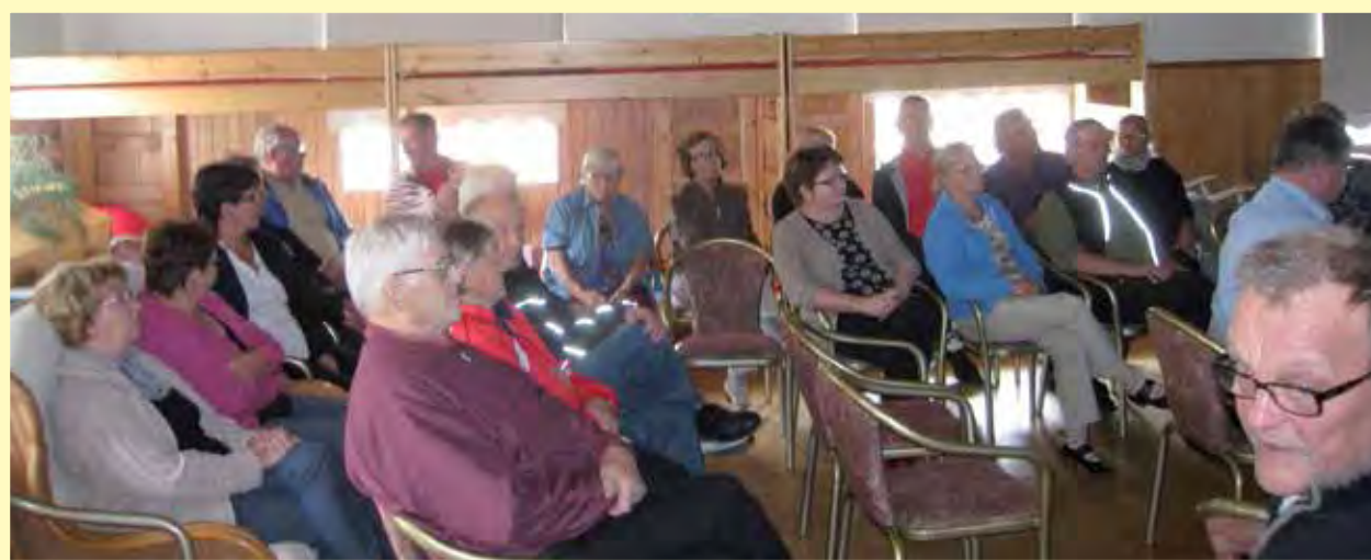
Vuosikokouksessa oli runsaasti väkeä.