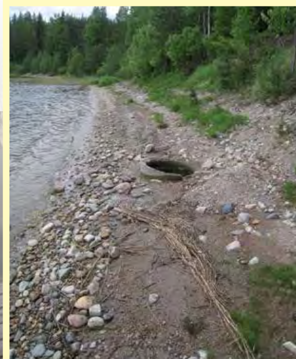
Edellisen voimalaitoksen omistajan korjaama ranta ei näyttäisi täyttävän kiviheitokkeen määritelmää.