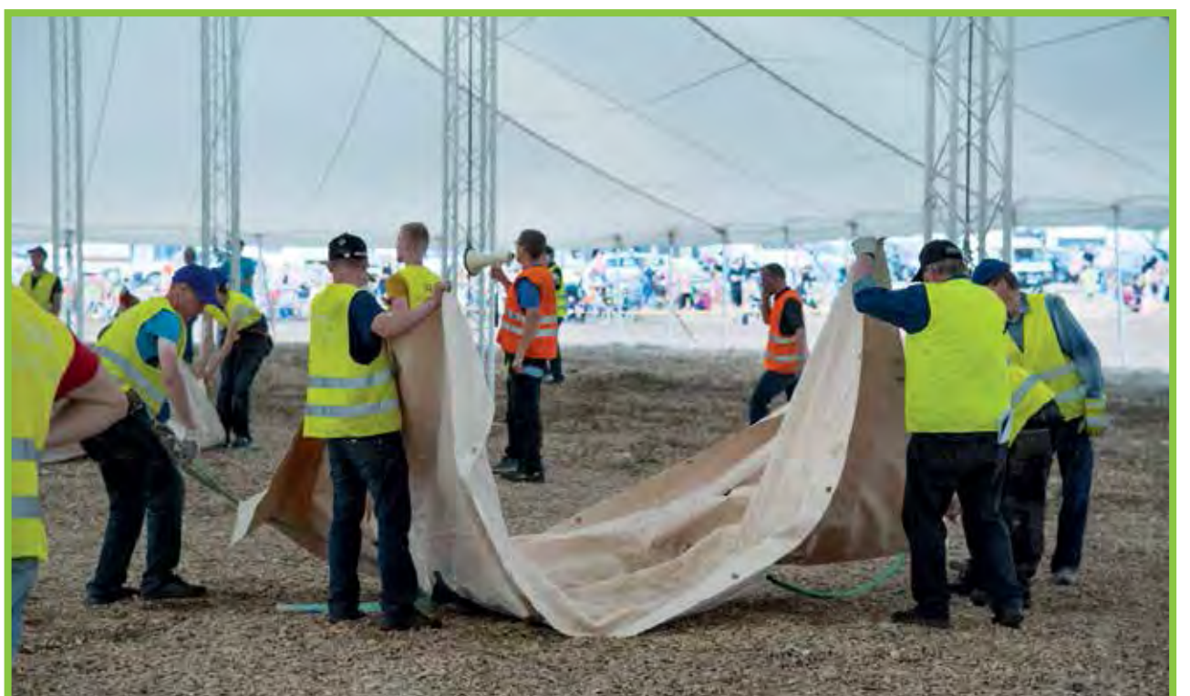
Pudasjärven suviseurojen purkaminen sujui tehokkaasti ja turvallisesti.