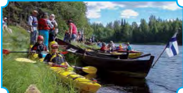
Soutuväki rantautuneena Kirkkosaaren rannassa. Sieltä matka jatkuu kohti Iijoen uomaa ja ensimmäistä koskea. Matkan varrella on sata koskea ja nivaa ennen kuin saavutaan Pudasjärven Kipinään.