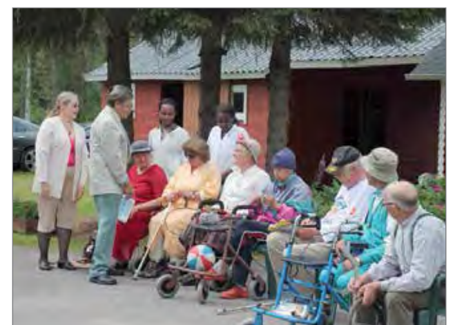
Vanhainkodin osasto kuuden asukkaan, hoitajat sekä heitä tervehtimään tullut sote-johtaja.