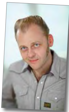
Kalle Kaaja Kulkukoironen kulkee perjantaina Jyrkkäkosken lavalle.