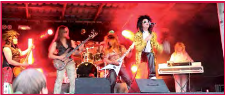
Illan päätteeksi lavalle kiipesi laulu- ja soitinyhtye Woyzeck.