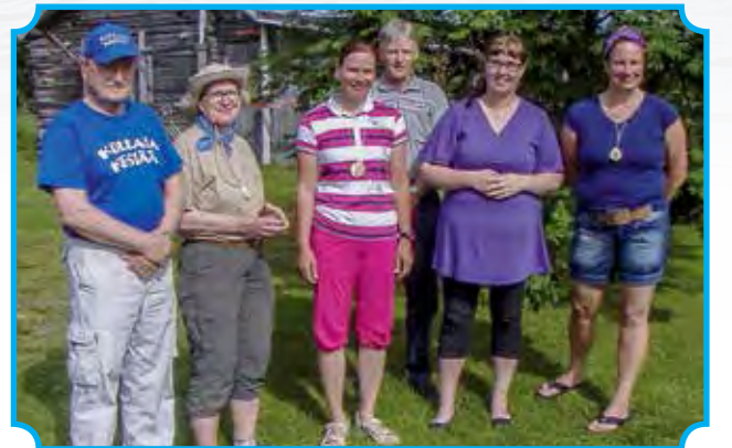
Soutajien ja melojien puheenvuoroissa tuotiin henkilökohtaisia kokemuksia ja elämyksiä esille - myös Eino Leinon päivä tuli huomioitua runonlausunnalla. Liikenneministeri Merja Kyllönen kiitti Iijokisoutua soutajille annetun kalliin perinnön puolustamisesta sanoen