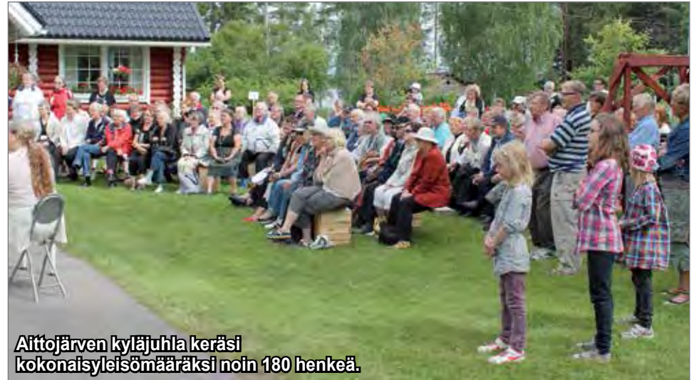
Aittojärven kyläjuhla keräsi kokonaisyleisömääräksi noin 180 henkeä.