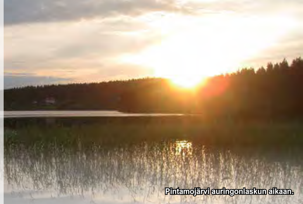
Pintamojärvi auringonlaskun aikaan.

Kattavan alustuksen ja paikalla olleen väen innokkaan keskustelun jälkeen oli yhdistyksen sääntömääräisen vuosikokouksen aika. Pintamojärvi-yhdistyksen perus-