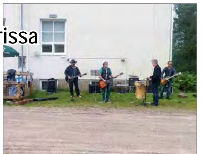
Kievarissa karaokeiltaan. Kievari oli täynnä asiakkaita. Mukana oli myös matkailijoita Venäjältä Apatiti kaupungista. JB

Rennon, iloisen ja hyväntuulisen musiikki osuuden jälkeen iltaa jatkettiin Urhon