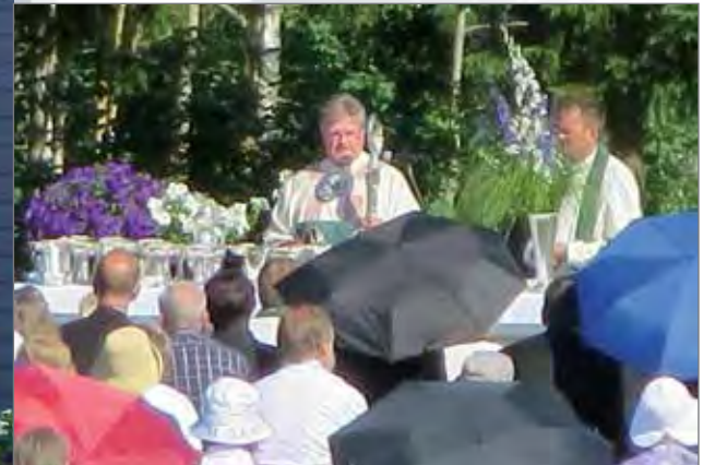
Piispan messu oli sunnuntaina juhlakentällä.