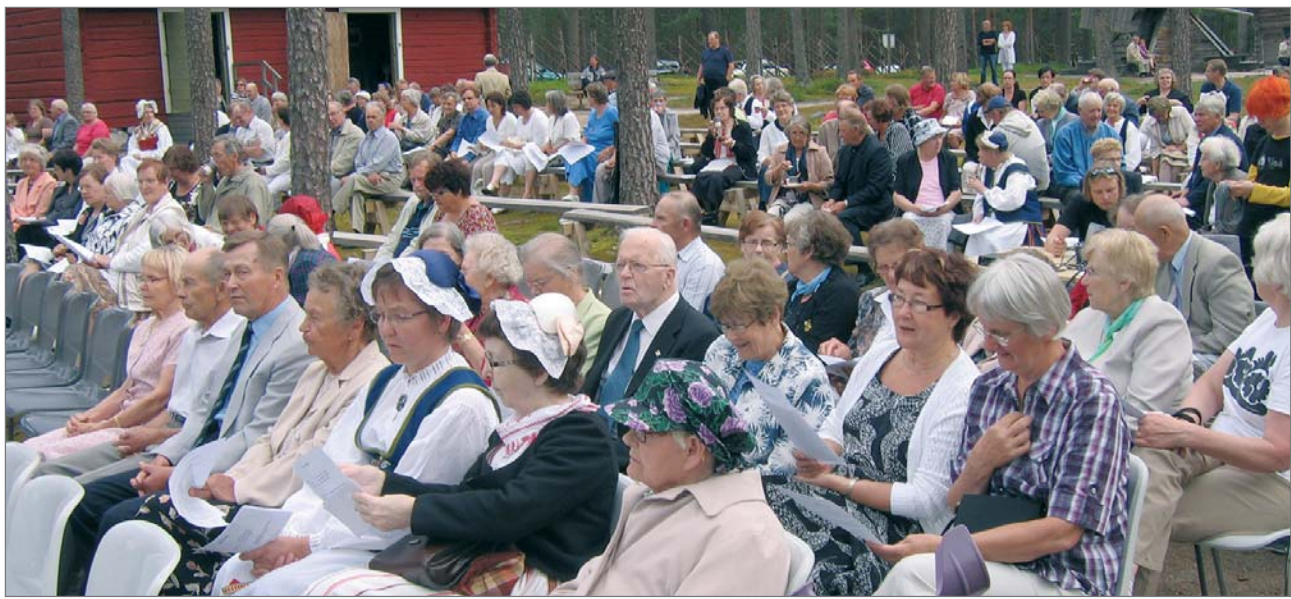
Kotiseutujuhlaan osallistuneet saivat nauttia arvokkaan ohjelman lisäksi myös hienosta kesäsäästä.

Kaupungin tervehdyksen juhlaan toi valtuuston pu-