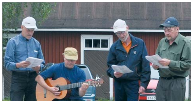
Jongun oma mieskuoro