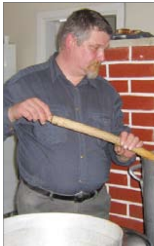
Kokki tarkistaa tilanteen.