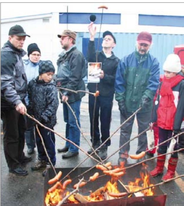
Myös nuotiossa paistetut grillimakkarat maistuivat.