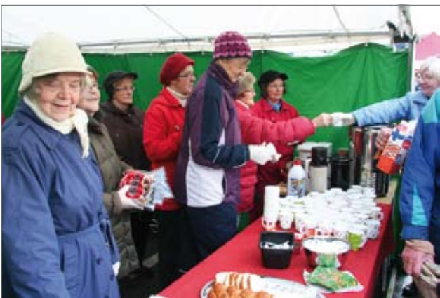
Pudasjärven Martat olivat järjestäneet kahvitarjoilupisteet.