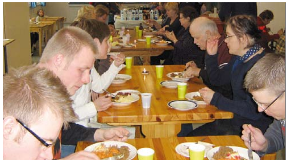
Keittoon oli käytetty kahden vasan lihat.