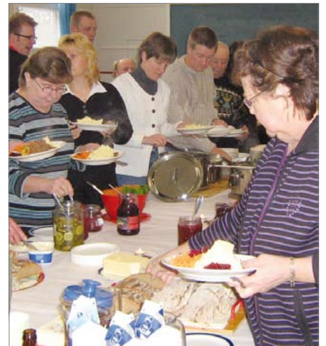
Ruokailua aloitellaan. Peijasvieraita oli 130 henkeä.

Peijaiset (murteissa myös peijahaiset, peijaat, peijaajaiset) ovat karhun tai muun ison riistaeläimen kaadon ja itse kaadon kohteeksi joutuneen eläimen kunniaksi järjestetyt pidot. Rituaalissa saaliiksi saatu eläin pyrittiin palauttamaan uuteen elämään metsästysmaille. Peijaisilla pyrittiin turvaamaan, että metsässä olisi riistaa jatkossakin. Tällaisia rituaaleja tunnetaan monilta pohjoisilta kansoilta, itämerensuomalaisten lisäksi esimerkiksi obinugrilaisilta ja Pohjois-Amerikan intiaaneilta. Hirviä on voitu peijastaa muinoin, mutta nykyiset hirvipeijaiset edustanevat uutta perinnettä. Hirvipeijaiset ovat lähinnä sosiaalinen tapahtuma joihin yleensä kutsutaan jahdissa käytettyjen alueiden maanomistajia.