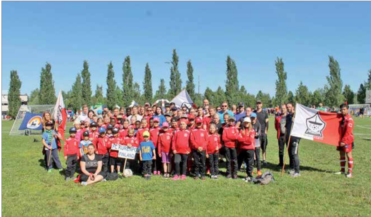
Yhteiskuvaan saatiin koottua suurin osa Kurenpoikien mukana olleista matkalaisista.

Kymmenen vuotiaissa Kurenpojilla oli edustus sekä tytöissä että pojissa. Tytöt pelasivat neljä peliä ruotsalaisia joukkueita vastaan, ja kahdessa pelissä vastaan asetui Pohjois-Suomen piirisarjasta tutut vastustajat HauPa ja ONS. Tuttujen vastustajien kanssa oli vaikeampaa, sen sijaan naapurimaan tyt-