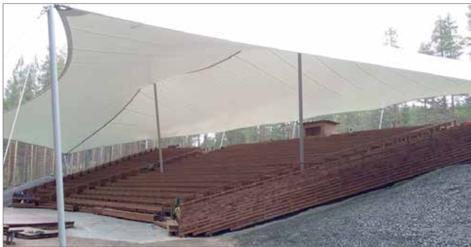
Uusi katsomo ulkoa.