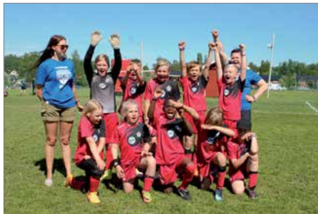
Joukkue pojat 10 v.