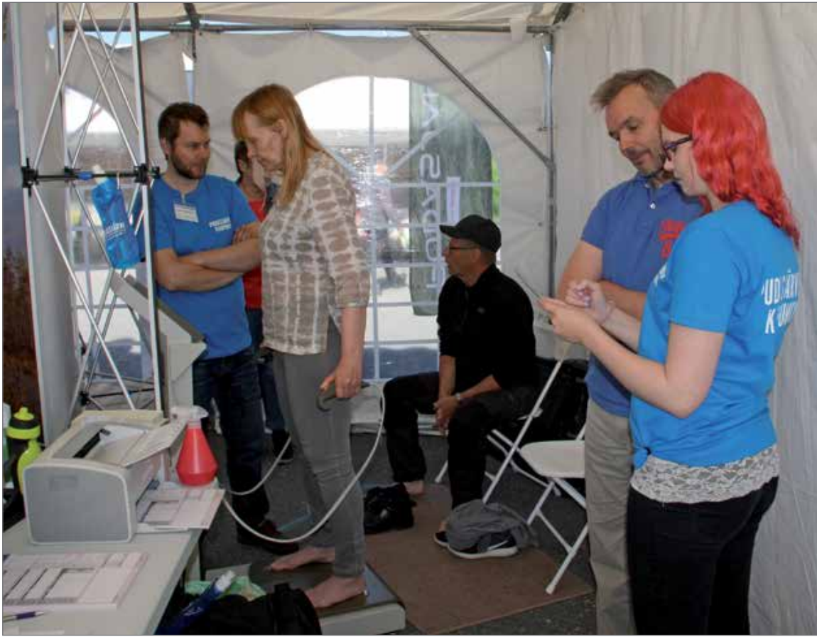
Kaupungin teltalla saivat kaikki halukkaat ilmaisen Inbody kehonkoostumus mittauksen ja myös kuntoilu- ja hyvinvointi neuvontaa.