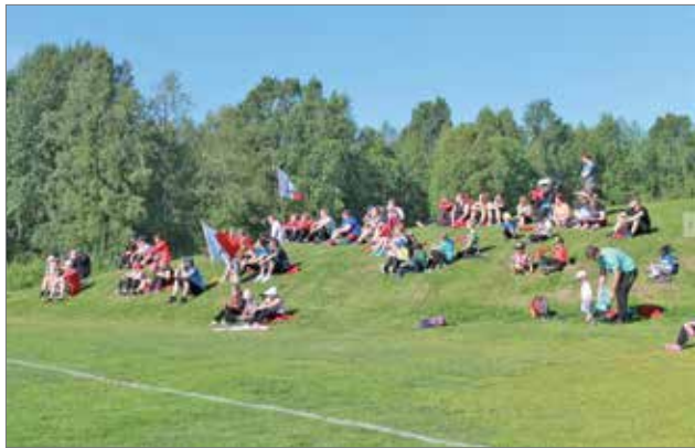
Kurenpojat oli vahvasti edustettuina paitsi kentällä myös kentän reunalla. Kotiyleisön tuki oli vahvaa pelaajille vieraskentillä.