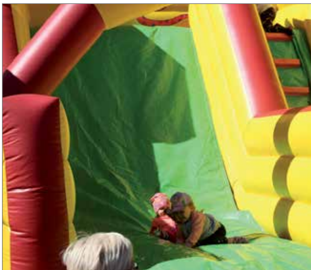
Lapsilla oli hauskaa pomppulinassa.