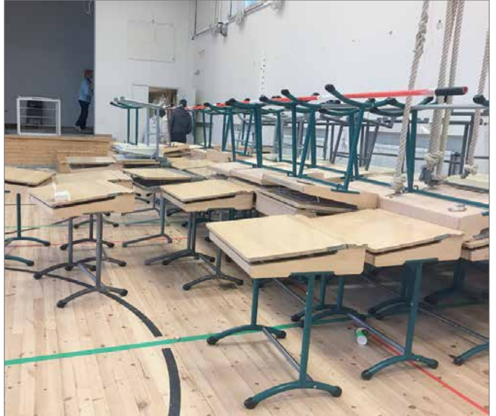
Myytävää tavaraa oli runsaasti.

nelos rakennuksessa, entisen ruokalan tiloissa. Kierrätysmyymälä on avoinna koko kesän ajan tiistaisin ja torstaisin kello 14-17. HT