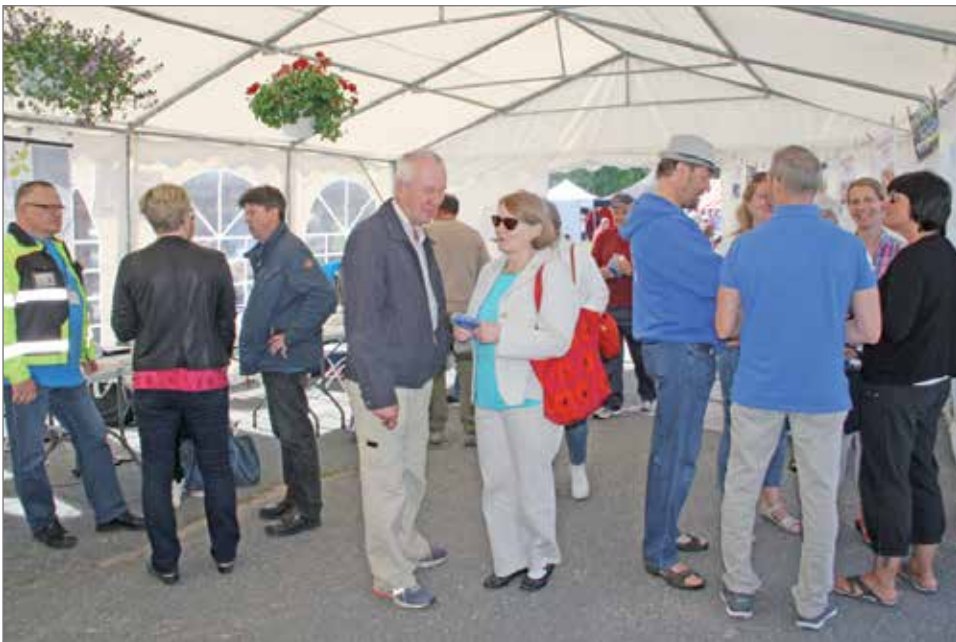
Kaupungin teltalla oli väliillä vilkastakin, kun ihmiset kyselivät eri asioista ja tutustuivat teltalla monipuoliseen kaupungin palvelujen tarjontaan.

Markkinoiden ohjelmassa oli perjantaina 7.7. kaupungin järjestämä mökkiläistilaisuus kaupungintalossa.