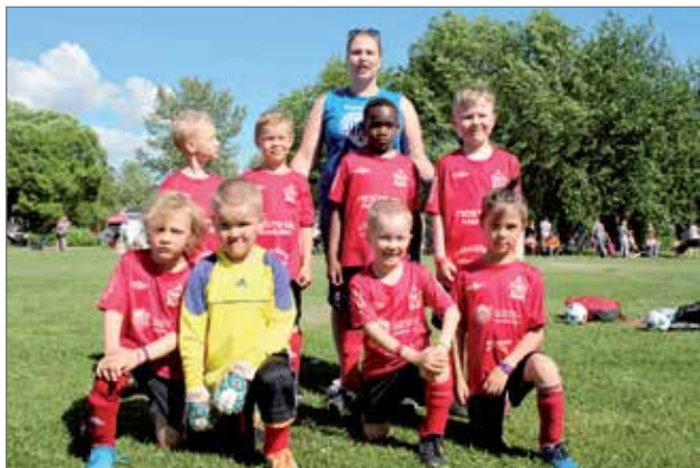
Joukkue pojat 8 v.