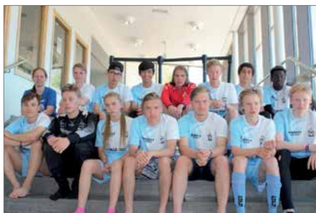
Joukkue pojat 16 v.

töjoukkueet saivat kokea pudasjärviset tytöt askeleen paremmiksi. Tyttöillä tuliaisina kolme voittoa, yksi tasapeli ja kaksi tappiota.