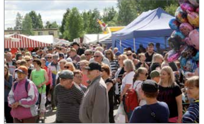
Kumpanakin markkinapäivänä oli yleisöä runsaasti liikkeellä, jopa niin paljon, että puhuttiin markkinahistorian yleisöennätyksestä.