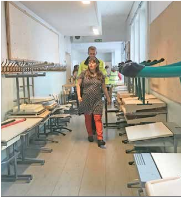
Tavaran ostajia oli vilkkaasti liikenteessä.

Jotkut kyselivät käsityöluokan höyläpenkkejä. Ne ovat käytössä Rimminkan-