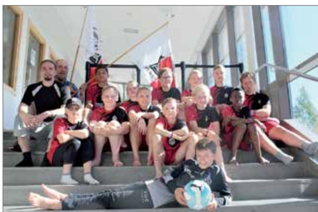
Joukkue pojat 12 v.