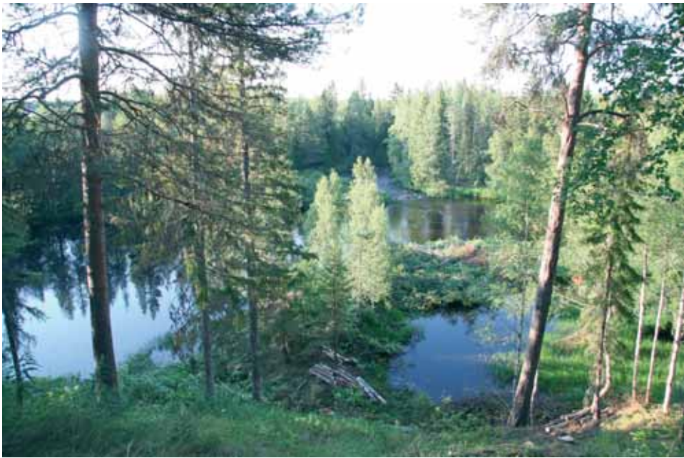
Kivarinjoki ja sen Jyrkkäkoski tuli puiden takaa hyvin esille, kun leijonat puita kaatamalla maisemoivat joen rannan.