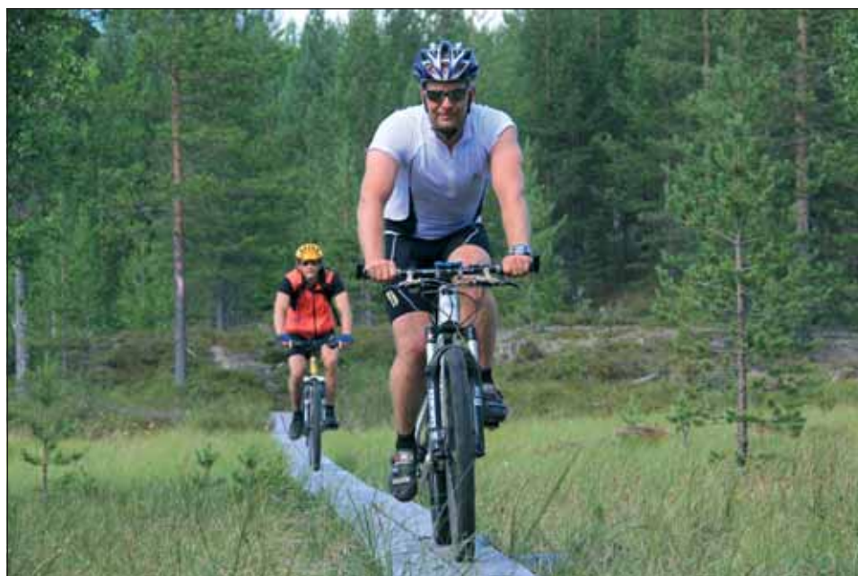
Pyöräilijöitä Portinsuon pitkoksilla Pitämävaaran lenkin varrella.

Pyöräilyreitien startti- ja päätepysäkinä palvelevan luontokeskuksen laavulla pyöräilijät nauttivat reissun päätteeksi nokipannukahvit päivän kokemuksista kertailen ja pesivät pyöränsä kuljetuskuntoon. Osa jatkoi vielä pyöräilyä omatoimisesti, osa lähti rentoutumaan Safaritalon saunan löylyihin. Maastopyöräilijät olivat reitteihin ilmeisen tyytyväisiä: kaikki aikovat palata viilettämään Syötteen baanoille!