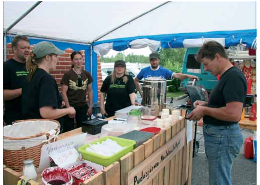
Pudasjärven MTK:n Cafe Heinämiehessä kävi muurinpohjaletut sekä muut tarjottava