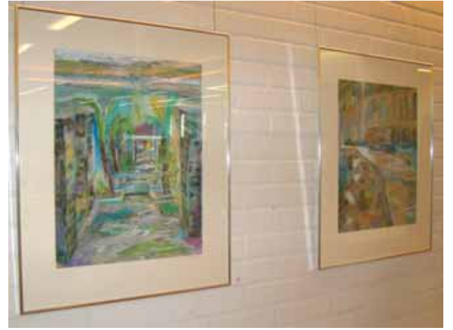
Ilkka Vainion taulut ovat helposti kaikkien nähtävillä Pudasjärven kirjaston seinillä.

Nyt nähtävillä olevat taideteokset eroavat Vainion tavanomaisimmista töistä, sillä mieluiten hän maalaa