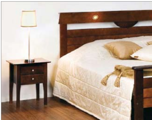
Makuuhuoneen ilmeen viimeistelee päiväpeitto, torkkupeitto ja valaisimet. Kuvassa Ella-sänky jota on saatavana tumman pähkinän ja bihunajan värisenä.