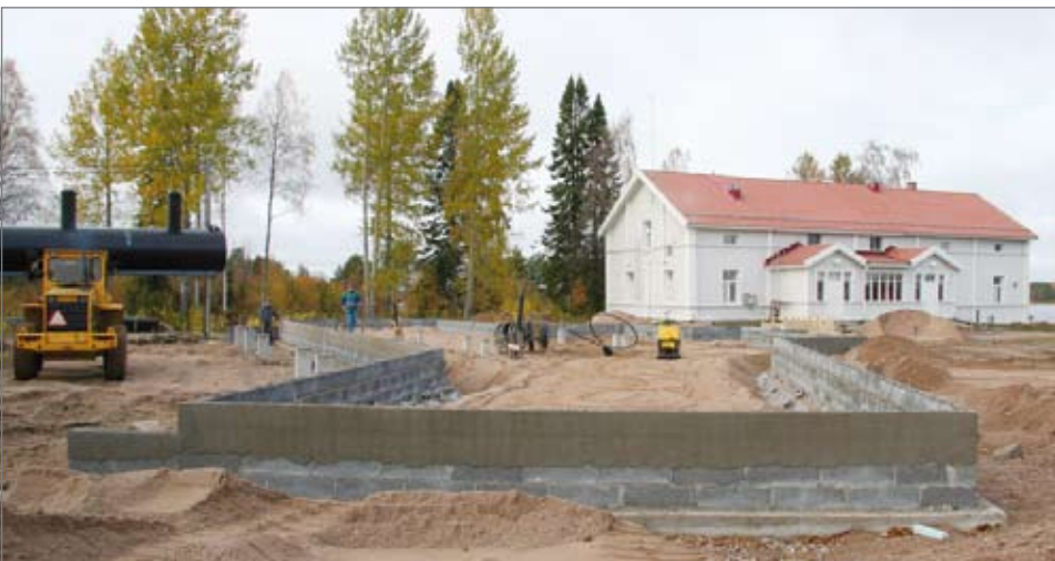
Uuden majoitusrakennuksen pohjatyöt ovat tehty ja seinät nostetaan paikoilleen tulevalla viikolla. Palaneen väentuvan paikka jäi vapaaksi ja nyt päärakennuksesta aukeaa mahtava maisema Pudasjärvelle.

Pudasjärven seurakunnalla on meneillään Hilturannan leirikeskuksessa mittava rakennusprojekti, jossa rakennetaan uudisrakennuksena majoitusrakennus sekä peruskorjataan päärakennus ja rantasauna. Lisäksi tehdään muun muassa pyörätuolia käyttävien ja vanhusten liikumista parantavia töitä. Hilturannan rakentamistyö tuli seurakunnalle eteen, koska historiallinen väentupa paloi maaliskuussa 2008.