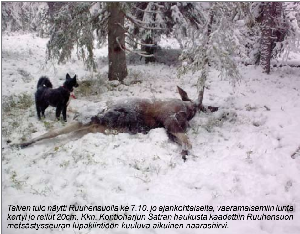
Talven tulo näytti Ruuhensuolla ke 7. 10. jo ajankohtaiselta, vaaramaisemiin lunta kertyi jo reilut 20cm. Kkn. Kontioharjun Satran haukusta kaadettiin Ruuhensuon metsästysseuran lupakiintiöön kuuluva aikuinen naarashirvi.