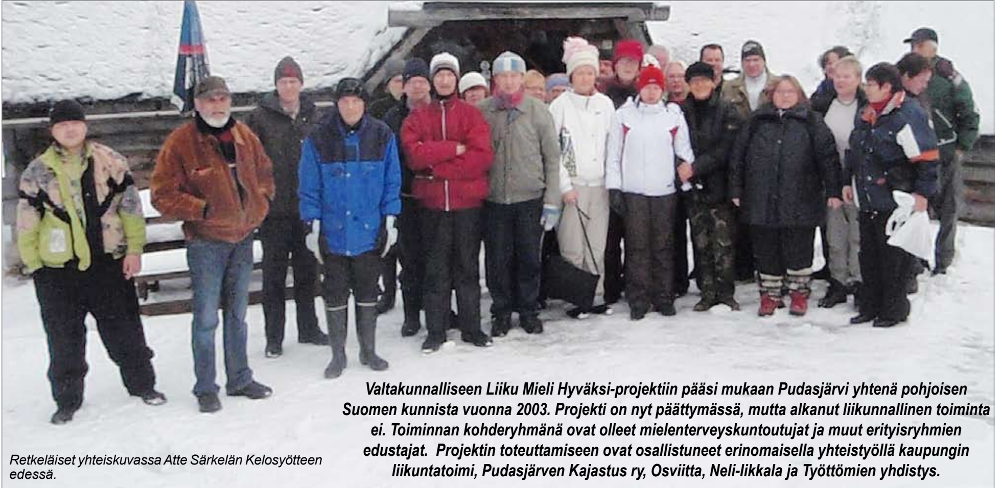
Retkeläiset yhteiskuvassa Atte Särkelän Kelosyötteen edessä.

Valtakunnalliseen Liiku Mieli Hyväksi-projektiin pääsi mukaan Pudasjärvi yhtenä pohjoisen Suomen kunnista vuonna 2003. Projekti on nyt päättymässä, mutta alkanut liikunnallinen toiminta ei. Toiminnan kohderyhmänä ovat olleet mielenterveyskuntoutujat ja muut erityisryhmien edustajat. Projektin toteuttamiseen ovat osallistuneet erinomaisella yhteistyöllä kaupungin liikuntatoimi, Pudasjärven Kajastus ry, Osviitta, Neli-likkala ja Työttömien yhdistys.