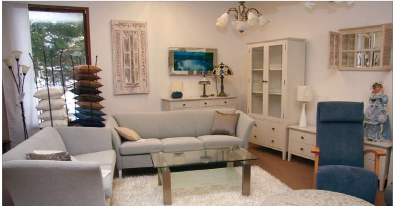
Huonekaluliikkeessä on valmiiksi sisustettuja nurkkauksia huonekaluvalintojen helpottamiseksi ja ideoimiseksi.

Mutta minun määränäpäini liikkeessä on sängyt ja patjat. Alkavat olla itselläni