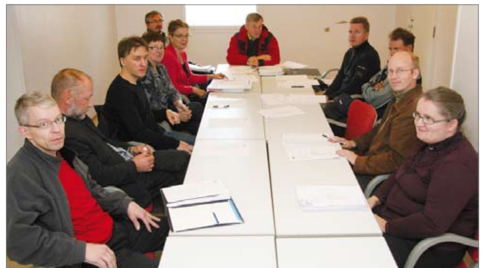
Rakentamistoimikunta pohtimassa rakentamiseen liittyviä asioita.

tehdään myös tilamuutoksia. Keittiö tulee täysin nykyaikaiseksi ja ajan henkeen sopivaksi. Ajan henkeen sopivalla tavalla tullaan kiinnittämään huomio esteettömyysvaatimukseen. Pyörätuolilla tulee olemaan aikaisempaa helpompi liikua ja tasoerojen poistamisella tilojen saavutettavuus paraneekin.