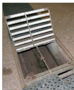
Karsinan puhdistus on helppoa. Lanta poistetaan käytävällä olevien kourujen kautta.