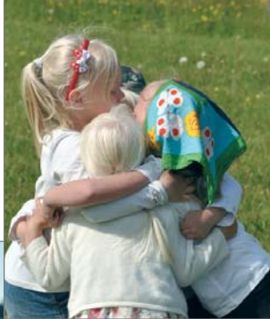
Lasten riemuja Liepeessä.