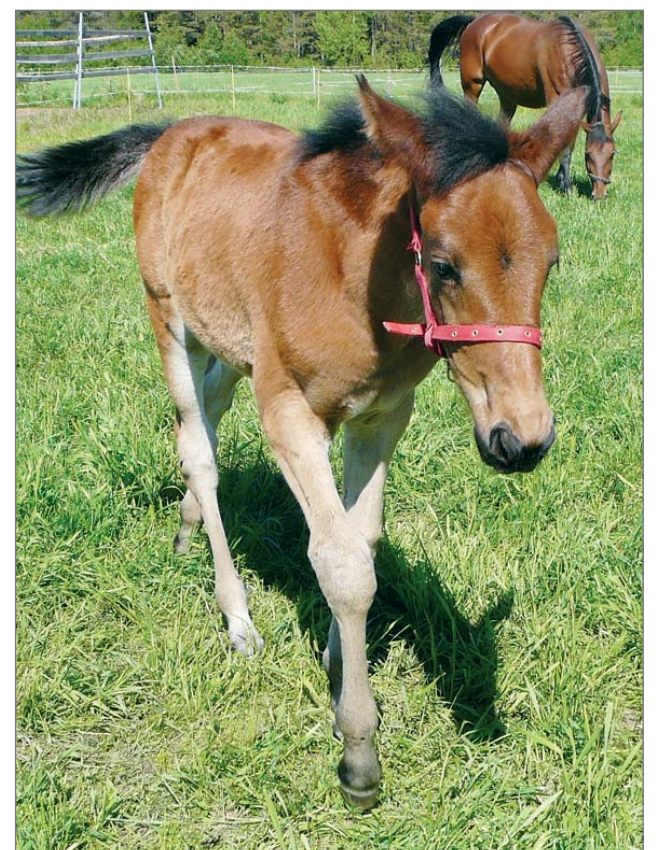
Linssilude Kivarin Zumba. Emä Prime Horline valvoo taustalla varsansa puuhia.