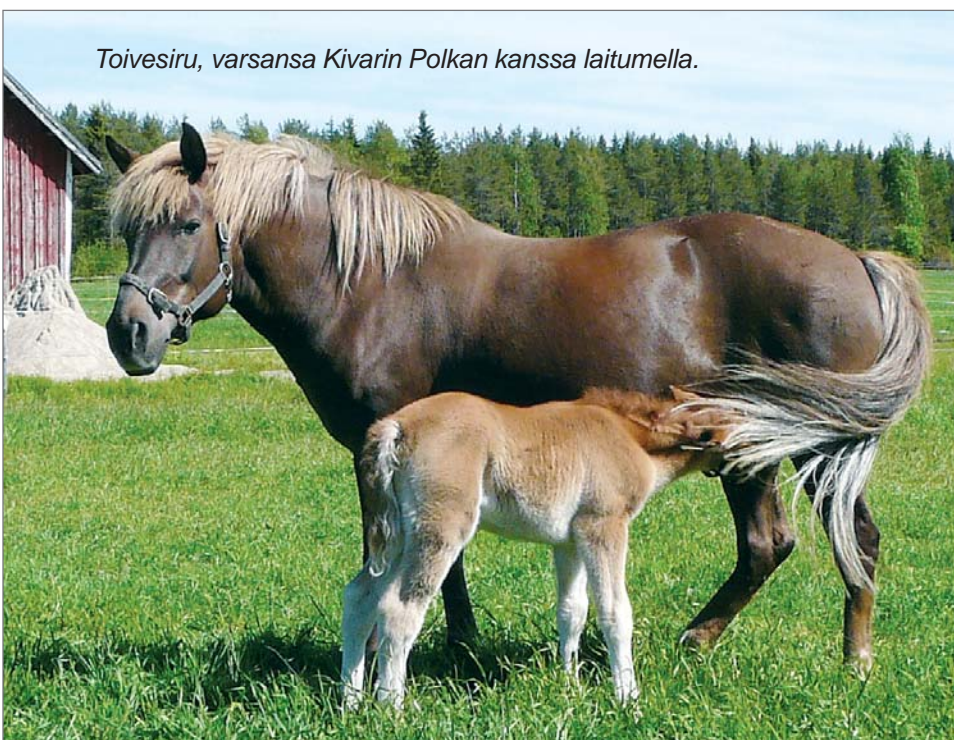
Toivesiru, varsansa Kivarin Polkan kanssa laitumella.