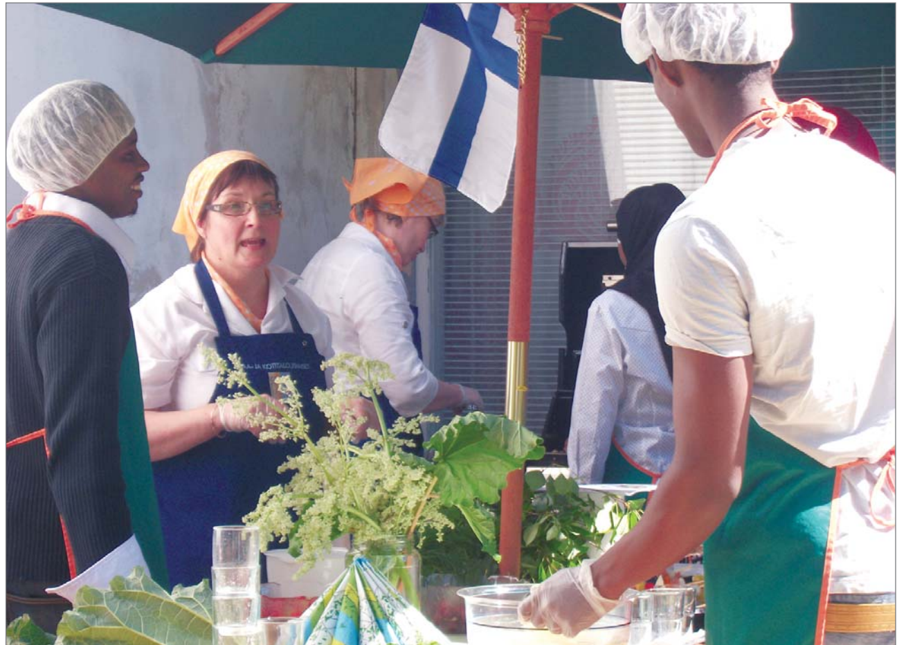
Juhannuksen juhlapöytä on katettu