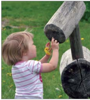
"Syöhän heppa nyt", toteaa Emmi 3v.