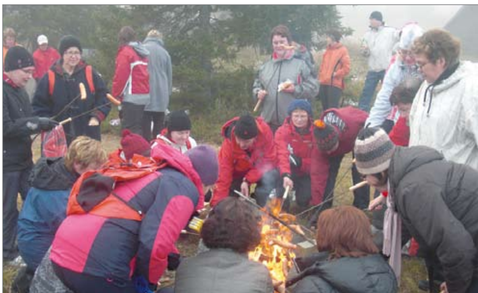
Nokipannukahvittelu ja makkaran paisto kuuluivat seminaariohjelman virkistysosioon.

keskusteluissa esille tulleesta aiheesta, Pudasjärven liittymisestä Oulun kaaren SOTE palveluihin, josta kaupungin henkilöstölle on tiedotustilaisuus 12.10.