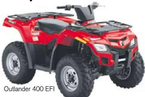
Outlander 400 EFI