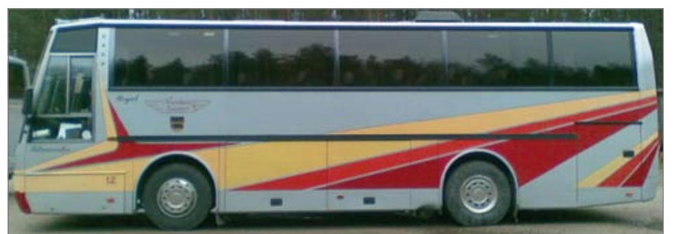
Nevakiven linja-autoon tehdään tarvittavat muutostyöt toimistobussiksi muuttamiseksi.

tokkeita pitää asentaa, johtoja vetää ja laajakaistalaitteita laittaa paikoilleen. Mutta ei tämä mikään mahdoton urakka ole, hän toteaa.