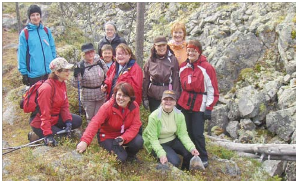
Pudasjärven Tehyläisten joukkue "Balance pipartitus tember" oli Hallan Akan reitillä jo toista kertaa.

-Tämä on yksi tapa luoda me-henkeä ja edistää työssä jaksamista, todettiin yhteisesti. Hyvähenkinen joukkue oli valmistautunut patikkamatkalle pitämällä korkean paikan leirin,