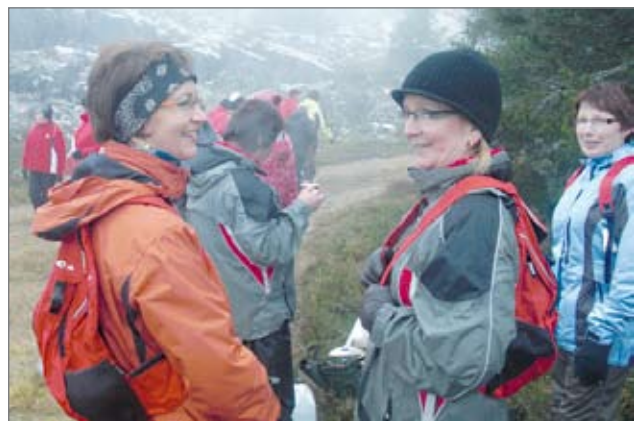
Ohjelmaan kuului myös mielen hyvinvointia lisäävää kehonliikuntaa ruskan värjäämässä Iso-Syötteen tunturissa.

neista muutoksista ja uuden valmistuvan hoitokodin palveluista. Yhteisenä aiheena em. luennoitsijat vastasivat