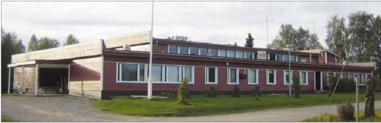
Kylätalkkareiden suurin työmaa kesällä 2009 oli Livon koulun ulkoverhouksen kunnostus ja maalaus. Nyt kyläkeskus on punavalkoinen, niin kuin vanhat perinteiset talot Pertunharjullakin.

Livokas ry on työllistänyt palkkatuella ja sitä ennen yhdistelmätuella pitkäaikaistyöttömiä. Lisäksi yhdistys on osallistunut useampaankin ESR-projektiin, joiden yhtenä päätavoitteena on ollut työllistäminen ja tarvittavien palveluiden tuottaminen Livolla ja sen ympäristössä.