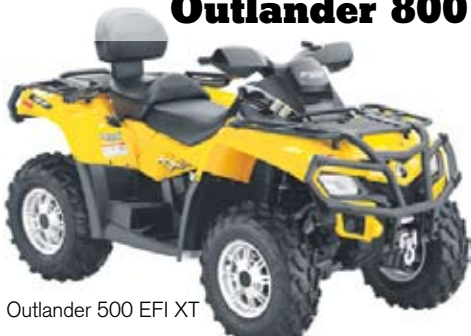
Outlander 500 EFI XT

Koeajossa vuoden 2010 can-amin uutuuksille, joissa kaikki "herkut" aina ohjaustehostimista lähtien... Mukana can-amin Outlander 400, Outlander 500 XT, Outlander 800 XT-P, lasten mönkkäri DS 90 sekä hydraulinen tukkikärry.