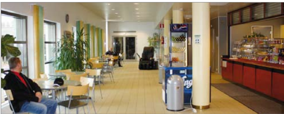
Puikkarin kahviota Pudasjärven Työttömien yhdistys on hoitanut jo elokuusta 2008 saakka. Kahviopalveluiden lisäksi kahvio järjestää kokous- ja ruokailupalveluita erilaisille ryhmille.

Suojalinnan ja työttömien yhdistyksen toimintaa tullaan kehittämään kysynnän ja kokemusten myötä. Yhdistys muuttaa Suojalinaan lokakuun aikana. (en)