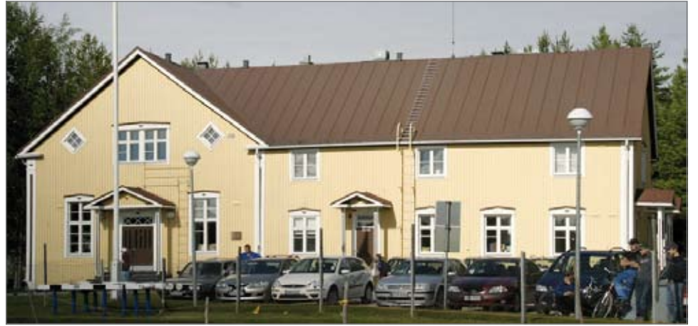
Muutto Suojalinaan tuo Työttömien yhdistykselle paljon uusia toimintamahdollisuuksia ja sen toiminta tulee Suojalinaan muuton myötä laajenemaan.