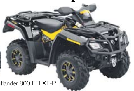
Outlander 800 EFI XT-P