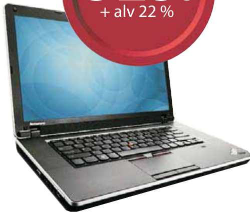
Lenovo ThinkPad® Edge Intel Core(tm) i5-430M processor

Näyttö: 15.6" TFT WXGA, HD (1366x768), LED, integroitu WEB-kamera Muisti: 2048 MB Kiintolevy: 250 GB Serial ATA II 5400 RPM Asematyypit: DVD+-RW Akku: LITHIUM-ION 6-cell Verkko: Gigabit Ethernet, Wlan b/g/n, Bluetooth Käyttöjärjestelmä: Windows 7 Professional 64 Takuu 1 v Tuotenro: NVL7QMS