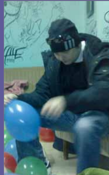
Woyzeck Oy:n toimitusjohtajan hommiin kuuluu kaikenlaista.

Keikka päättyy ja matka jatkuu mökille. Basisti jäi nukkumaan bussiin. Joku löysi videokameran, kuvataan jotain epämääräistä, joka kenties joskus päättyy youtubeen - tuskin. Tuttu kuvio: sauna ja huonot jutut.