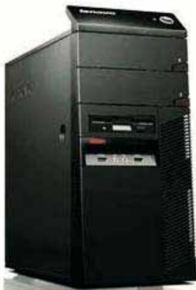
Lenovo ThinkCentre A58 Tower Intel Pentium processor E5400

Muisti: 2048 MB Kiintolevy: 320 GB Serial ATA 7200 RPM Asematyypit: DVD+-RW Drive Käyttöjärjestelmä: Windows 7 professional Takuu 1 v Tuotenro: SMKP1MX