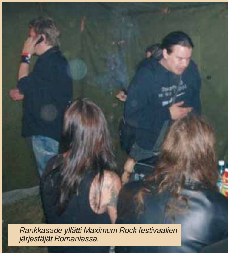
Rankkasade yllätti Maximum Rock festivaalien järjestäjät Romaniassa.

laan esiinnytty. 2008 elokuussa, kun kuvasimme siellä DVD materiaalia. Se oli sellainen yksityistapahtuma, johon otimme osaa. Vuokrasimme yhdessä Woyzeck yhtyeen kanssa julmetun äänentoisto- ja valo tsydeemin sinne. Ihan vain tuota live dvd:n kuvausta varten, tai no oli-