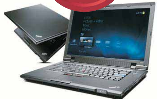
Lenovo Thinkpad®SL510 Intel Core(tm)2 Duo processor T6570

Näyttö: 15.6" TFT WXGA, HD (1366x768), LED, integroitu WEB-kamera Muisti: 2048 MB Kiintolevy: 250 GB Asematyypit: DL DVD+-RW Akku: LITHIUM-ION 6-cell Verkko: Gigabit Ethernet, Wlan b/g/n, Bluetooth Käyttöjärjestelmä: Windows 7 Professional Takuu 1 v Tuotenro: NSL7LMS