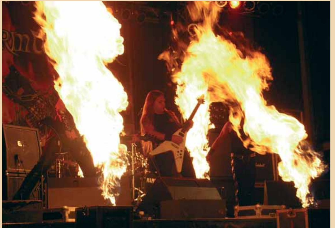
Festivaalien pääesiintyjä, saksalainen Stormwarrior esiintyy Jyrkkäkoskella lauantain käännyttyä sunnuntaiksi