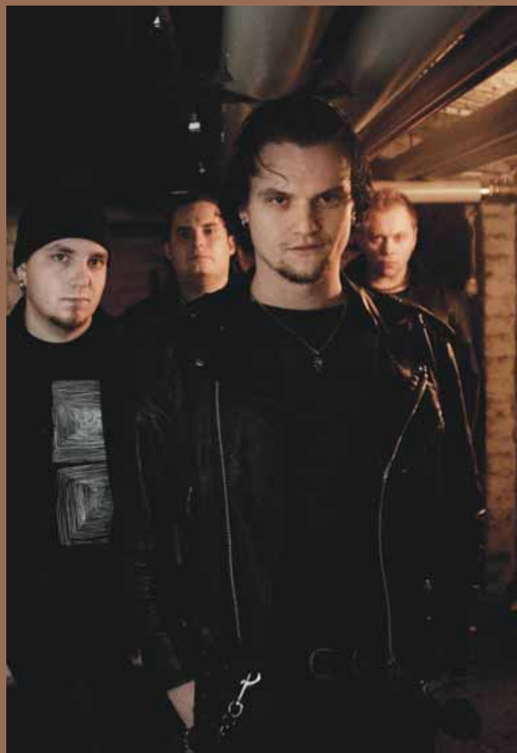
Altaria on perjantain pääesiintyjä.