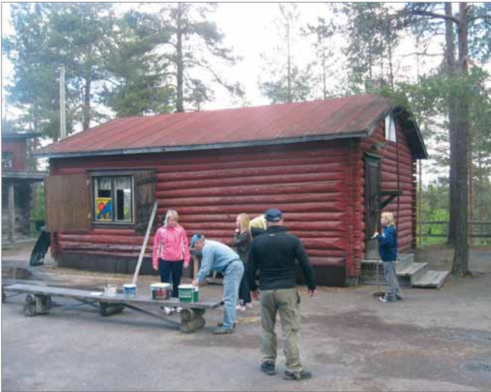
Punainen maja on tuotu Jyrkkäkoskelle hevosella jo 40-luvulla. Talkooväki on laittamassa uutta maalia rapistuneeseen pintaan.