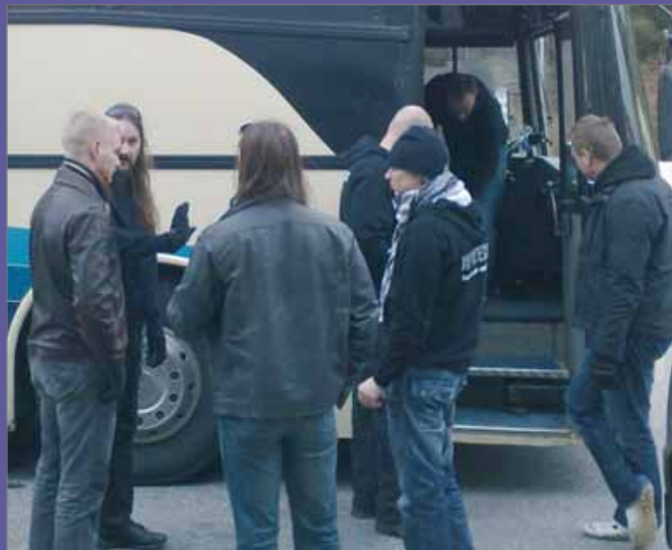
Woyzeck lähdössä Rovaniemelle vappuaattona 2010.