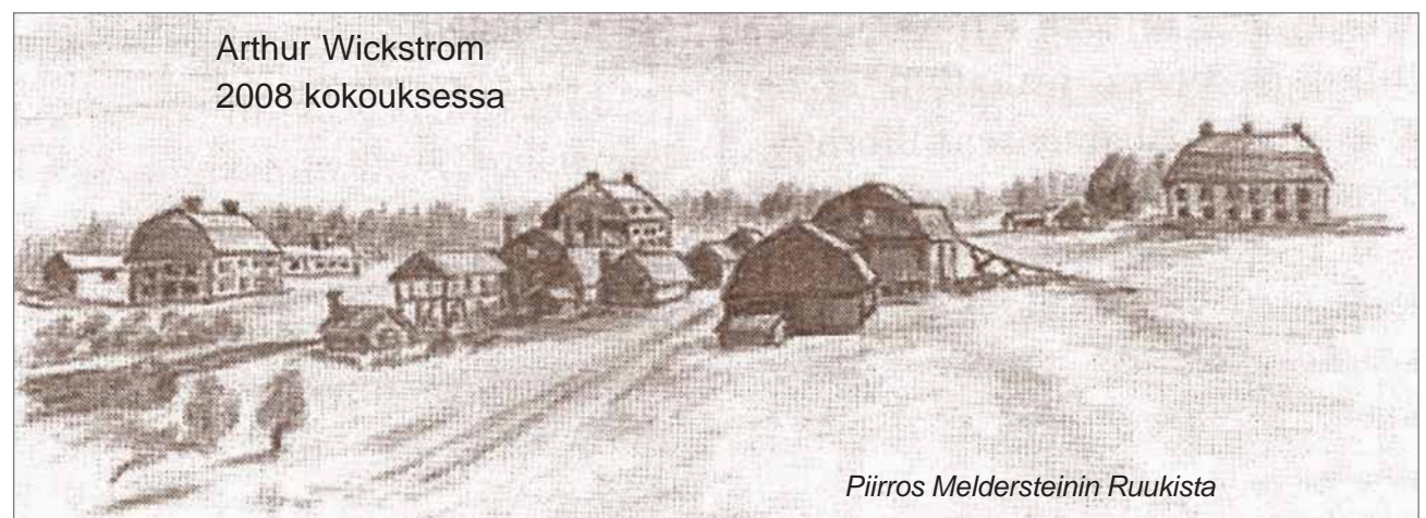
Arthur Wickstrom 2008 kokouksessa