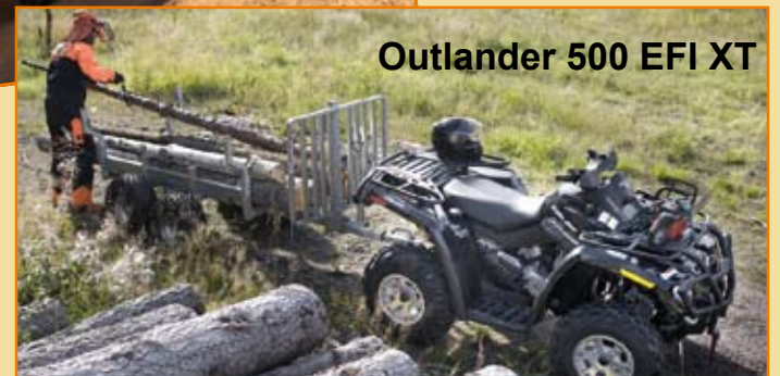
Outlander 500 EFI XT