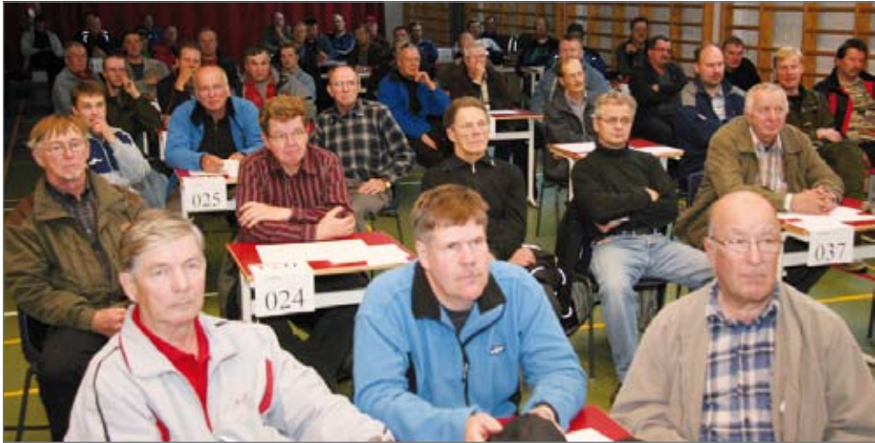
Hirvipalaverissa 22. syyskuuta oli mukana kansalaisopiston juhlasalissa reilut 120 metsästäjää.

Hirvenmetsästys alkoi viime viikonvaihteessa lämpimän syysään vallitessa. Pudasjärvelle hirvilupia oli anottu ja myönnetty 896 aikuiselle ja 859 vasalle, joten yhteensä tavoitteena on kaataa 1755 hirveä.