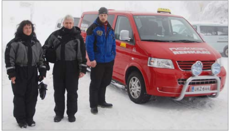
Hollantilainen pariskunta lähdössä hiihto- ja laskettelumaisemiin.