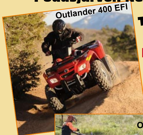
Outlander 400 EFI