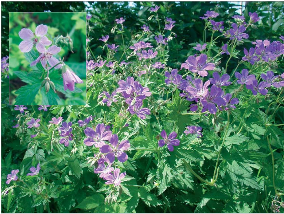
Metsäkurjenpolven kukka on näyttävä. Kukka kasvaa lehdoissa ja metsissä runsaslukuisena ja tähän aikaan vuodesta sitä ei voi olla huomaamatta.