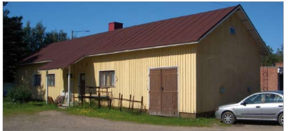
Ritolan arkistorakennus, joka toimi nykyisen Ritanlantien päiväkodin tavoin aikoinaan kunnan rakennuksina.

Kunnan toimitalona toimi vuosina 1919-1924 Kotikumpu, joka sijaitsee osoitteessa Kumputie 1.