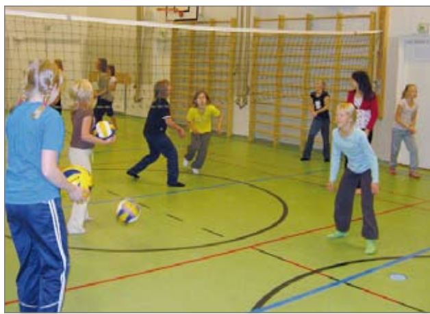
Oppilaat olivat innolla mukana pallonkäsittelyssä.

Viime viikolla vietettiin Suomen alakouluissa koululentisviikkoa. Viikon oli ideoinut Suomen lentopalloliitto ja se toteutettiin yhteistyössä urheiluseurojen ja koulujen kesken. Pudasjärveltä viikkoon osallistui Lakarin koulu kokonaisuudessaan ja oppilaita ja opettajia myös Kurenalan koululta.