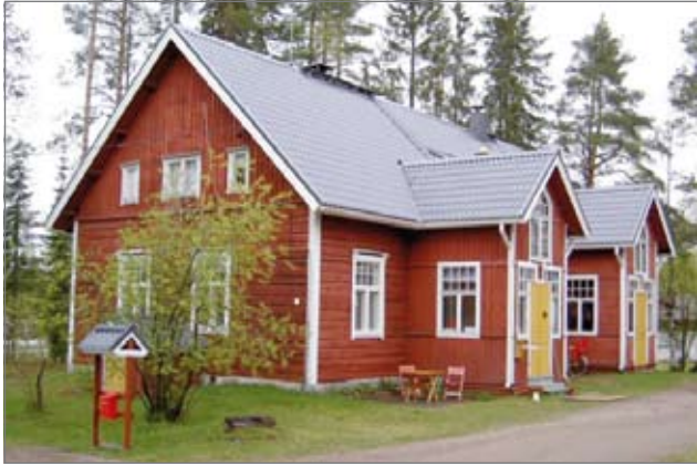
Kunnan toimitalona toimi vuosina 1919-1924 Kotikumpu, joka sijaitsee osoitteessa Kumputie 1.

Euroopan rakennusperintöpäiviä vietettiin 11.-13.09.2009. Tänä vuonna on teemana "Kunnan- ja kaupungintalot". Tähän liittyen Pohjois-Pohjanmaan kunnan- ja kaupungintalot -näyttelyn avajaiset olivat perjantaina 11.09. klo 14 Oulun kaup kirjastolla. Näyttely on avoinna 24.9.2009 saakka. Pohjois-Pohjanmaan ympäristökeskuksen hankkeena on julkaistu myös kunnantalojen verkkosivut http://www.ymparisto.fi/ppo/kunnantalot .