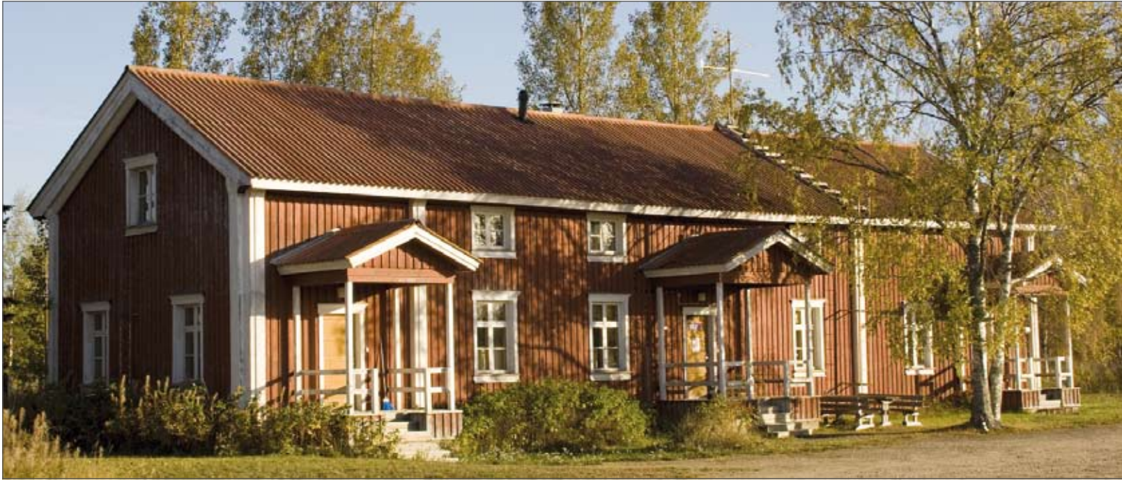
Sodan jälkeen, 1940- ja 1950-luvulla tehtävien lisääntyessä kunnantoinisto tarvitsi lisätilaa ja sitä laajennettiin lähellä sijainneeseen Pietarilan pihapiiriin, josta ensimmäinen maakauppa on vuodelta 1945.