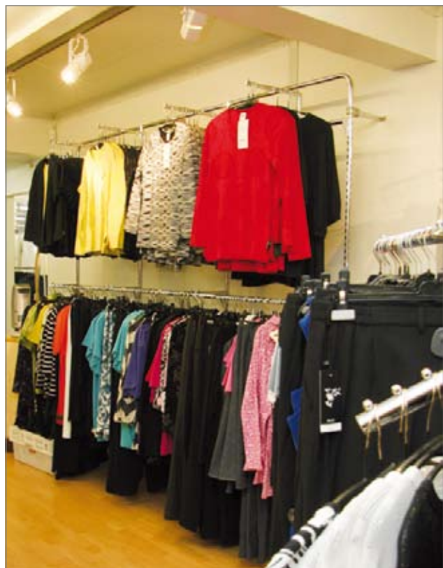
Mirkun Vaatetuksen tiloja on nyt noin 200 neliötä. Muuton myötä Mirkun Vaatetuksen valikoimasta poistuivat kengät sekä lastenvaatteet.