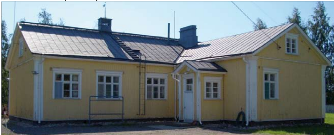
Kuvassa Ritolantien päiväkotikoti, joka on toiminut aikoinaan kunnan tiloina.

Ritolan tilalle rakennetun myöhemmän Kunnantoimistorakennuksen on suunnitellut 1936 J. Karvosen Maatalous- ja Kunnallisarakennusten Piirustustoimisto, Oulu. Valtuusto 14.-15.09.1936 § 13 "Esitettiin esityslistan nro 3 asia, koskeva lisämäärärahan myöntämisestä Kunnantalon rakentamiseen: Rakennustoimikunnan taholta tuotiin esille, että rakennus ei ole vielä aivan valmis, puuttuu pääasiassa tekevätkä lattiat ym. pienempiä töitä, menosumman ollessa kun keskuslämmitys laite 23 000 Smk maksetaan yht. noin 214 000 mark. ja rakennustoimikunnan tiedusteltua, tehdäänkö rakennustyö loppuun vaikka myönnetty varat Smk 150 000 ovat loppuneetkin, päätettiin yksimielisesti tehdä valmiiksi ja ylitetyt varat otetaan ennakkomaksujen tililtä, joista ensi vuoden talousarvion yhteydessä otetaan lopullisesti päätettäväksi, miten siihen tarvittavat varat täytteksi kunnanrahastoon järjestetään."