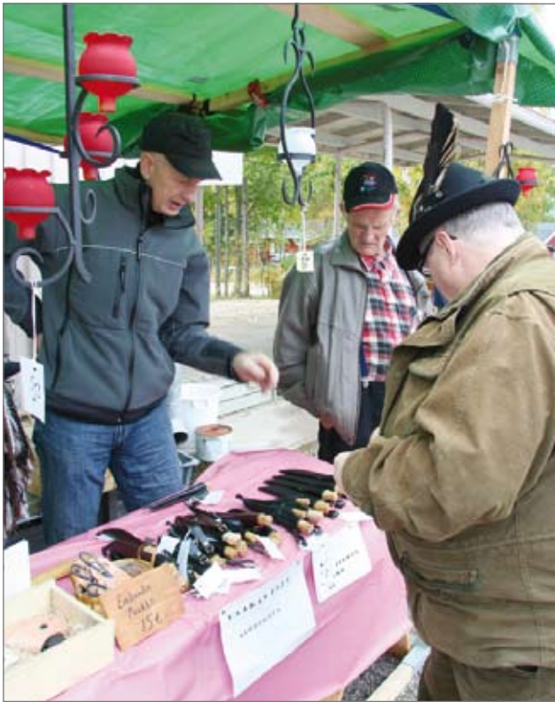
Yksityiset kauppiat olivat varanneet myyntipöytiä ja heillä oli erilaisia tuote-esittelyjä ja -myyntiä.