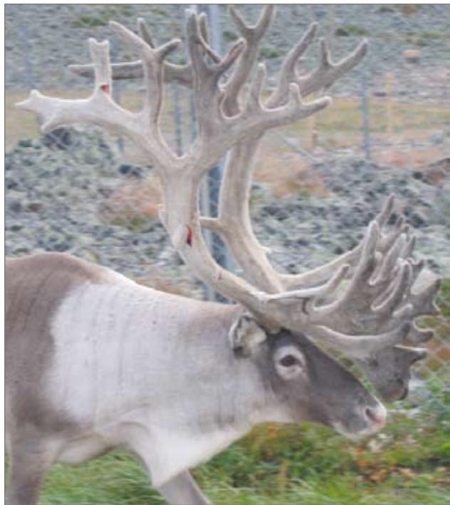
Keskikesällä poroja ei ole tienvarsilla juurikaan näkynyt, koska ne ovat vasoneet ja viihtyneet pääasiassa metsissä luontoaidin tarjoamilla ruokapaikoilla.

Pintamon paliskuntaan kuuluvien poromiesten huolena ovat jo erotukset, joissa päästään tekemään sadonkorjuuta. Viime viikolla joukko poromiehiä teki aita naurispellon ympärille, jotta porot eivät söisi nauriita liian aikaisin. Naurispeltoon porot pääsevät vasta lähempänä erotusten alkamista.