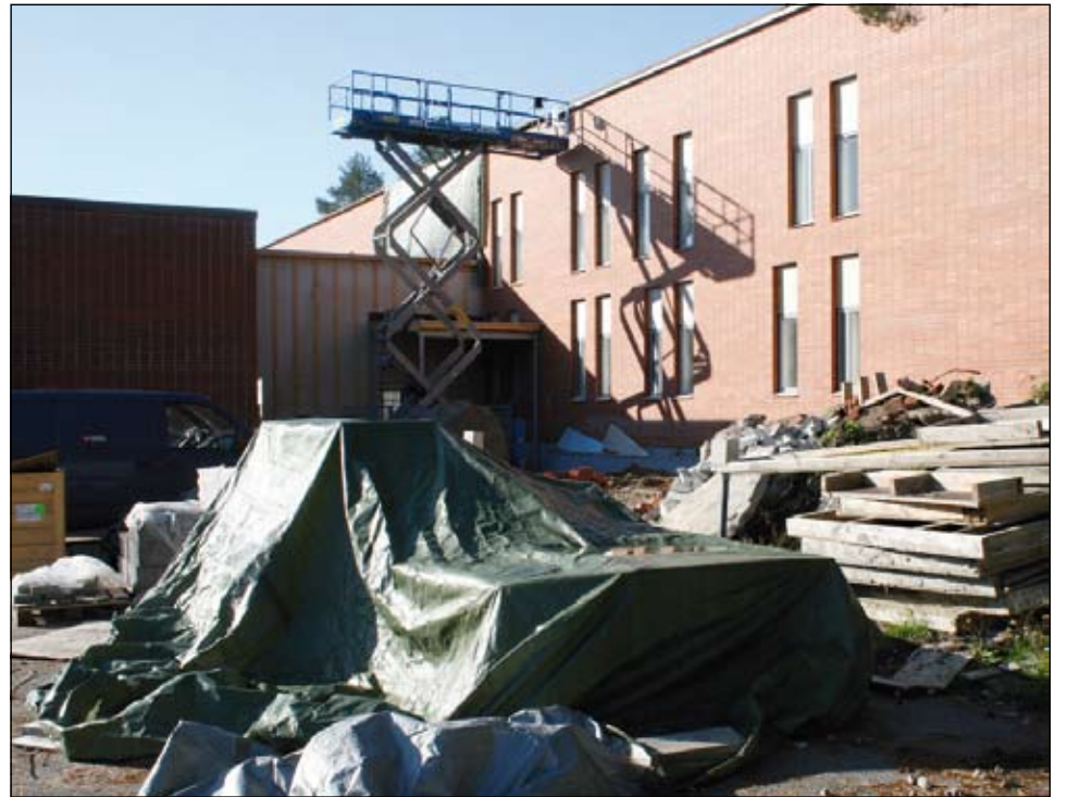
Rakenteilla oleva uusi Kurenkartano tarjoaa asumispaikan viidellekymmenelle vanhukseksi. Kaksikerroksinen Kurenkartano avataan marraskuussa.