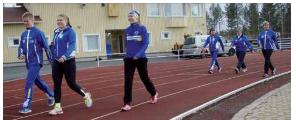
Suojalinnan urheilukentän juoksuradan pinnoite uusitaan kokonaisuudessaan noin puolelta koko radasta ja ratamaalaukset maalataan uusiksi. Koko kenttäalueen päällysteille uusitaan ruiskupinnoite. Kuva kuluneen viikon kunniakierrokselta.