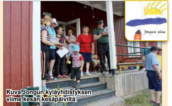
Kuva Jongun kyläyhdistyksen viime kesän kesäpäiviltä.

kun tulvat koittelivat monen kylän toimivuutta ja ennen kaikkea meille monille maanteillä kulkumahdollisuutta. Jotain pitäisi tehdä? Kyläyhdistyksen jäsenenä, olitpa mökkiläinen tai vakiasukas, voit suoraan olla aloitteellinen. Yhdessä olemme enemmän, asian kuin asian eteenpäin viemisessä. Näin nykyaikana kannattaa käydä kurkkaamassa kylän nettisivuja tai seurata alueen facebookkia, sieltä löy-