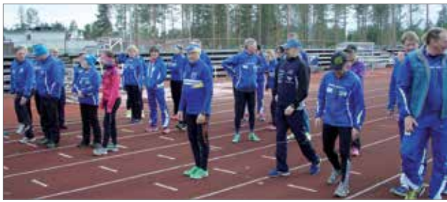
Perinteinen kunniakierros lähtötunnelmissa.

Kunniakierros järjestettiin tänä vuonna jo 33. kerran. Juoksijoita Suojalinnan kentällä oli noin 50 henkilöä, ja tuottoa kertyi noin 6 000 euroa. Pudasjärven Urhei-