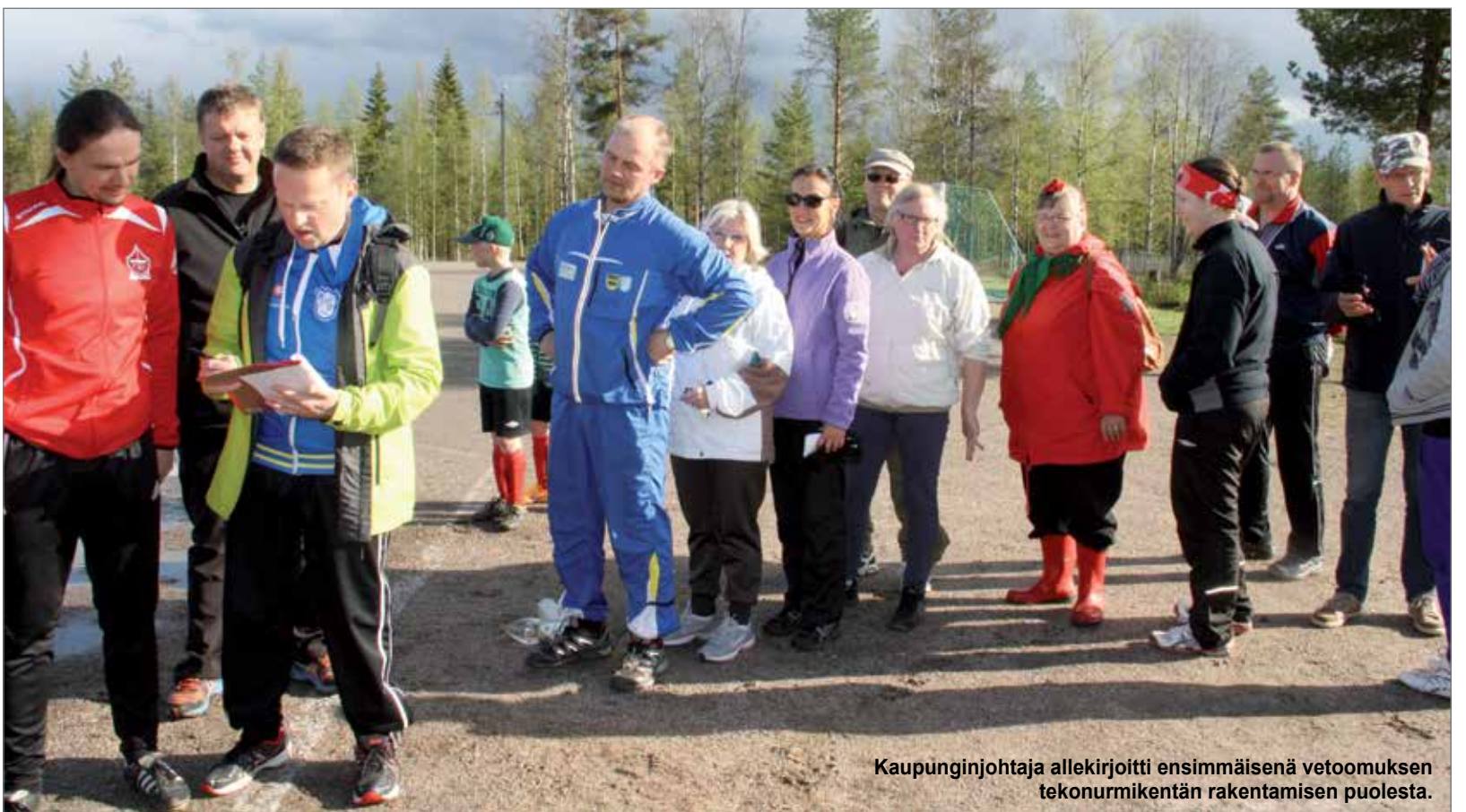
Kaupunginjohtaja allekirjoitti ensimmäisenä vetoomuksen tekonurmikentän rakentamisen puolesta.