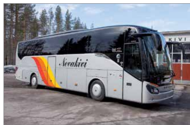
Nevakiven uusin auto Setra on hankittu reilu kuukausi sitten.

Nykyisin museoautona Oulun Automuseossa oleva yhtiön ensimmäinen auto T-Ford on näytteillä torstaina 4.6. juhlapäivänä Koskenhovin pihalla.