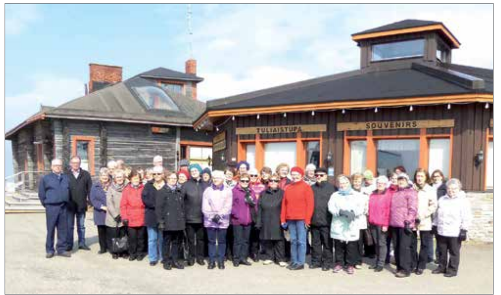
Kaunispään huipulla Tuliaistuvan edustalla otettiin ryhmäkuva.

Torstaiaamuna aamupalan jälkeen lähdimme paluumatkalle. Tulomatalla saimme tutustua Rovaniemen