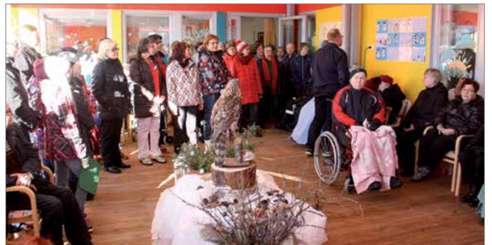
Kurenkartanon katetulle ulkoterasille rakennettu taikapuutarha on näyte ikäihmisten asumis- palvelujen arjen monipuolistamiseksi. Kuva taikapuutarhan avajaisista keväällä.

Valtakunnallisten suositusten mukainen palvelurakennetyö on edennyt, ja painopiste on siirtynyt ma-