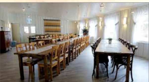
Kaisun sali on tilava ja valoisa monikäyttötila.

Meriläntie 1 Utajärvi, puh. 050 382 0206, www.merilankartano.com