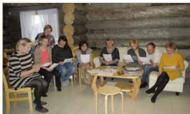
Kotiranta matkatoimisto Kostamuksessa järjestää suomenkielen kursseja halukkaille. Saimme olla päätöstilaisuudessa mukana.