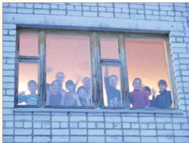
Borovoin lapset vilkuttivat ahkeraan ja lähettivät terveisiä ja kiitoksia uusista sähkömailoista.

Ps. Seuraava kesselikirje ilmestyy kesän jälkeen