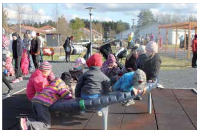
Tapahtuma keräsi paljon väkeä ja viilskettä riitti.

Pudasjärven vanhempainyhdistys ry järjesti viime vuoden tapaan kaikille avoimen ulkoilutapahtuman Rajamaan rannassa maanantaina 11.5. Tapahtumassa juhlistettiin samalla yhdistyksen kaksivuotista taivalta. Tapahtumaan osallistui yli 100 kävijää, osanottajamäärä ylätti järjestäjätahon positiivisesti! Paikallinen K-supermarket lahjoitti tapahtumaan 80 makkaraa ja osanottajamäärän vuoksi makkarointa käytiinkin ostamassa lisää tapahtuman aikana. Makkaratarjoiluun lisäksi tarjottiin mehua ja pullaa maksutta, ja hyvin ne tekivätkin "kaupansa". Sää suosi ulkoilijoita, aurinko paistoi suurimman osan ajasta ja lapset viihtyivät silminnähdessä. Ohjelmassa oli leikkimielisiä kisoja, kasvomaalausta, saippuakuplien puhaltelua ja mukavaa yhdessäoloa kuulujaisia