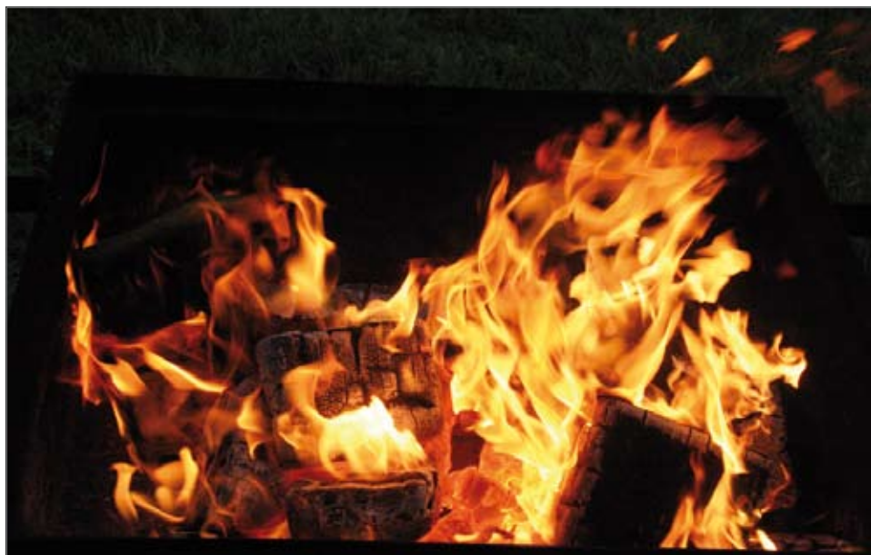
Elävää tultakin näki tapahtumapaikan roihuissa, jotka valaisivat kivasti pimeän tultua.

län laittamaa ruokaa sekä Hilimojen teltalta lettuja, kahvia sekä grillattuja makkaroituja. Lisäksi oli tarjolla olutta, siideriä, lonkeroa ja viiniä. Ihmisiä alkoi tulla sisään klo 19. Ilkka Hakala & Sonetti orkesteri aloitti soittamisen klo 20. Loppuillasta tanssijoita oli niin runsaasti, että seuraavalla kerralla täytyy tanssilattiaa suurentaa. Pääsylipun lunastaneiden kesken arvottiin kahden hengen Venetsian matka. Voittoarvan numero on C 4609025.