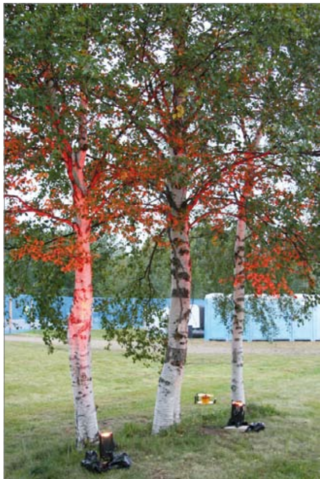
Osa tapahtumapaikan koivuista oli valaistu kirkkailla väreillä.