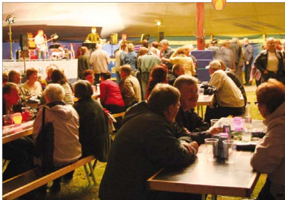
Tapahtumateltassa oli oikein mukava ja iloinen tunnelma. Odotukset väkimäärän suhteen olivat korkealla ja ne täyttyivät – jopa yli odotusten. Venetsian matkan arvontaan oikeuttavia numeroituja lippuja myytiin yli 800 kpl.

Lapsille oli myös päivällä MLL:n järjestämää ohjelmaa muun muassa lasten karaokea. Osallistujamäärä