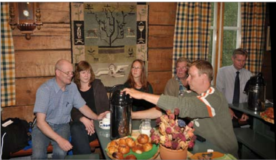
Jussilan Pirtin historiaa uhkuvat puitteet Syötteellä loivat tunnelmaa Pudasjärven kaupungin tarjoamassa Yrittäjäillalla viime viikolla.

Hyviin hankkeisiin olisi jopa rahaa saatavissa, jos vain mittakaava on riittävän kunnianhimoisen.