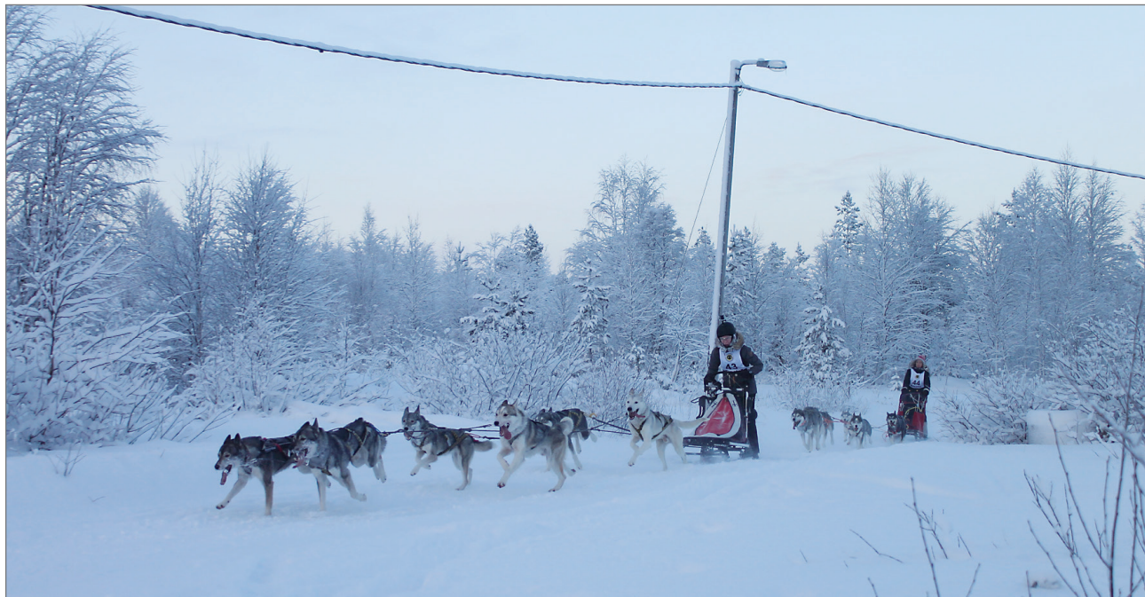
Maalisuoralla käytiin tiukkaa kamppailua siperianhuskyjen kesken.

Syötteellä kisaamassa oli myös MM-mitalisteja,