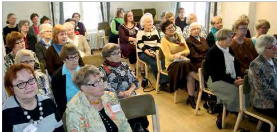
Naisten päivässä tutustuttiin muun muassa Mariaan ja virsikirjan lisävihkoon.