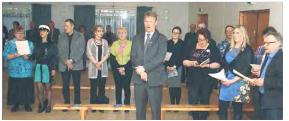
Vihreän vapun juhla aloitettiin Nälkämaan laululla.