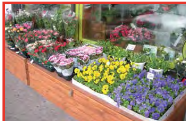
Pudasjärven Hautaustoimisto ja Kukka Ky:n ulkomyymälällä hyvin kevään viileitä kelejä sietäviä ruukkuruusuja, orvokkeja ja krysanteemeja.