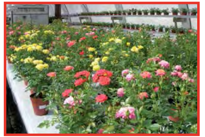
Pudasjärven Puutarha Kukkahuoneen myymälässä Äitienpäiväkukkana suosittuja jaloruusuja.