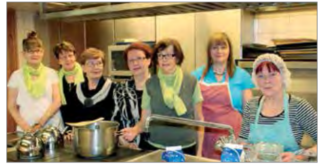
Lions naisklubi Hilimojen leijonat vastasivat maukkaan lohikeiton valmistamisesta ja tarjoamisesta.

asuntojen lisäämistä sekä ikäihmisten hyvinvointipalvelujen kehittämistyötä kotona asumisen ja arjen turvan lisäämiseksi. Tässä työssä hyödynnetään erilaisia teknologiaratkaisuja, jota kautta mahdollistetaan