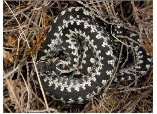
Selässä kyy on koko mitalla on sahalaitakuvio, jota mustilla kyillä ei välttämättä näy.

Edellä kuvattujen selvitysten lisäksi Oulun yliopiston tekee Helsingin yliopiston ympäristöekonomian tutkijoiden johdolla arvottamistutkimuksen kalastusluvan ostaneille syksyllä 2010. Siinä tutkitaan erityisesti vaelluskalojen palauttamisen mahdollisia hyötyjä. (rr)