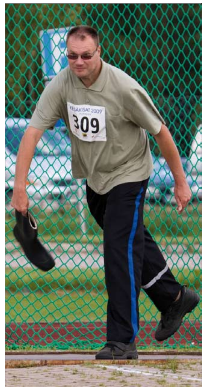
Saapas sai kyytiä lähes sadalta osallistujalta.