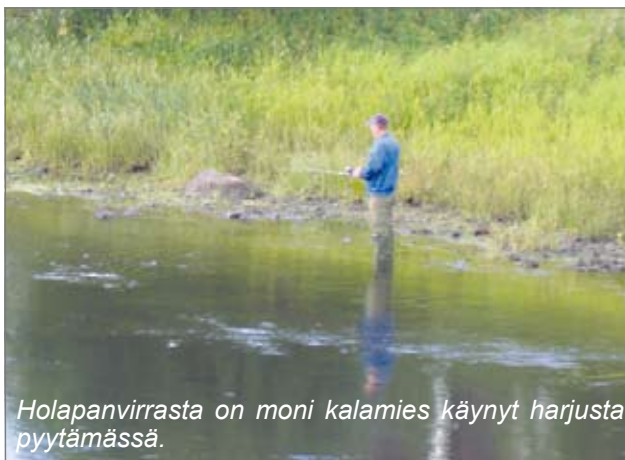
Holapanvirrasta on moni kalamies käynyt harjusta pyytämässä.

Kyläseura puuhaa Holapan pihamaalle kahviontapaisen, josta saa kahvia ja naisten leipomia munkkeja. (rr)