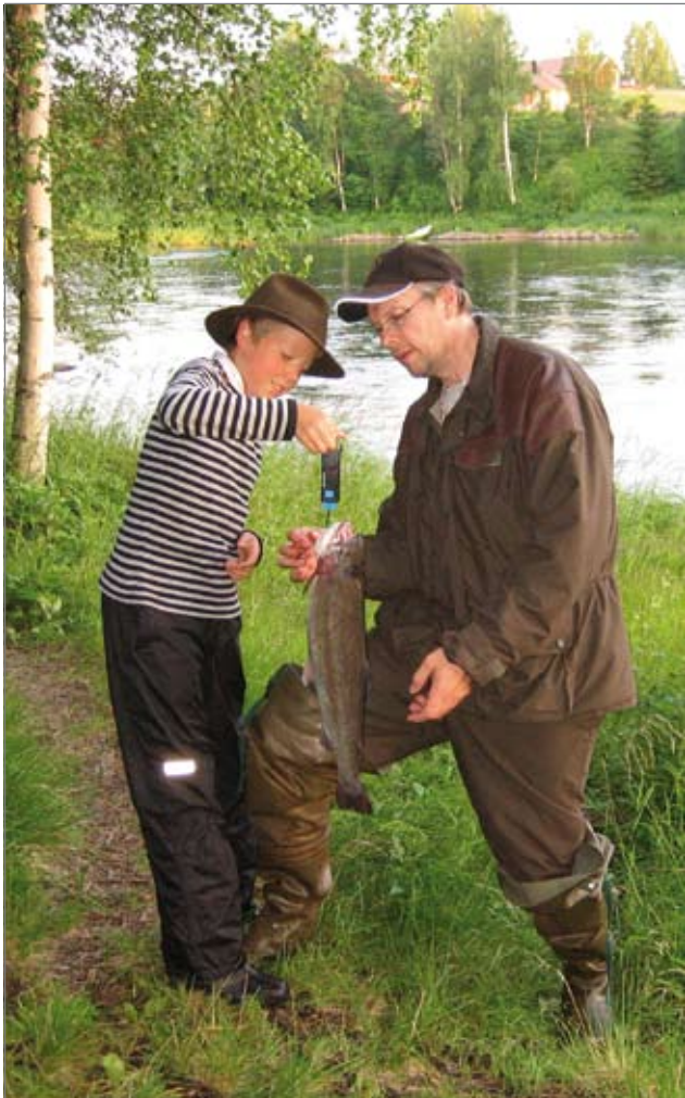
Iloinen kalastajapoika isänsä kanssa Ijoen Jaaska-monkoskella.