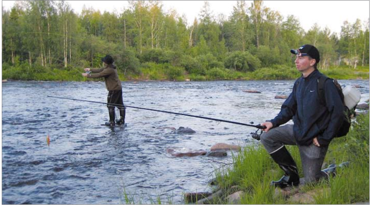
Nuoria matkailevia kalamiehiä Livojoen Kynkäänkoskella.

Kun yksityinen rahoitus kokonaisuudessaan on selvillä, voidaan hanke-esitys lähettää käsiteltäväksi Pudasjärven ja Taivalkosken kunnalle. Hankkeen kuntarahoitusosuudeksi on esitetty 20 prosenttia. Hanketta on tarkoitus esittää