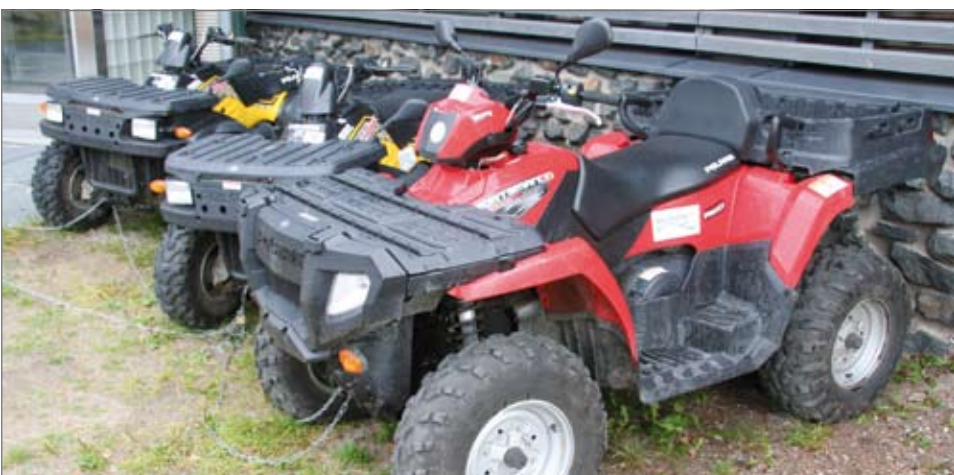
Iso-Syöteen hotellin edustalla on mönkijöitä päivittäisiä mönkijäsafareita varten.