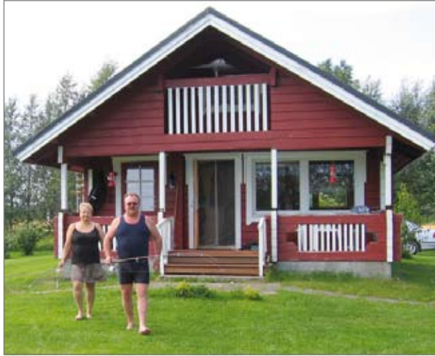
Juhan ja Päivin mökki on rakennettu 15 vuotta sitten. Se on haluttu pitää mökkinä, joten sieltä puuttuvat esimerkiksi sähköt ja vesivesi.

Korpijoki lähtee jatkamaan matkaansa kohti Jaurakka-järveä.