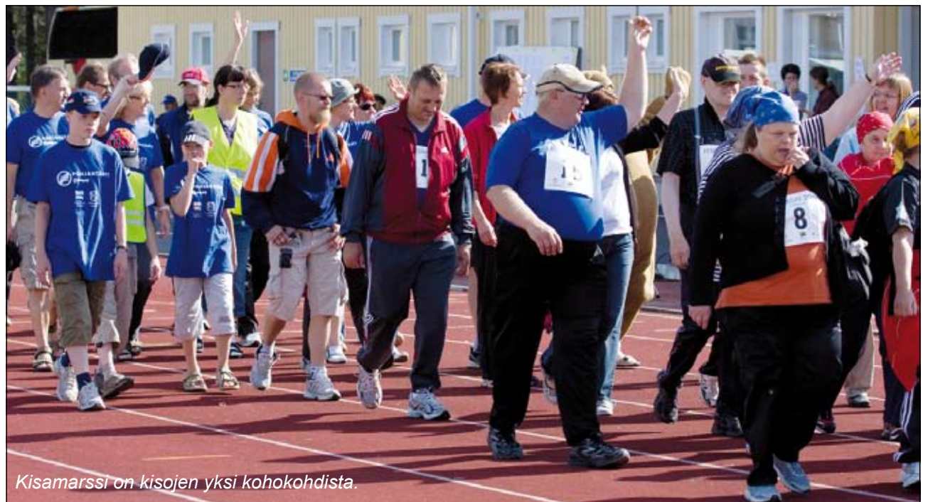
Kisamarssi on kisojen yksi kohokohdista.