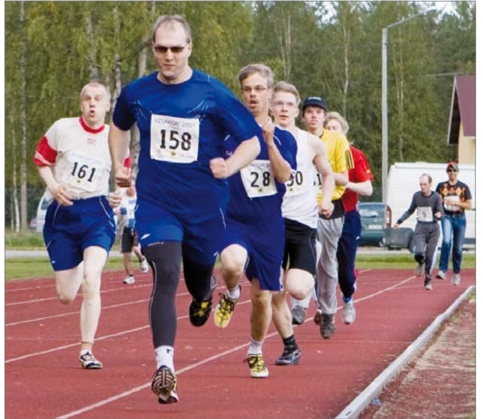
Miesten 400 metrin juoksussa menttiin vauhdikkaasti.

Pohjois-Pohjanmaan tukipiirin 25. kesäkisat kokosivat kilpailijoita yli 300 Pudasjärven Suojalinnan kentälle. Väkeä päivän aikana oli kentällä arviolta noin 700 ja ilmassa oli suuren urheilujuhlan tuntua.