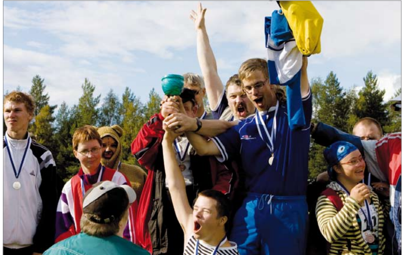
Viestin voittajaksi tänä vuonna tuli Raahen kehitysvammaisten tuki ry.