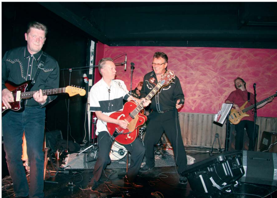
Good Luck Sharm -yhtyeen jäsenet ovat eri ammateissa toimivia miehiä ja esiintymiskeikat tehdään siis oman työn ohella. Keikkoja kertyy kuitenkin vuosittain noin 80.