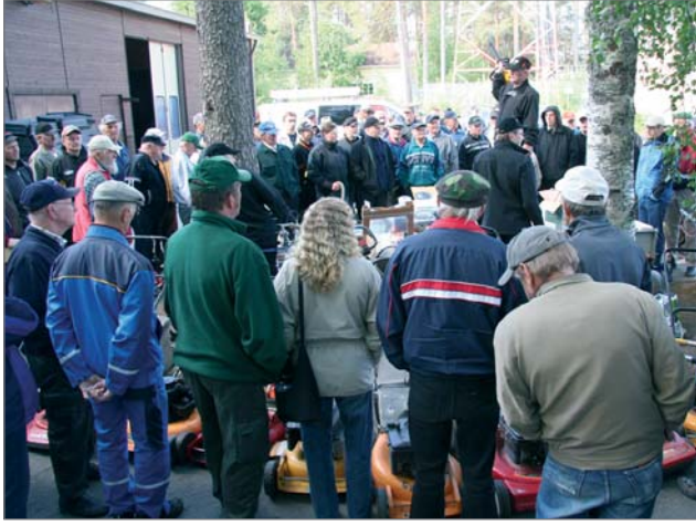
Markkinoiden avauksen aikana oli markkina-alueen tuntumassa Pudas-Koneen perinteinen huutokauppa, joka kokosi ostajia satamäärin.