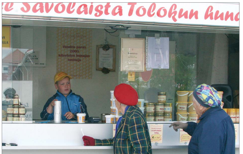
Markkinoiden nuorin, mutta ei suinkaan vähäisin, myyjä oli hunajaa ammattilaisen otteilla kaupannut nuorimies Savosta.