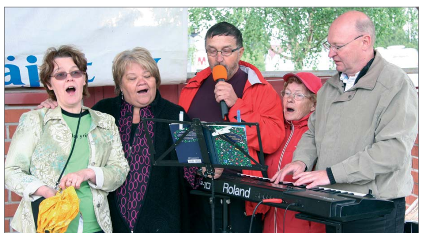
Spontaanisti koottu Markkinakuoro lauloi nätisti Markkinoiden päätteeksi.