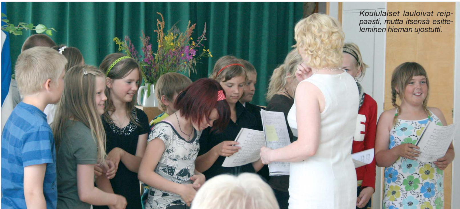
Koululaiset lauloivat reippaasti, mutta itsensä esittelemisen hieman ujosutti.