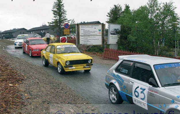
Lupa tuli ja autot lähtivät ajamaan alas