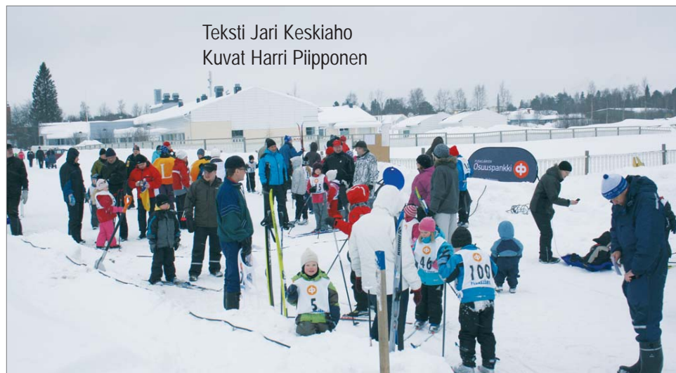
Teksti Jari Keskiäho Kuvat Harri Piiipponen

1. Oona Huhtela 3.09, 2. Emma-Noora Jaakola 3.10, 3. Emma Niskala 3.54, 4. Maria Moilanen 4.24