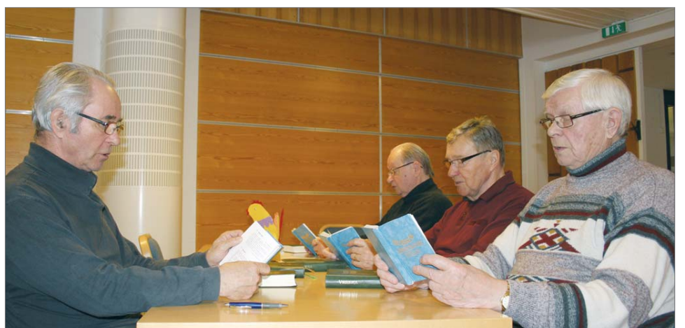
Kokoontumiset ovat myös yhteinen sosiaalinen tapahtuma