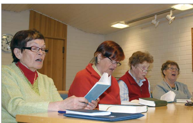
Piirissä laulettavat laulut ovat virsikirjasta kirkkovuosien mukaan ja sopivasti otetaan Iloisen laulajan kirjasta muita lauluja.