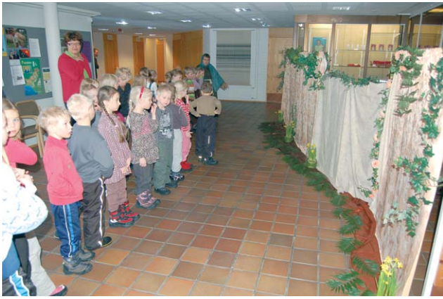
Vaeltajia Jerusalemin muurilla.