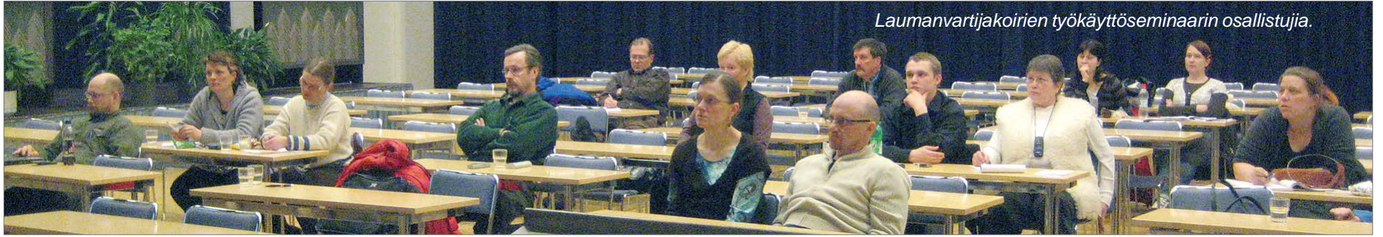
Laumanvartijakoirien työkäyttöseminaarin osallistujia.

Suurpetokantojen kasvun ja uusille alueille levittäytymisen myötä koti- ja tuotantotilanteille kohdistuvien petovahinkojen määrä on lisääntynyt. Laiduntamismahdollisuus on kuitenkin tuotantotilanteiden hyvinvoinnin kannalta merkittävä asia. Suomessa on kuvattu useita laiduntamisen yhteydessä maasuorpetojen aiheuttamia vahinkoja.