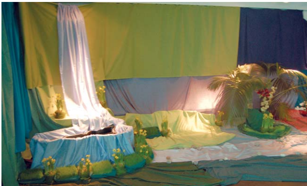
Getsemanen puutarhassa voi kuulla linnunlaulua ja veden solinaa.

Hiljaisella viikolla lapsityöntekijät järjestävät eri ryhmille seurakuntakodilla kolmen päivänä pääsiäisvaelluksen. Vaellukset tapahtuvat oppaan johdolla sisätiloissa.