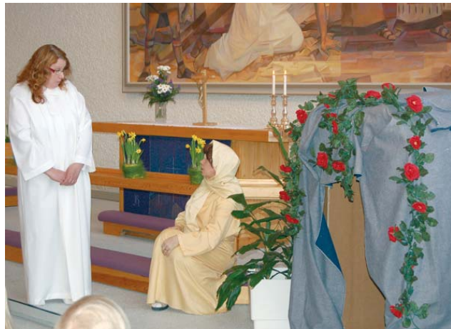
Enkeli näin viestiä tuo, Jeesus on ylösnoussut.