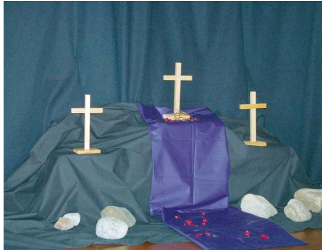
Suuren surun päivä pitkäperjantai.