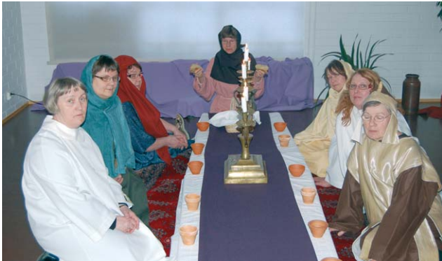
Yläsalissa muistellaan ehtoollisen asettamista.