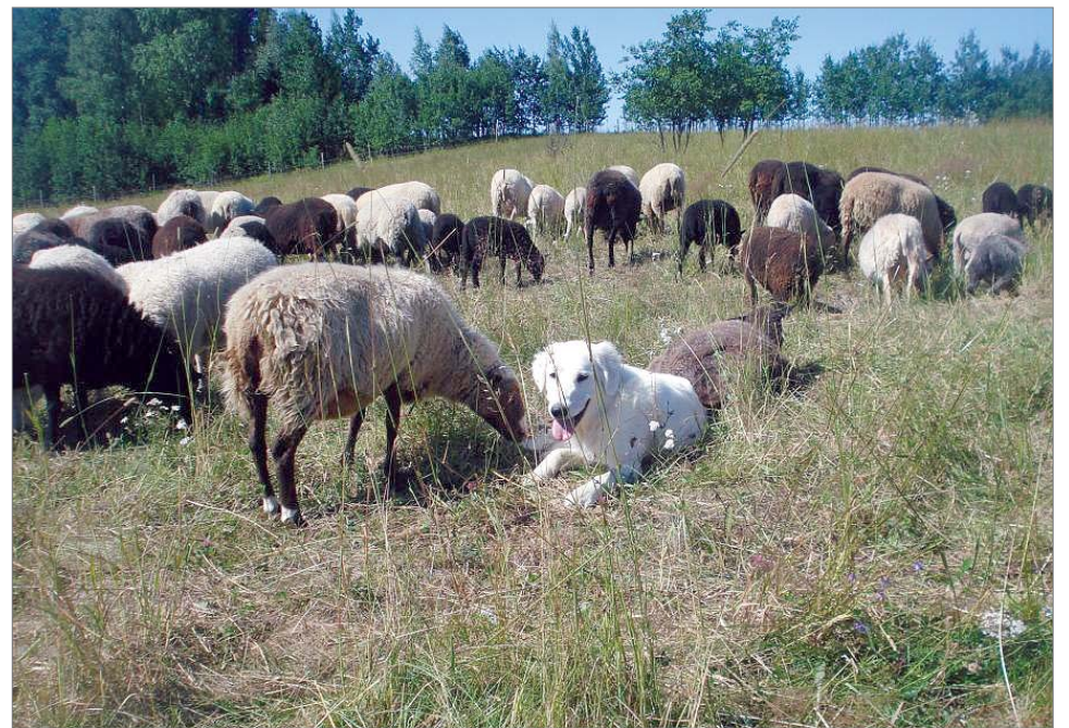
Laumanvartijakoiran tarkoitus on olla ja elää koko ajan vain laumansa kanssa. Koiralle ei opeteta leikkejä tai erityisiä käskyjä.