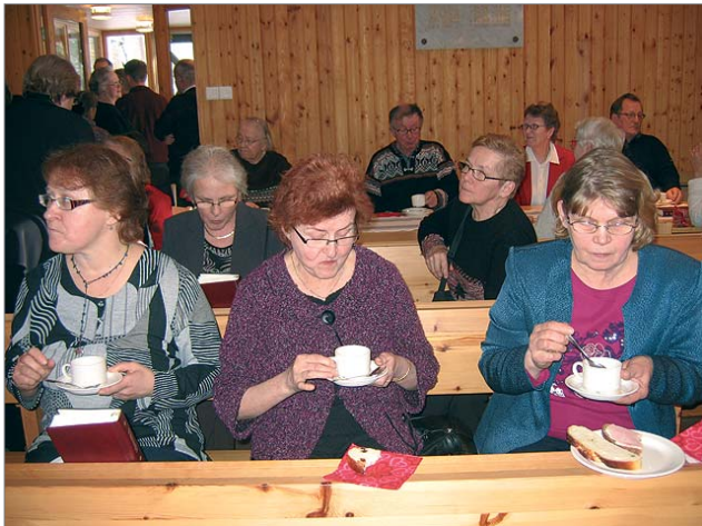
Juhlamessun jälkeen saatiin nauttia Sarakylän naisten järjestämästä kahvitarjoilusta.

käynyt Sarakylällä, jonka keskustassa retkeläiset piipahtivat ennen paluumatkalle lähtöä. Paluumatkalla Matka Puhokselta Korpisen ja Siivikon kautta toiselle laidalle kaupunkia kesti pysähdyksiä noin puolitoista tuntia. Paluumatkalla retkeläiset nauttivat lounaan Syötteen Luontokeskuksessa. Matka sujui turvallisesti Honkasen liikenteen bussilla Heino Honkasen toimiossa linja-auton kuljettajana. (rr)