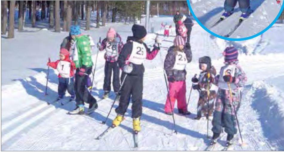
Vuonna 2013 innokkaita hiihtäjiä oli runsaasti.