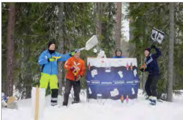
Lumenveistomuotit syntyivät talkoovoimin luontokeskuksen pihamaalle ennen Hankihulinoita.