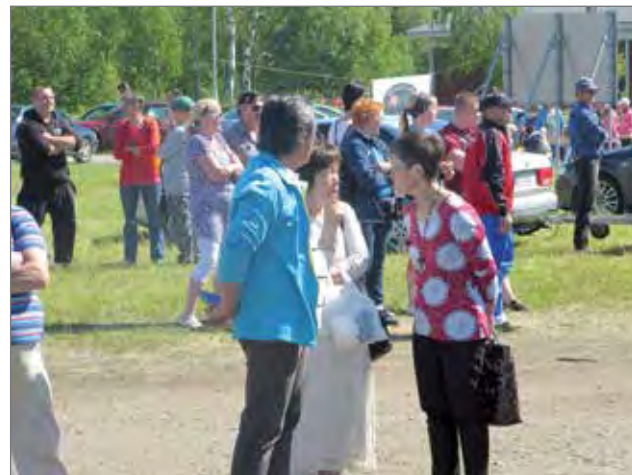
Väkeä viime kesänä Vatungin satamassa Vatunkipäivillä, jossa Kuivaniemen nuorisoseura oli aktiivisena järjestämässä ohjelmaa.