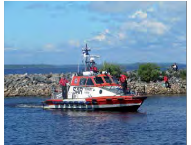
Paikalla satamassa pyörähti myös meripelastusalaus Vatungin kävijöiden ihmeteltävänä.