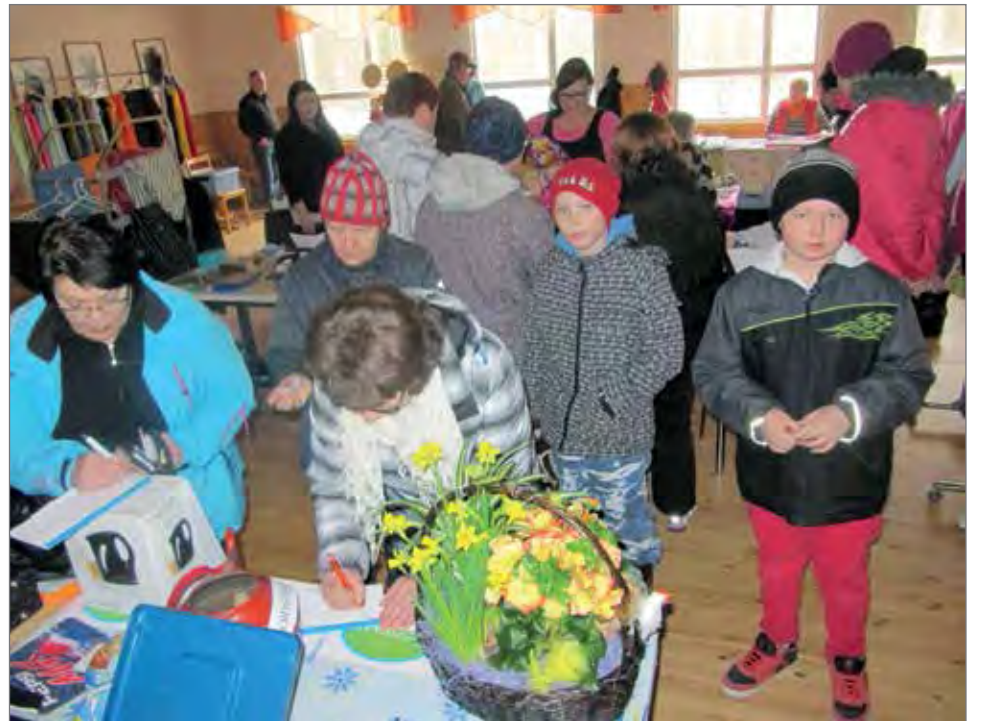
Arpojen täyttöä pääsiäismyyjäisissä viime vuonna. Myyjäiset järjestetään jälleen seuran talolla 28.3.

Virkeän kunnan vapaa-ajan toiminnalle seuralla on tänä päivänä suuri merkitys, mutta vielä suurempi se oli ennen vanhaa. 1900-luvun alkupuolella seurojen talolla järjestettiin römpätansseja, jotka olivat pivoille ja rengeille tärkeä huvittelun paikka. Sadonkorjuun päät-