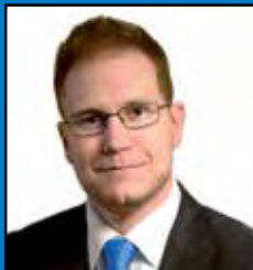
Olli Immonen Kansanedustaja, Oulu