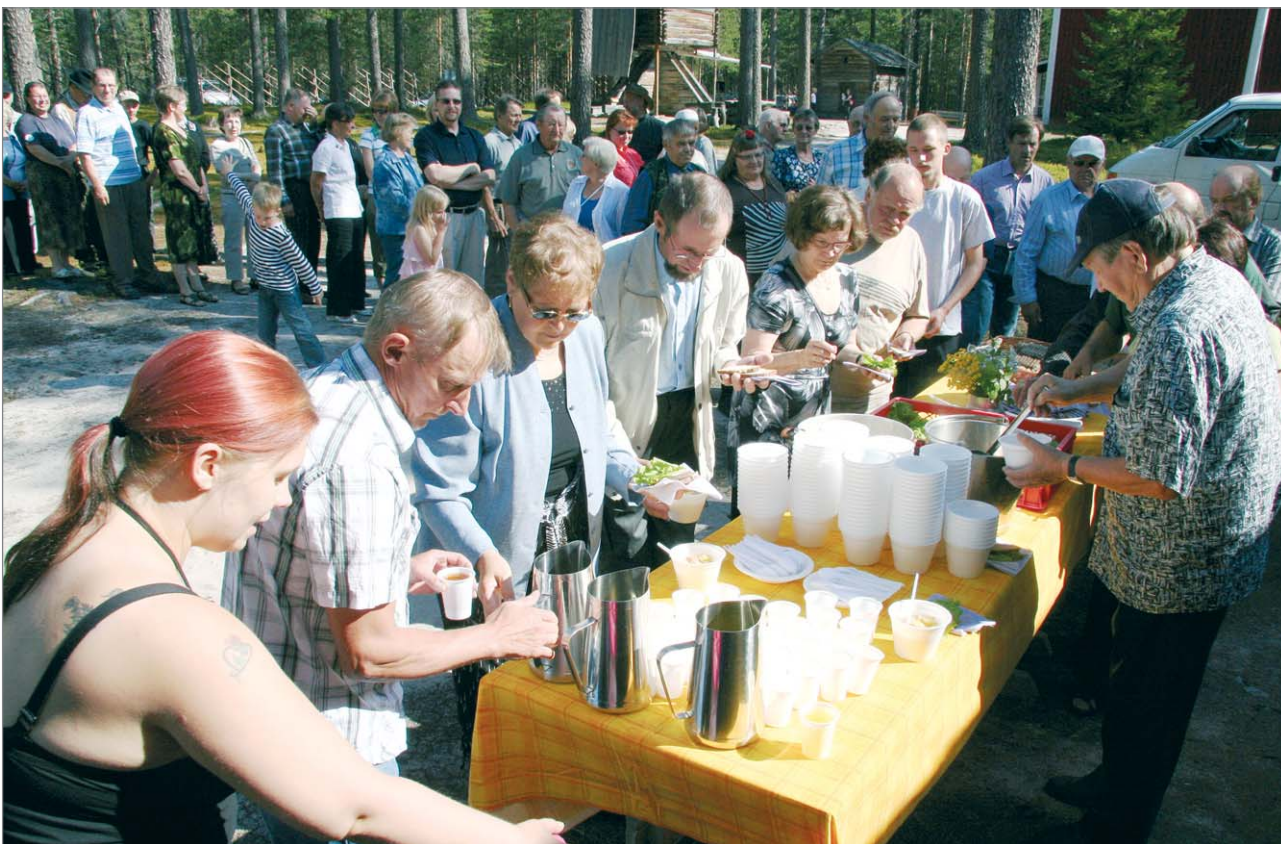
Suomessa ainoastaan Pudasjärvellä järjestetään Metsästäjien kirkkopyhä, johon viime kesänä osallistui runsas määrä metsästyksen harrastajia eri puolilta pitäjää.