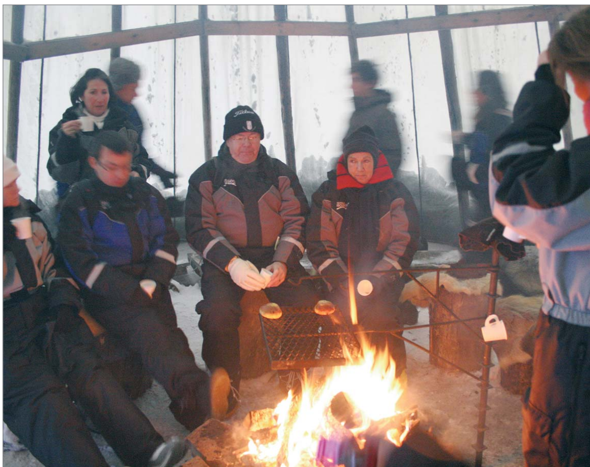
Pullakahvit kodassa maistuivat. Keskellä hollantilainen pariskunta, jotka olivat toista kertaa Suomessa ja olivat valinneet tällä kertaa kohteekseen Syötteen.