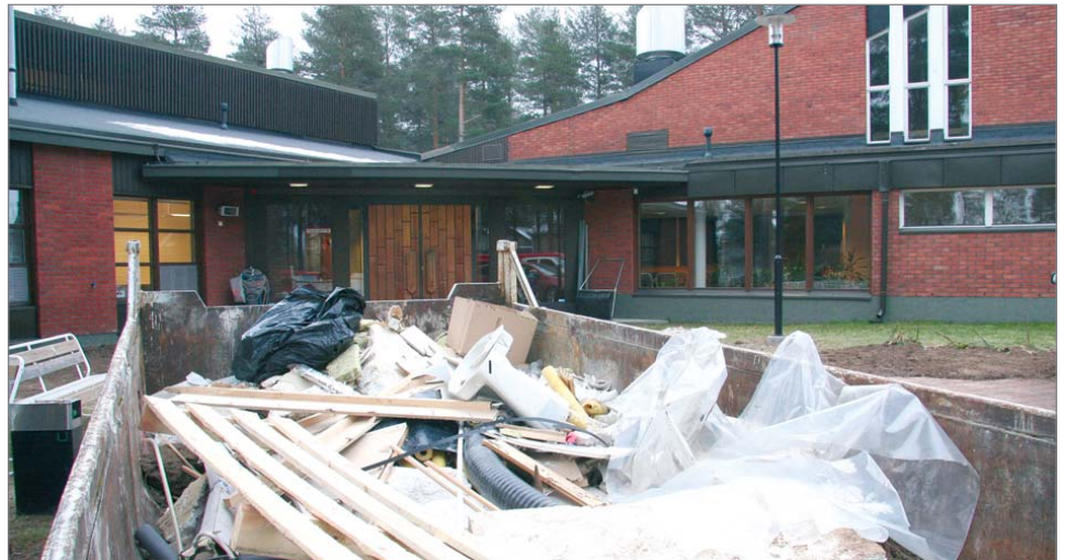
Seurakuntakeskuksessa toteutettiin viime vuoden loka-marraskuussa vesijohtojen saneeraus ja uusittiin valaistus. Kuva otettu marraskuun alussa.

Positiivisena yllätyksenä tuli tieto, että Pudasjärven seurakunta saa kirkon keskusrahastolta harvaan asutun seudun verotulojen täydennystä enemmän, mitä tälle vuodelle on budjetoitu. Työntekijöitä Pudasjärven seurakunnassa on 21 joka tulee pysymään ennallaan. Toimintatilat ovat riittävät ja hyvässä kunnossa. Ne on mitoitettu jopa nykyistä vilkkaammalle toiminnalle. Seurakunta on investoinut voimakkaasti viime vuosina. Uudet urut maksoivat 480 000 euroa, kirkon vieressä oleva kappeli remontoitiin sekä vuonna 2002 oli seura-