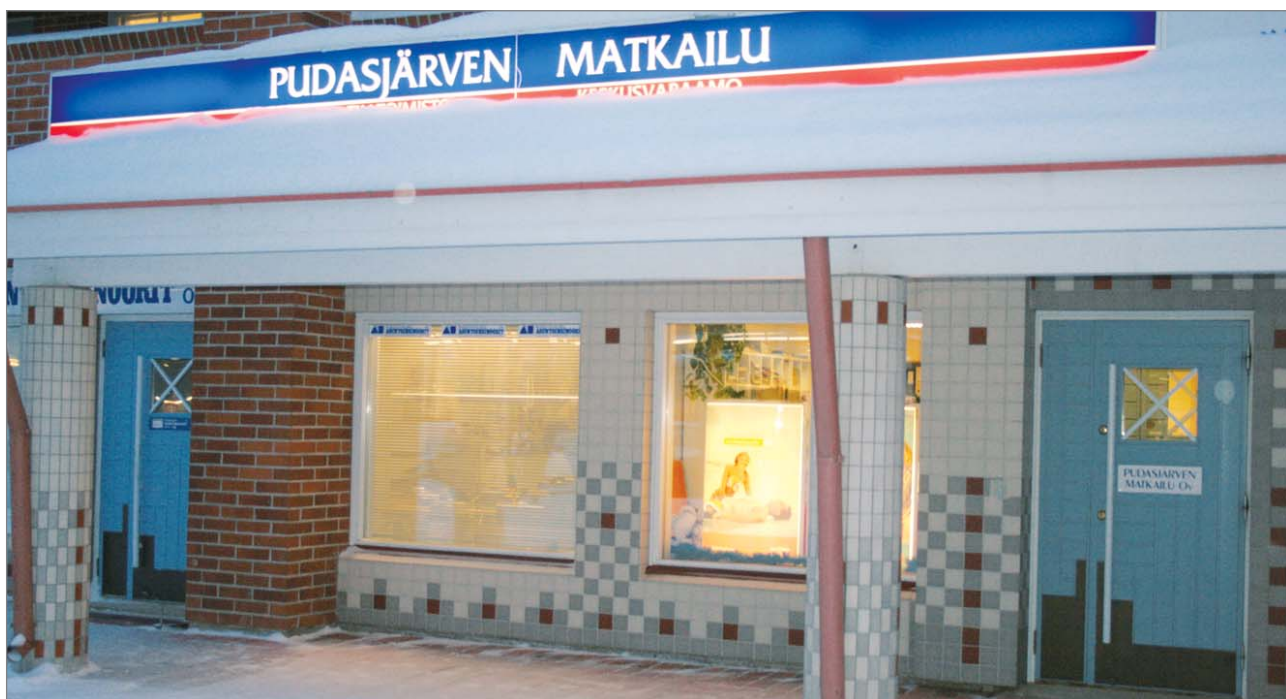
Pudasjärven Matkailu Oy:n matkatoimisto- ja keskusvaraamotoinnot muutti joulukuun alussa Puistotielle torin viereen.

Pudasjärven Matkailu Oy on toiminut myös parinkymmenen vuoden ajan Syötteen alueen keskusvaraamona. Se on Syötteen alueen suurin majoittaja ja yrityksen välityksessä onkin lähes 2000 vuodepaikkaa mökeissä, hotelleissa sekä lomahuoneistoissa. Paikallisen keskusvaraamo keikkuu myös kotimaan keskusva-