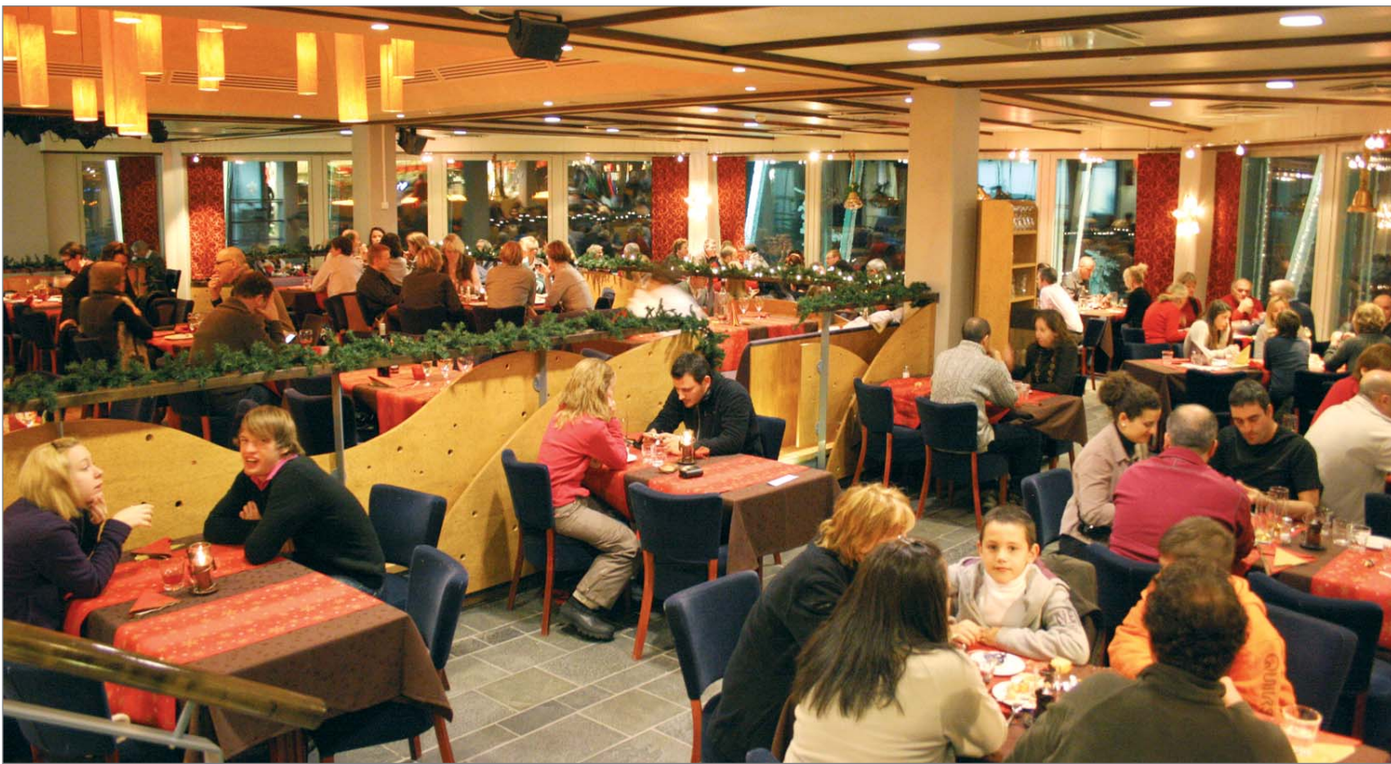
Jouluaaton illallinen kokosi kahdessa kattauksessa Hotelli Iso-Syöteen ravintolan täyteen väkeä.

illalla ja hän olikin suosittu kuvauuskohde. Hyvin monet halusivat itsestään kuvan joulupukin kanssa. Siinä joulupukki hyrisi mielihyvää, kun sai kainaloonsa toinen toistaan nätimpiä naisihmisiä.