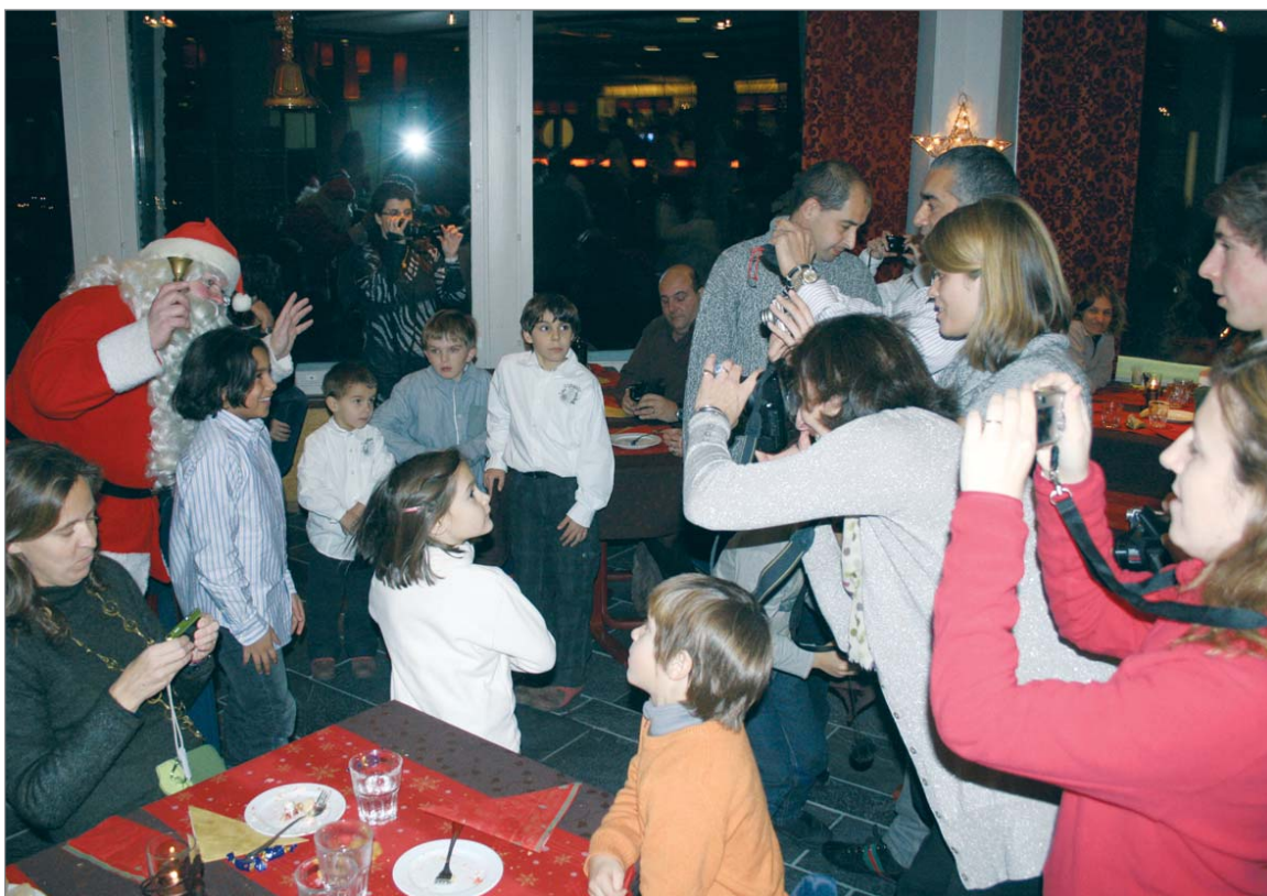
Joulupukkia kuvattiin innokkaasti ja pukin kanssa haluttiin poseerata samassa kuvassa.