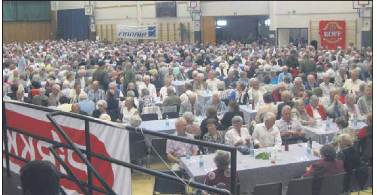
Tapahtumaan oli kutsuttu 1100 vierasta ja kaikki salin istumapaikat täyttyivät.

Finnairin lentävä henkilökunta järjesti perjantaina 13.8 Rosvopaistitapahtuman veteraaneille Pudasjärven liikuntahallilla. Tapahtumia on järjestetty vuodesta 1994 eri puolilla Suomea ja yhteensä niitä on pidetty yli 160. Perinteikkäissä tapahtumissa nautitaan seurasta, ruuasta ja kevyistä ohjelmanumeroista.