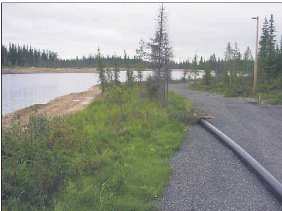
Luppovedestä lähtevä putki on läpimitaltaan 40 cm ja kapenee 16 senttimetriksi hiihtostadionin päässä. Kaikkiaan lumetusjärjestelmään tarvittavaa putkea kaivetaan maahan yli 3 km matkan.