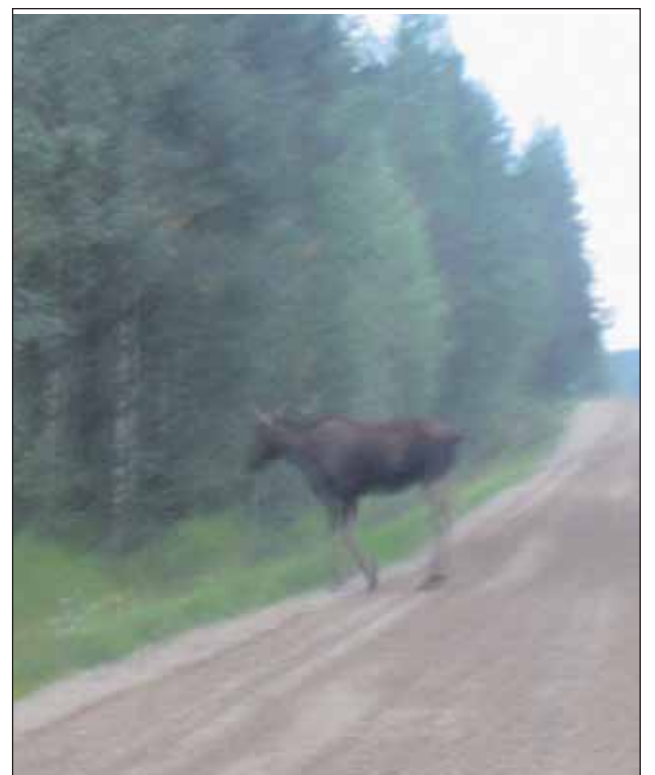
Ilanhämyssä auton eteen juokseva hirvi on arvaamaton tilanne, jota ei aina osaa ennakoita. Hirvikolareilta ei aina vältytä, vaikka eläin näkyisi hetken aikaa. Tänään kesänä on muun muassa muutama moottoripyörilijä menettänyt henkensä. (rr)