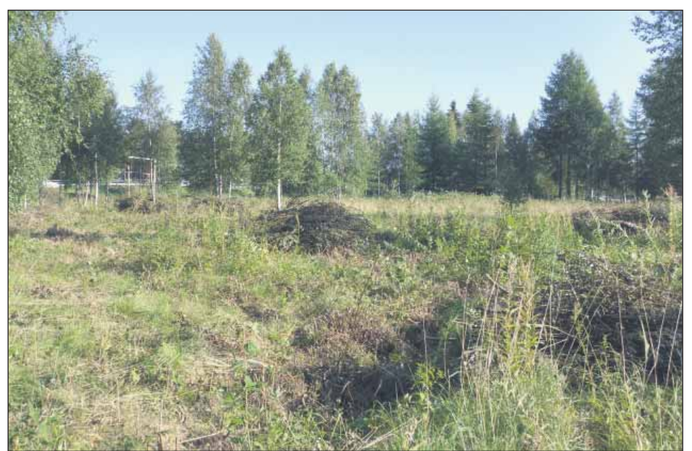
Ankkalinnan villiintynyt ympäristö siistiytyi luottamushenkilöiden talkoissa ja vesat ovat siistissä kasoissa.