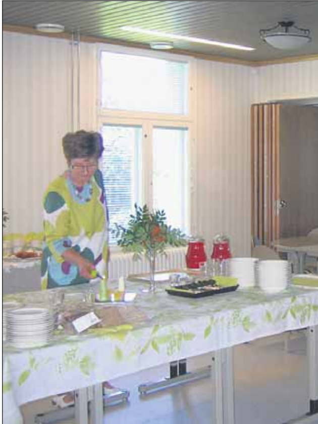
Viihtyisään ruokasaliin mahtuu noin 70 henkilöä yhtä aikaa ruokailemaan.