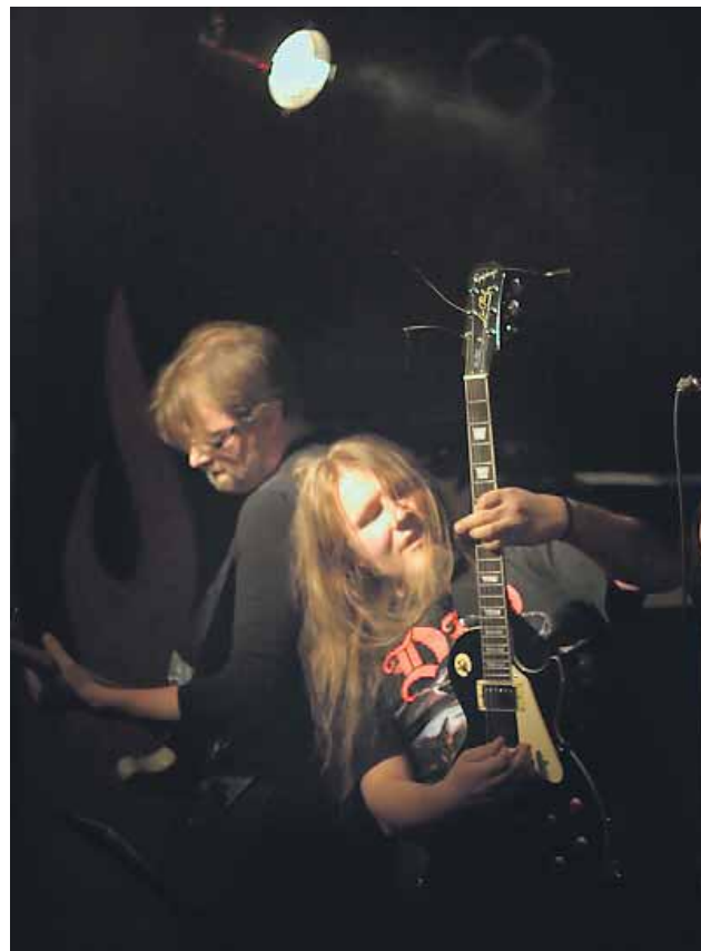
Angry Machines liekeissä Oulun Hevimestassa