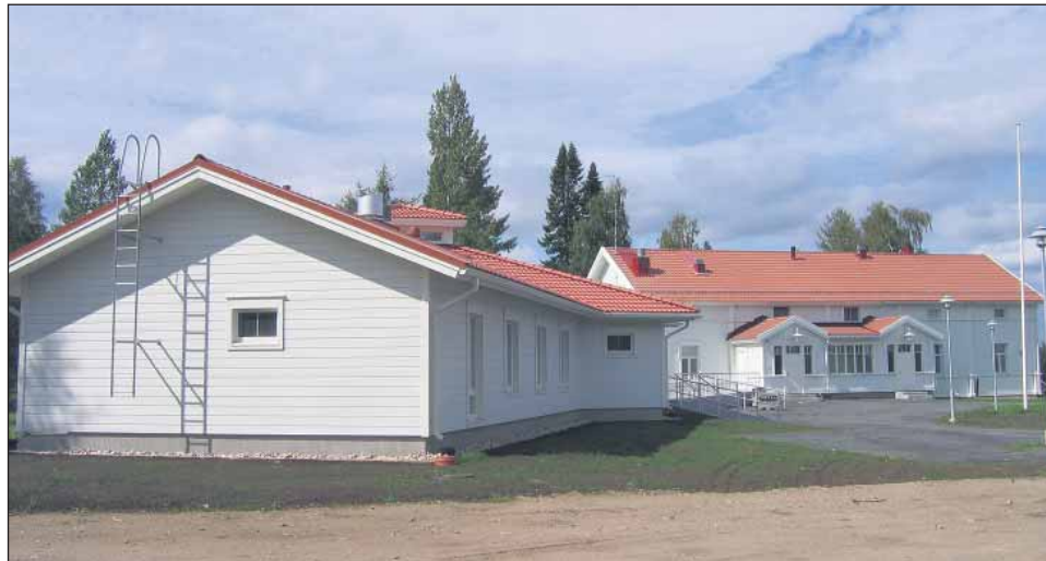
Hilturannan leirikeskuksen uusi yleisilme on viihtyisä ja rauhallinen.

Hilturannan leirikeskuksen väentupa paloi maaliskuun 28. päivänä 2008 käyttökelvottomaksi. Tulipalon jälkeen seurakunta päätti käynnistää uuden rakennuksen suunnittelu- ja valmistelutyöt. Viime syyskuussa alkanut rakennushanke valmistuu aikataulun mukaan, ja uudistunut ja entistä ehompi leirikeskus otetaan käyttöön ensi viikon torstaina 26.8.