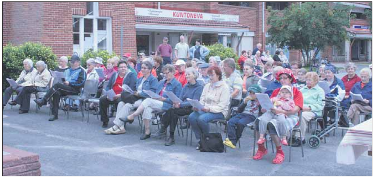
Syöpäyhdistyksen yhteislaulutilaisuuteen osallistui reilut 100 henkeä.