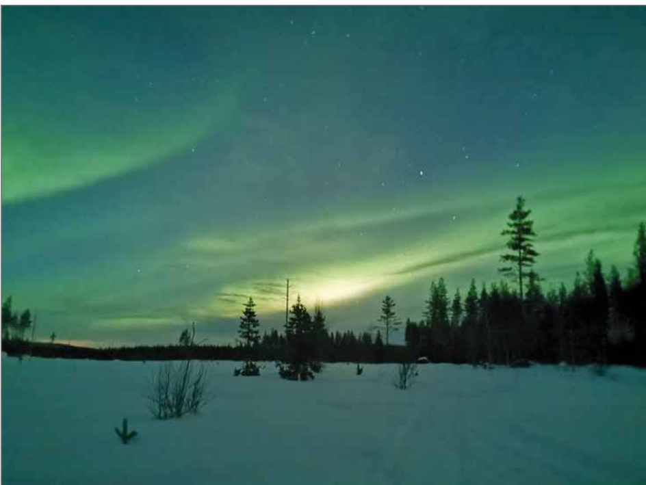
Maaliskuun ennusteet revontulien katseluun näyttävät hyviltä.