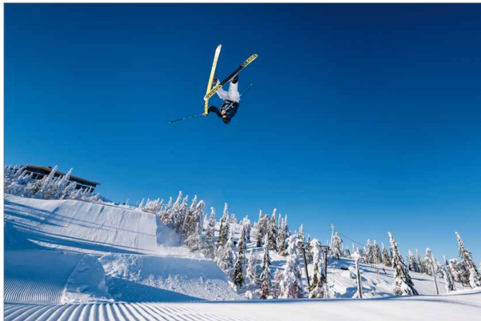
Iso-Syötteen huippuluokan parkit vetävät laskijoita ympäri Suomen.