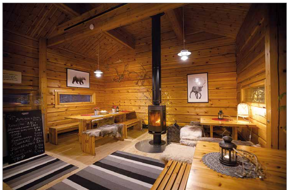
Pytky Café on ollut avoinna pääasiassa viikonloppuisin itsenäisyyspäivästä lähtien. Hiihtolomien alkaessa kahvila ja tilausravintola palvelevat joka päivä.