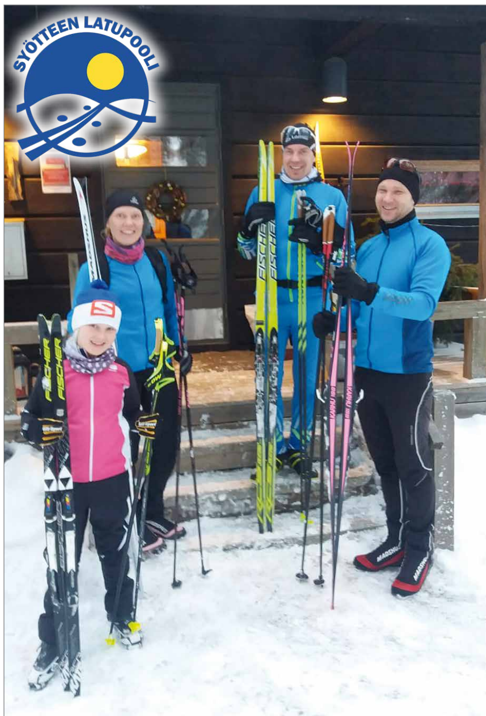
Hiihtäjille Pytky Cafe tarjoaa oivallisen taukopaikan. Uutta on kahvilapalvelu myös rinekahvilassa.