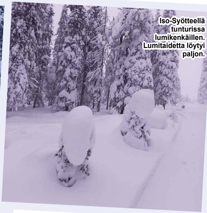
Iso-Syötteellä tunturissa lumikenkäillen. Lumitaidetta löytyi paljon.