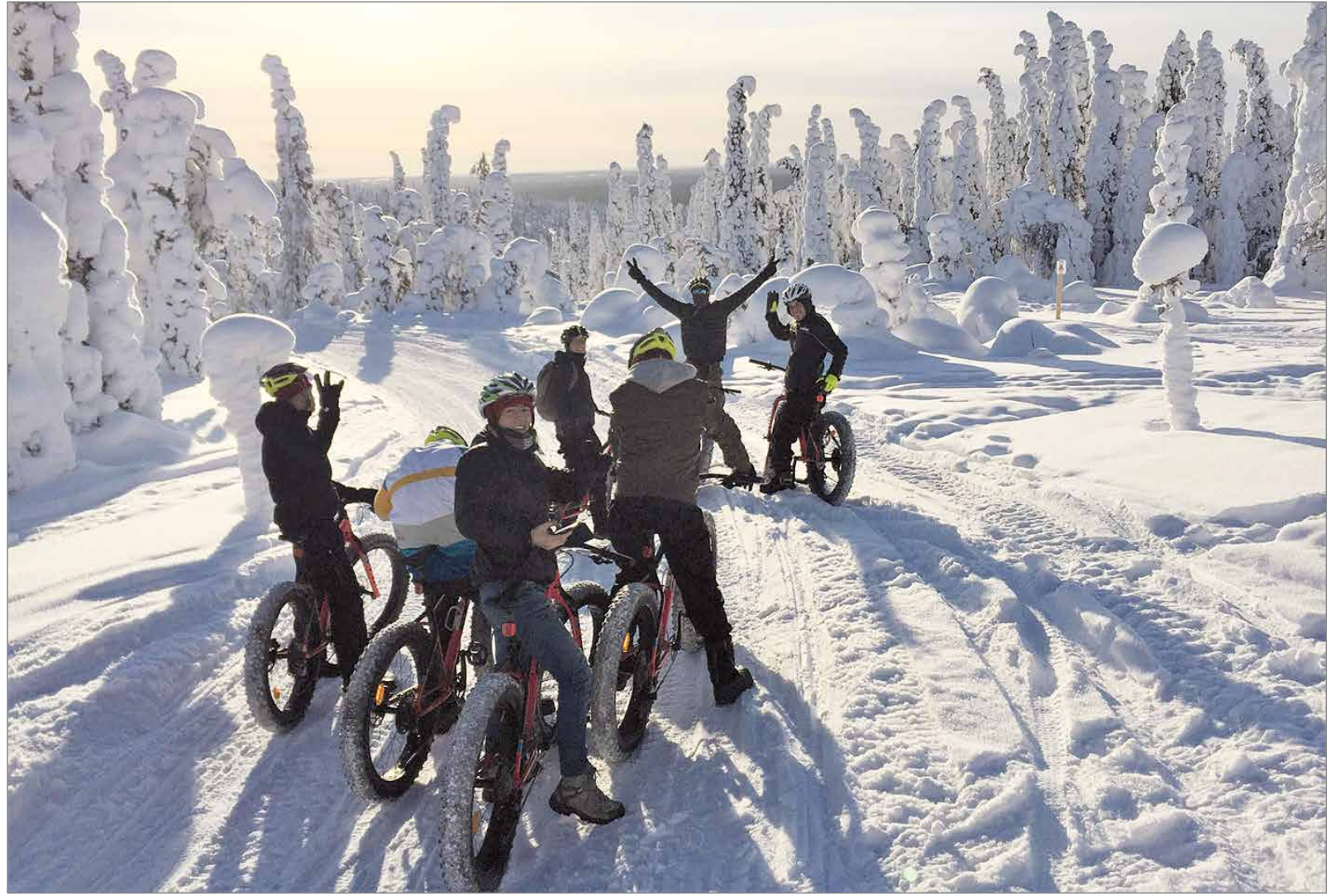
Kansallispuiston talvireiteillä voi liikkua läskipyörällä, hiihtäen, lumikengin tai vaikka kävellen, jos reitti ei upota.

Kansallispuiston talvireiteillä voi liikkua läskipyörällä, hiihtäen, lumikengin tai vaikka kävellen, jos reitti ei upota. Reitit kulkevat samoille tuville kuin hiihtoladutkin, mutta hieman eri kautta. Kartan talvireiteille voi lunastaa Syötteen luontokeskuksesta tai ladata netistä. Reittejä ylläpidetään moottorikelkalla pääasiassa arkena, joten huomioithan, että heti lumipyryn jälkeen reitti voi olla paikoitellen