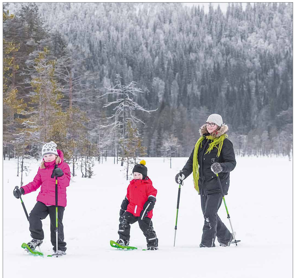
Luontokeskuksesta lähtee 4,5 kilometrin mittainen merkattu lumikenkäreitti Teerivaaraan.

Luontokeskuksesta lähtee 4,5 kilometrin mittainen merkattu lumikenkäreitti Teerivaaraan. Laelta aukeavat upeat näkymät yli kansallispuiston. Seikkailijat