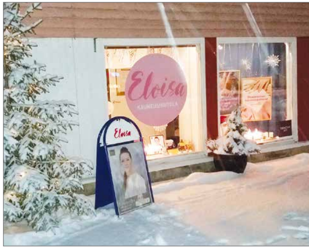
Kauneushoitola sijaitsee aivan Taivalkosken keskustassa, torin kupeessa, Kirkkotiellä.

Kyseisiä tuotteita löytyy myös asiakasmyyntistä. Myös jalkahoitotuotteita löytyy asiakkaille, mm jalkarasvat, lampaanvilla,