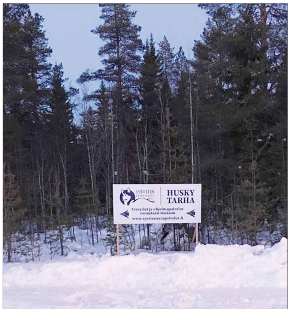
Uudet opasteet helpottavat huskytarhalle osaamista.

"Vauhdikas koiravaljakkoajelu hiljaisessa tunturimaisemassa on elämys, joka Syötteellä vierailevan kannattaa kokea". HT