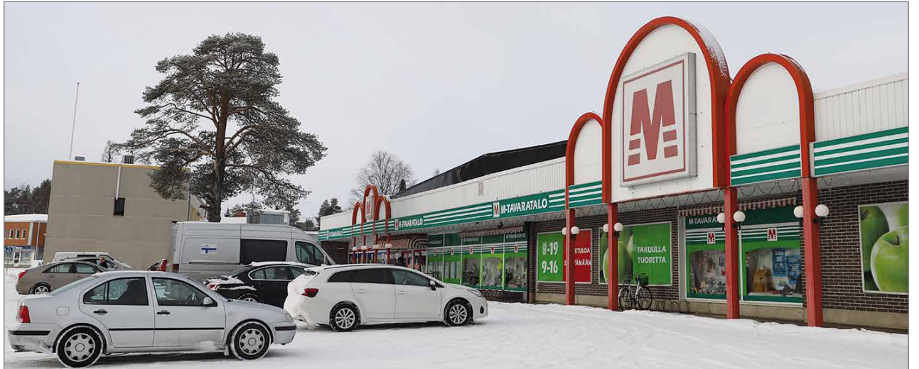
Hiihtolomalaisetkin löytävät M-Tavaratalon runsaasta valikoimasta tarvitsemansa tuotteet.

Hän uskoo liikkeen valoisaan tulevaisuuteen ja lupaa valikoimien jatkossakin säilyvän monipuolisina periaatteella "kaikki tarvittava löytyy saman katon alta". MTR