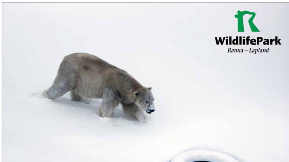
Jääkarhu-uros Nord on viettänyt ensimmäiset päivät uuteen kotiinsa ja hoitajiinsa tutustuen.