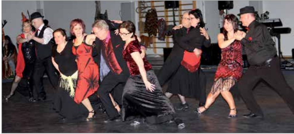
Kansalaisopiston ryhmän argentiinalaisen tangon tanssin riemua.