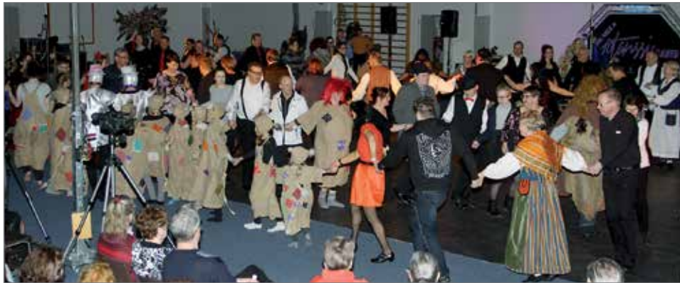
Poloneesi-päätöstanssiin haettiin myös yleisöä mukaan ja peikoiksi pukeutuneet kansalaisopiston lasten ja nuorten näytelmäryhmäläiset olivat innolla mukana.

KurenTanssi -tapahtuman jälkeen oli tanssit, jossa musiikista vastasi Aki Mäki & 10tanssi Band. HT