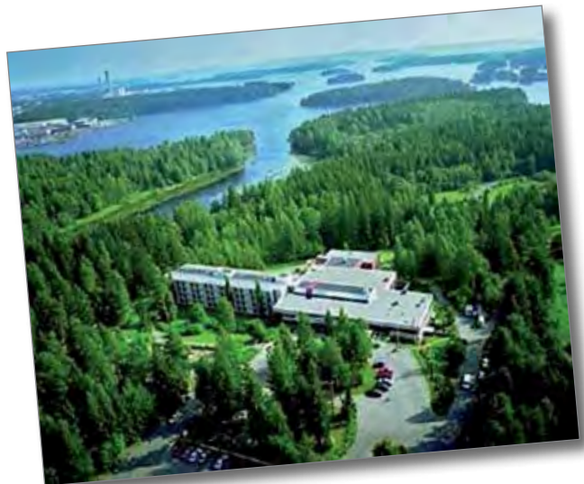
Rauhalampi sijaitsee Kuopion eteläpuolella lähellä Kalavettä.

Maksaessasi jäsenmaksun ilman viitenumeroa, kirjoita viestikenttään yhteystietosi (nimi ja osoite) jäsenrekisteriämme varten. Yritys- ja yhteisöjäsenen jäsenmaksu on 100€/vuosi ja yksityishenkilöiltä 10 €/vuosi. Jäsenille toimitamme kerran vuodessa kirjeen, jossa kerromme toiminnastamme. Jäsenenä sinulla on mahdollisuus vaikuttaa siihen, millä tavoin edistämme paikallisten perheiden hyvinvointia.