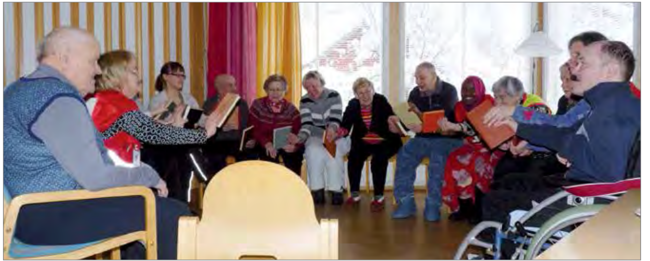
Ohjattu kirjajumppa oli mukavaa.

Palvelukeskuksen aulassa oli harjoituksen evakuointikeskus, jossa evakuoitavien nimet sekä tulo- ja lähtöaika kirjattiin muistiin. Evakuointikeskuksen vastuuhenkilö-