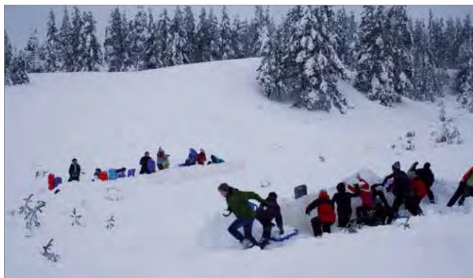
Ranskalaisuomalainen lumisota.

-Kahden viikon aikana sai tutustua entistä paremmin ranskalaisiin ystäviin ja saimme viettää ikimuistoisia hetkiä heidän kanssaan. Yhteisen kielen puuttuessa englannin kielen käyttämiseen tuli lisää varmuutta. Lisäksi tuli käytyä monissa sellaisissa paikoissa, joihin ei olisi tullut lähdettyä ilman vieraitamme (esim. jäänmurtaja, Arktikum). Kohokohtia on monia, ja niistä on mahdoton valita parasta. Lähinnä mieleen on jäänyt kokonaiskuva mukavasta kaksiviikkoisesta