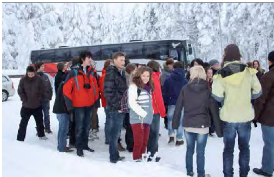
Lähtötunnelmissä.