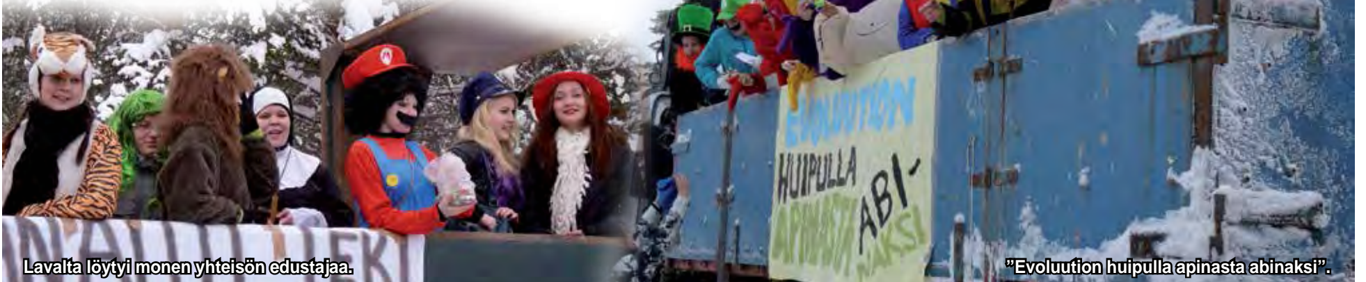
Lavalla löytyi monen yhteisön edustajaa.