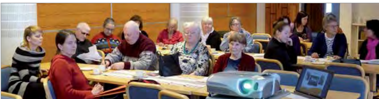
Ommaishoitajafoorumin tilaisuuteen kokoontui 35 henkilöä.