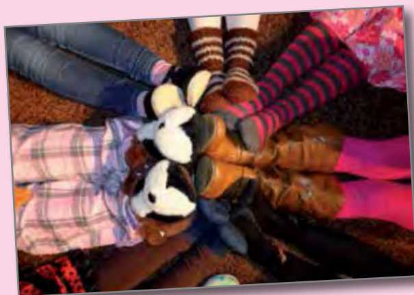
Ystävyyttä on se, kun voi painaa varpaat toisen varpaita vasten.

Tytöt, niin pienet kuin isommatkin, totesivat, että parasta ystävydessä on se, että kun voi luottaa toiseen