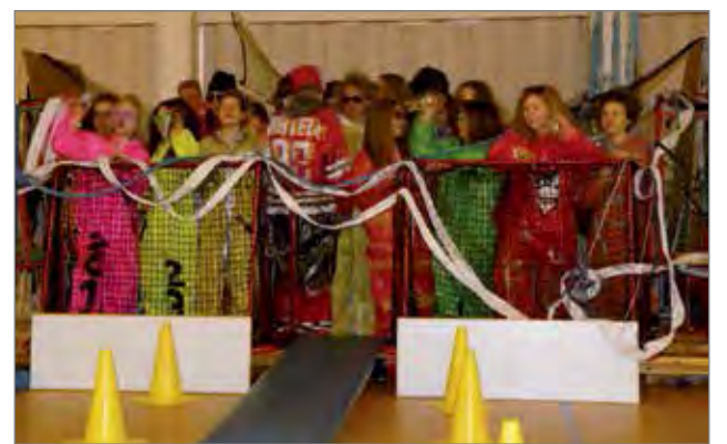
Rimminkankaan lukion kolmosluokan abit riemuitsivat häkissä.

kakkosluokkalaiset juhlivat vanhojen päivän tansseissa pukeutuneena parhaimpiin juhla-asuihinsa. Vanhojen päivän tanssit järjestettiin päivällä Kansalaisopiston salissa ja illalla vielä toinen esitys kutsuvieraille. Päivällä Kansalaisopiston saliin oli kokoontunut noin 60 henkeä.