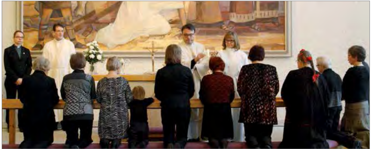
Lähimmäispalveluystäviä oli siunattavana 10 henkilöä. Aikaisemmin on valmistunut lisäksi viisi lähimmäispalveluystävää.

Seurakuntakeskuksessa pidettyyn juhlamessuun osallistui lähes 200 hen-