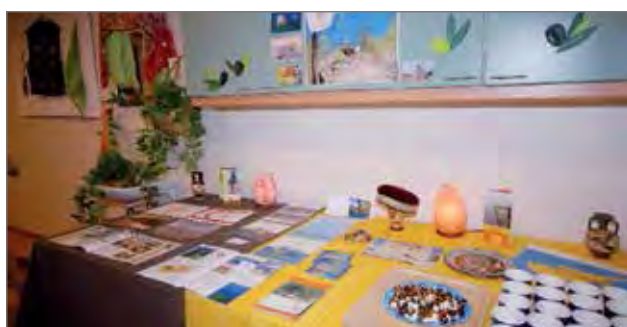
Kyproslaisilla oli tarjolla makuupalana fetajuustoa, oliivia ja aurinkokuivattua tomaattia sekä rypälemehua.