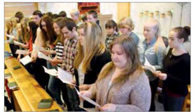
Rippikoulun isoiksi valmistuneilla oli takanaan puoleentoista vuoden koulutus.